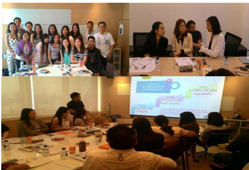
กิจกรรมวันซีเอสอาร์