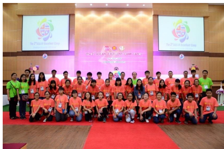
ภาพ: KTIS “ASEAN Excellent Camp” 2016

ในปีที่ผ่านมา กลุ่ม KTIS ได้ร่วมกับมหาวิทยาลัยเจ้าพระยาซึ่งเป็นสถานศึกษาในเครือ ร่วมกันจัดกิจกรรมค่ายเยาวชนอาเซียน “ASEAN Excellent Camp” โดยมีเยาวชนจำนวน 102 คน จาก 4 ประเทศ ได้แก่ ไทย สาธารณรัฐสังคมนิยมเวียดนาม สาธารณรัฐประชาธิปไตยประชาชนลาว และราชอาณาจักรกัมพูชา วัตถุประสงค์เพื่อเสริมสร้างและพัฒนาความรู้ ความเข้าใจในบทบาทหน้าที่การเป็นพลเมืองที่ดีในประชาคมอาเซียนผ่านกระบวนการเรียนรู้ที่สร้างสรรค์โดยมุ่งเน้นไปที่การพัฒนาบุคลิกภาพ การปรับตัวเข้ากับสังคม ความสามัคคี และการแลกเปลี่ยนวัฒนธรรมประเพณีระหว่างประเทศ โดยเยาวชนที่เข้าร่วมนั้นจะใช้ภาษาอังกฤษเป็นภาษากลางในการสื่อสารและดำเนินกิจกรรมต่างๆ ภายในค่าย เพื่อตอบรับการเปิดประเทศสู่ประชาคม AEC อย่างสมบูรณ์