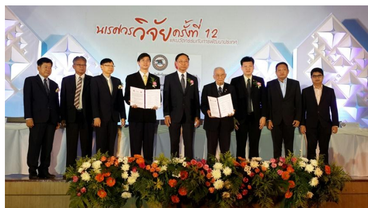
ภาพ: ลงนามในบันทึกข้อตกลงความร่วมมือ (MOU) กับมหาวิทยาลัยนเรศวร

ภายใต้กระแสของโลกยุคโลกาภิวัตน์ที่หมุนไปอย่างไม่หยุดยั้ง การพัฒนาเทคโนโลยี หรือนวัตกรรม รวมถึงการเผยแพร่ความรู้ข่าวสารตามช่องทางต่างๆ ก็เป็นสิ่งทีกลุ่ม KTIS ตระหนักถึง และมุ่งมั่นที่จะพัฒนานวัตกรรมใหม่ๆ มาประยุกต์ ปรับใช้กับชุมชนสิ่งแวดล้อม เพื่อให้เกิดประโยชน์แก่ทุกฝ่าย ลดค่าใช้จ่ายรวมถึงลดการทำงานที่สูญเปล่า โดยมุ่งหวังให้ธุรกิจ ชุมชน และสังคมสามารถอยู่ร่วมกันได้อย่างมีความสุข ยั่งยืน มีศักยภาพ ทั้งนี้ ปี 2559 ที่ผ่านมา กลุ่ม KTIS ได้ลงนามในบันทึกข้อตกลงความร่วมมือ (MOU) กับหน่วยงานราชการและสถานศึกษาหลายแห่ง อาทิ มหาวิทยาลัยเทคโนโลยีพระจอมเกล้าธนบุรี มหาวิทยาลัยเชียงใหม่ มหาวิทยาลัยนเรศวร สถาบันวิจัยวิทยาศาสตร์และเทคโนโลยีแห่งประเทศไทย ทั้งนี้ การลงนามใน MOU กับแต่ละหน่วยงานนั้นจะมีหัวข้อที่ร่วมกันศึกษาแตกต่างกันตามความถนัด แต่จุดมุ่งหมายเพื่อพัฒนาด้านภาคเกษตรเพื่อให้สอดคล้องกับนโยบายรัฐ Thailand Industry 4.0 ในการพัฒนานวัตกรรมและเทคโนโลยีต่างๆ มาเพิ่มประสิทธิภาพและประสิทธิผลของกระบวนการผลิตของกลุ่ม KTIS รวมทั้งเพิ่มผลผลิตในไร่อ้อยของชาวไร่อ้อยคู่สัญญาของกลุ่ม KTIS ด้วย