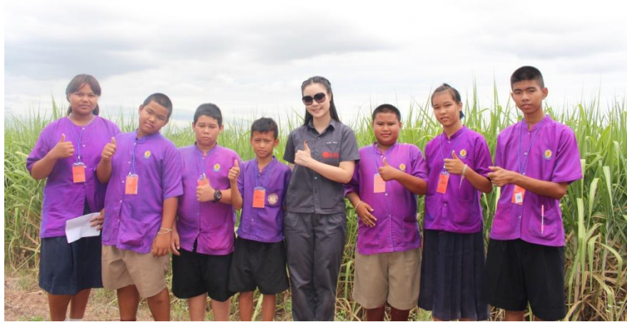
ภาพ: นักเรียน รร.บ้านหาดเสือเต้น จ.อุตรดิตถ์ เข้าร่วมโครงการโรงเรียนเกษตรกรอ้อยตามแนวพระราชดำริ