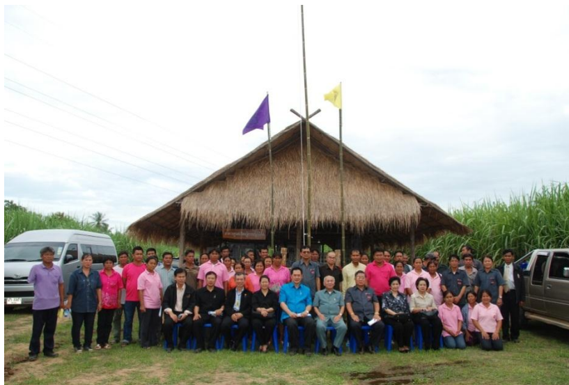
ภาพ: โรงเรียนเกษตรกรอ้อย

ด้วยนโยบายของกลุ่ม KTIS ที่มุ่งเน้นการพัฒนาอย่างมั่นคงและยั่งยืนผ่านการให้ความรู้แก่ชาวไร่อ้อย จึงก่อเกิดโรงเรียนเกษตรกรขึ้น ซึ่งเป็นโครงการที่กลุ่ม KTIS ดำเนินการมาอย่างต่อเนื่อง เพราะเทคนิคหรือวิธีการดูแลอ้อยนั้นมีการพัฒนาตลอดเวลา โดยโรงเรียนเกษตรกรนั้นจะมีการแลกเปลี่ยนความรู้ในด้านของการเตรียมดิน การสาธิตใช้เครื่องมือเครื่องจักร การใส่ปุ๋ย ตามช่วงระยะต่างๆ ของอ้อย ผ่านทีมงานฝ่ายไร่ของกลุ่ม KTIS ซึ่งสถานที่จัดนั้นจะเป็นไร่อ้อยสาธิต เพื่อให้ชาวไร่อ้อยทดลองและลงมือปฏิบัติจริง พร้อมเปิดโอกาสให้ถามและแลกเปลี่ยนความรู้ระหว่างชาวไร่อ้อย