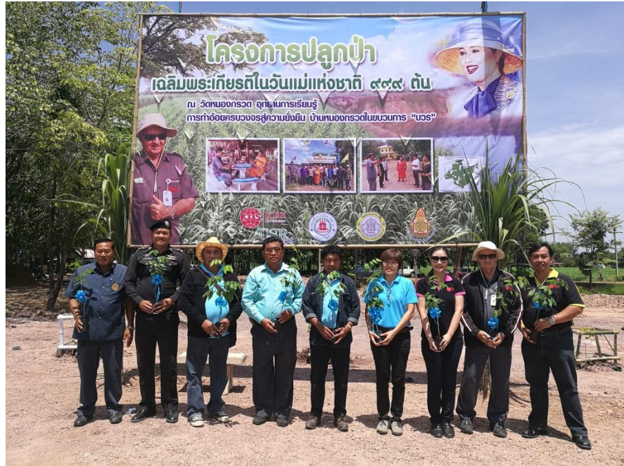
ภาพ: โครงการปลูกป่าเฉลิมพระเกียรติในวันแม่แห่งชาติ 999 ต้น

เป็นโครงการที่จัดตั้งขึ้นเพื่อปลูกต้นไม้จำนวน 999 ต้น เฉลิมพระเกียรติแก่สมเด็จพระนางเจ้าสิริกิติ์ พระบรมราชินีนาถ เนื่องในโอกาสมหามงคล ทรงเจริญพระชนมพรรษาครบ 7 รอบ โดยทางกลุ่ม KTIS เห็นถึงความสำคัญของต้นไม้และป่าที่เป็นจุดกำเนิดของแหล่งน้ำ เป็นที่พอกอากาศและรักษาคุณภาพของดิน ซึ่งเป็นจุดเริ่มต้นการเกษตรภายในประเทศ สอดคล้องกับการผลิตเยื่อกระดาษจากขานอ้อยของกลุ่มที่ช่วยลดการตัดต้นไม้อีกด้วย