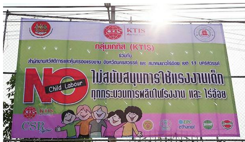
ภาพ: กลุ่ม KTIS ไม่สนับสนุนการใช้แรงงานเด็กในทุกกระบวนการผลิตในโรงงานและในไร้อ้อย

ในด้านของการอยู่ร่วมกับชุมชน (Community Relations) กลุ่ม KTIS ยังคงมีความสัมพันธ์อันดีกับชุมชนบริเวณใกล้เคียง มีการพบปะผู้นำชุมชนอย่างสม่ำเสมอ นอกจากนี้ ยังมีการจัดกิจกรรมต่างๆ เพื่อกระชับความสัมพันธ์ให้ดียิ่งขึ้น เช่น การจัดแข่งกีฬาท้องถิ่น การปฐมนิเทศน์บริเวณชุมชน การเข้าร่วมกิจกรรมต่างๆ กับทางชุมชน เป็นต้น