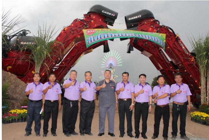
ภาพ: งานอ้อยสดประจำปี

งานอ้อยสดประจำปี จัดขึ้นเพื่อสร้างแรงจูงใจให้เกษตรกรชาวไร่อ้อยคู่สัญญา ตัดอ้อยสดส่งโรงงานแทนอ้อยไฟไหม้ ซึ่งเป็นการจัดต่อเนื่องกันเป็นปีที่ 15 วัตถุประสงค์เพื่อมอบรางวัลแก่เกษตรกรที่ส่งอ้อยสดให้แก่โรงงาน รวมถึงชี้ให้เห็นถึงข้อดีของการปลูกอ้อยสดที่นอกจากจะลดมลพิษที่ออกสู่ธรรมชาติและรักษาหน้าดินในปีการผลิตถัดไปแล้ว ยังช่วยเพิ่มผลผลิตต่อตันอ้อยให้สูงขึ้น โดยปีที่ผ่านมามีเกษตรกรคู่สัญญาเข้าร่วมโครงการมากกว่า 20,000 ราย