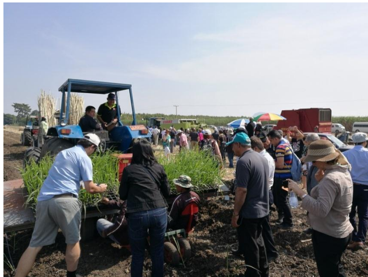
ภาพ: การสาธิตเครื่องจักรกลการเกษตร และพันธุ์อ้อยในอุทยานการเรียนรู้การทำอ้อยครบวงจรสู่ความยั่งยืน

นอกจากนี้ กลุ่ม KTIS ยังได้นำองค์ความรู้ เทคนิคที่ทันสมัยจากประเทศออสเตรเลีย และความเชี่ยวชาญด้านเครื่องมือเครื่องจักรมาต่อยอด พัฒนาเครื่องจักรกลในไร่อ้อยให้เหมาะสมกับสภาพภูมิประเทศ สภาพภูมิอากาศในประเทศไทย อาทิ เครื่องปลูกอ้อยแบบ Sonic เครื่องปลูกอ้อยแบบ Shute Planter เครื่องจักรพรวนดินไสปาย CRB MPI เครื่องตัดอ้อย เป็นต้น และสนับสนุนให้ชาวไร่อ้อยคู่สัญญาเข้ามาใช้ในการทำไร่อ้อย เพื่อให้มีต้นทุนที่ต่ำลง เพิ่มผลผลิตดินต่อไร่ อีกทั้งยังช่วยแก้ปัญหาการขาดแคลนแรงงานในไร่อ้อยด้วย