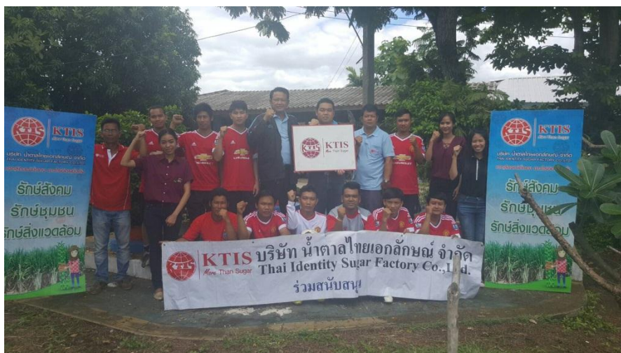
ภาพ: แข่งขันฟุตบอลด้านยาเสพติด