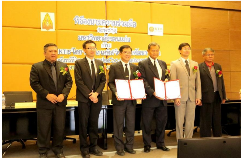
ภาพ: ลงนามในบันทึกข้อตกลงความร่วมมือ (MOU) กับมหาวิทยาลัยขอนแก่น