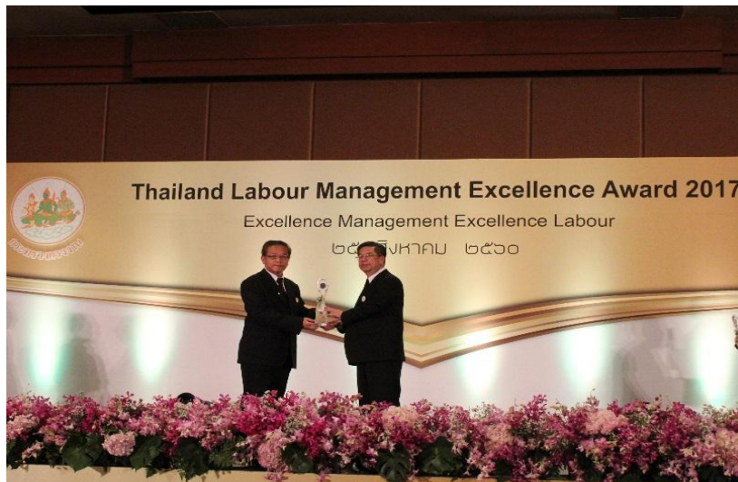
ภาพ: โรงงานน้ำตาลไทยเอกสิทธิ์ฯ ในกลุ่ม KTIS รับรางวัลสถานประกอบการต้นแบบดีเด่นระดับประเทศ ด้านความปลอดภัย อาชีวอนามัย และสภาพแวดล้อมในการทำงาน ต่อเนื่องเป็นปีที่ 5 (ระดับเพชร)