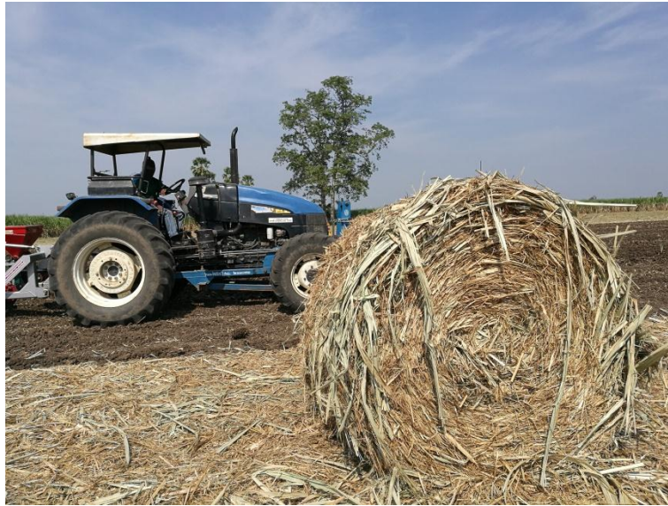
ภาพ: การสาธิตเครื่องจักรกลการเกษตรในไร่อ้อย