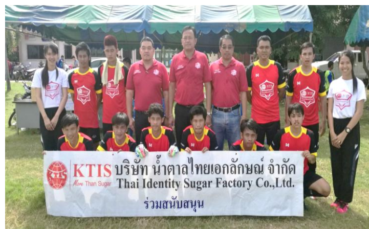
ภาพ: แข่งขันฟุตบอลไทยเอกลักษณ์ FC