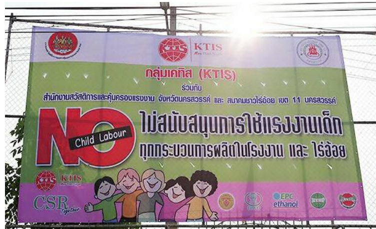
ภาพ: กลุ่ม KTIS ไม่สนับสนุนการใช้แรงงานเด็กในทุกกระบวนการผลิตในโรงงานและในไร่อ้อย

ในด้านของการอยู่ร่วมกับชุมชน (Community Relations) กลุ่ม KTIS ยังคงมีความสัมพันธ์อันดีกับชุมชนบริเวณใกล้เคียง มีการพบปะผู้นำชุมชนอย่างสม่ำเสมอ นอกจากนี้ ยังมีการจัดกิจกรรมต่างๆ เพื่อกระชับความสัมพันธ์ให้ดียิ่งขึ้น เช่น การจัดแข่งกีฬาท้องถิ่น การสนับสนุนการจัดแข่งขันกีฬาของโรงเรียนรอบโรงงาน การปรับปรุงทัศนียภาพชุมชน การเข้าร่วมกิจกรรมต่างๆ กับทางชุมชน เป็นต้น