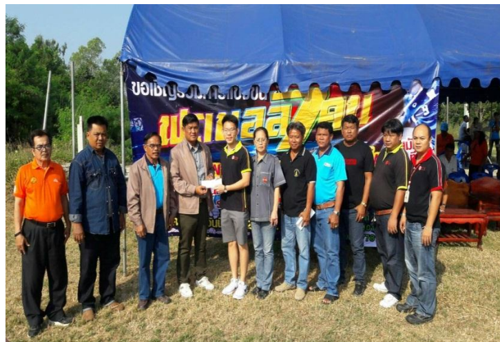
ภาพ: แข่งขันกีฬาต้านยาเสพติด (งานประเพณีลอยกระทงบ้านหนองโพ)