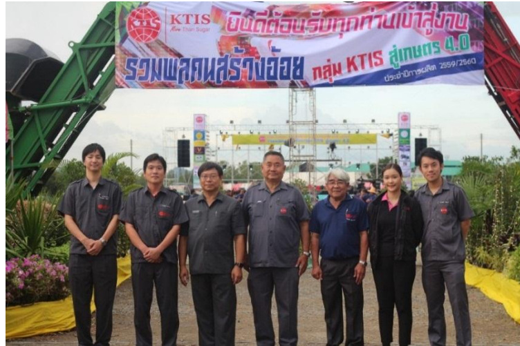
ภาพ: งานอ้อยสดประจำปี 2560