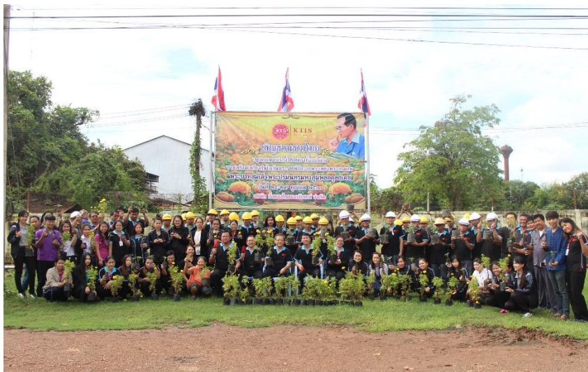
ภาพ: กิจกรรมโครงการจิตดี มีสุข เพิ่มคุณภาพงาน

ด้าน CSR กับการพัฒนาทรัพยากรมนุษย์อย่างมีประสิทธิภาพและเกิดประสิทธิผลนั้น กลุ่ม KTIS ได้ตระหนักถึงความสำคัญของบุคลากรขององค์กร จึงมีการจัดตั้งโครงการ “โครงการจิตดี มีสุข เพิ่มคุณภาพงาน” ผ่านกิจกรรมต่างๆ เพื่อสร้างทัศนคติเชิงบวก สนับสนุนให้พนักงานได้ใช้ความคิดสร้างสรรค์และมีส่วนร่วมในการจัดและร่วมกิจกรรมต่างๆ เช่น กิจกรรมการปรับปรุงภูมิทัศน์สวนหย่อมภายในโรงงานและบริเวณรอบโรงงาน เพื่อให้มีสิ่งแวดล้อมในการทำงานที่ดี รมรื่น และปลอดภัย, การอบรมภาวะผู้นำองค์กรในระดับต่างๆ, กิจกรรมกีฬาระหว่างโรงงานต่างๆ ของกลุ่ม KTIS, กิจกรรมปลูกต้นไม้เพิ่มพื้นที่สีเขียวให้กับชุมชนเพื่อเป็นการตอบแทนสังคมตามโครงการ KTIS ร่วมใจปลูกต้นไม้ประจำไตรมาส, กิจกรรมเปิดหีบปลอดภัย ไร้อัลกอฮอล์ มีสุข ลดอุบัติเหตุ, โครงการกลุ่ม KTIS จิตอาสา ตลอดจนกิจกรรมตามกาลและโอกาสต่างๆ เช่น การปลูกต้นดาวเรืองถวายเป็นพระราชกุศลและรำลึกในพระมหากรุณาธิคุณของพระบาทสมเด็จพระปรมินทรมหาภูมิพลอดุลยเดช บรมนาถบพิตร, กิจกรรมร่วมใจปลูกต้นไม้ให้แผ่นดิน เป็นต้น ซึ่งจะเห็นว่ากิจกรรมต่างๆ เหล่านี้สามารถส่งเสริมให้เกิดการพัฒนาทรัพยากรมนุษย์ได้เป็นอย่างดี บุคลากรทำงานอย่างมีความสุข สามารถทำงานได้เต็มศักยภาพ และส่งมอบผลงานที่มีคุณภาพด้วย