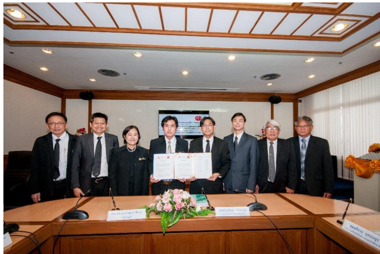
ภาพ: ลงนามในบันทึกข้อตกลงความร่วมมือ (MOU) ทางวิชาการ กับมหาวิทยาลัยเทคโนโลยีพระจอมเกล้าพระนครเหนือ

นอกจากความรับผิดชอบต่อสังคมในกระบวนการผลิต (CSR In-Process) แล้ว กลุ่ม KTIS ยังจัดโครงการเพื่อสังคมและสิ่งแวดล้อมที่นอกเหนือจากการดำเนินธุรกิจปกติ (CSR After-process) อย่างต่อเนื่อง เพื่อให้ความรู้และสร้างความสัมพันธ์อันดีระหว่างองค์กรกับชุมชนต่อ ยอดสู่การสร้างมูลค่าเพิ่มให้แก่ชุมชนและสังคมบนแนวคิด 'การเติบโตร่วมกันระหว่างอุตสาหกรรม สิ่งแวดล้อมและชุมชน' ซึ่งจะก่อให้เกิดประโยชน์แก่ส่วนรวมในท้ายที่สุด โดยในปี 2560 กลุ่ม KTIS ยังคงมุ่งเน้นไปที่ เด็กและเยาวชน สุขภาพ และสิ่งแวดล้อม ภายใต้แนวคิด "KTIS 3C+1" กล่าวคือ