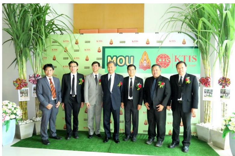
ภาพ: ลงนามในบันทึกข้อตกลงความร่วมมือ (MOU) การวิจัยและพัฒนา กับ มหาวิทยาลัยเกษตรศาสตร์

ภายใต้กระแสของโลกยุคโลกาภิวัตน์ที่หมุนไปอย่างไม่หยุดยั้ง การพัฒนาเทคโนโลยี หรือนวัตกรรม รวมถึงการเผยแพร่ความรู้ข่าวสารตามช่องทางต่างๆ ก็เป็นสิ่งทีกลุ่ม KTIS ตระหนักถึง และมุ่งมั่นที่จะพัฒนานวัตกรรมใหม่ๆ มาประยุกต์ ปรับใช้กับชุมชน สิ่งแวดล้อม เพื่อให้เกิดประโยชน์แก่ทุกฝ่าย ลดค่าใช้จ่ายรวมถึงลดการทำงานที่สูญเปล่า โดยมุ่งหวังให้ธุรกิจ ชุมชน และสังคมสามารถอยู่ร่วมกันได้อย่างมีความสุข ยั่งยืน มีศักยภาพ โดยในปี 2560 ที่ผ่านมากลุ่ม KTIS ได้ลงนามในบันทึกข้อตกลงความร่วมมือ (MOU) กับสถาบันการศึกษาหลายแห่ง อาทิ มหาวิทยาลัยขอนแก่น มหาวิทยาลัยเกษตรศาสตร์ มหาวิทยาลัยเทคโนโลยีพระจอมเกล้าพระนครเหนือ เป็นต้น ทั้งนี้การลงนามใน MOU กับแต่ละสถาบันการศึกษานั้นจะมีหัวข้อที่ร่วมกันศึกษาแตกต่างกันตามความเชี่ยวชาญ แต่จุดมุ่งหมายเพื่อพัฒนาและการต่อยอดภาคเกษตรเพื่อให้สอดคล้องกับนโยบายรัฐ Thailand Industry 4.0 ในการพัฒนานวัตกรรมและเทคโนโลยีต่างๆ มาเพิ่มประสิทธิภาพและประสิทธิผลของกระบวนการผลิตของกลุ่ม KTIS รวมทั้งเพิ่มผลผลิตในไร่อ้อยของชาวไร่อ้อยคู่สัญญาของกลุ่ม KTIS ด้วย