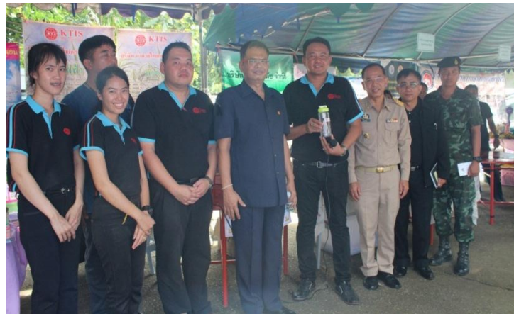
ภาพ: กิจกรรมบำบัดทุกข์ บำรุงสุข สร้างรอยยิ้มให้ประชาชน จ.อุตรดิตถ์