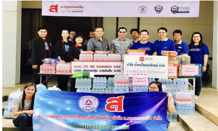
ภาพ: บริจาคสิ่งของช่วยเหลือผู้ประสบภัยน้ำท่วมในพื้นที่ภาคตะวันออกเฉียงเหนือ