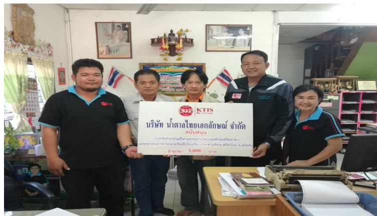
ภาพ: มอบเงินสนับสนุนกิจกรรมกีฬา และค่าอาหารกลางวันเด็กเล็ก