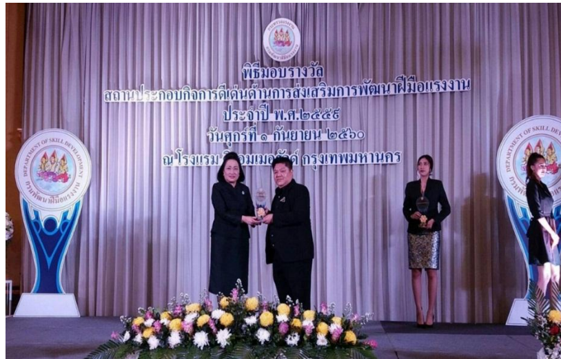
ภาพ: โรงงานน้ำตาลเกษตรไทยฯ ในกลุ่ม KTIS รับรางวัลสถานประกอบการดีเด่น ด้านการส่งเสริมการพัฒนาฝีมือแรงงาน