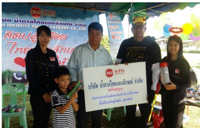
ภาพ: ร่วมกิจกรรมวันเด็กแห่งชาติ จ.สุโขทัย