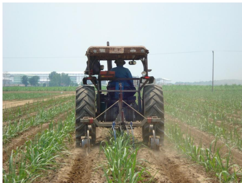
ภาพ: การสาธิตเครื่องจักรกลการเกษตรในไร่อ้อย