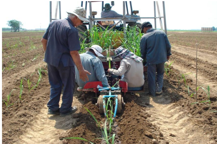
ภาพ: การสาธิตเครื่องปลูกอ้อยแบบ Shute Planter

ความรับผิดชอบต่อสังคมในกระบวนการผลิต (CSR In-Process) ของกลุ่ม KTIS เริ่มตั้งแต่ต้นน้ำ คือ การพัฒนาคุณภาพอ้อยซึ่งเป็นวัตถุดิบในกระบวนการผลิตให้มีคุณภาพดีป้อนเข้าสู่กระบวนการผลิต โดยกลุ่ม KTIS จะให้ความรู้เกี่ยวกับการทำไร่อ้อยให้ประสบความสำเร็จแก่ชาวไร่อ้อยคู่สัญญา ผ่านแผนการพัฒนาชาวไร่อ้อย และโครงการต่างๆ อาทิ โรงเรียนเกษตรกร โครงการหมู่บ้านอ้อยสด (หรือหมู่บ้านพื้นที่สีเขียวปลอดไฟไหม้) โครงการหมู่บ้านดินดีมากมีอินทรีย์วัตถุ โครงการอุทยานการเรียนรู้การทำอ้อยครบวงจรสู่ความยั่งยืน โดยโครงการต่างๆ จะให้ความรู้เรื่องการปลูกอ้อยโดยใช้วิธีการเกษตรอินทรีย์ที่หลีกเลี่ยงการใช้สารเคมี การใช้แตนเบียนควบคุมจำนวนหนอนศัตรูอ้อยซึ่งเป็นวิธีการทำการเกษตรที่ไม่ทำลายระบบนิเวศตามธรรมชาติ การให้ความรู้ด้านการเก็บเกี่ยว การรณรงค์ตัดอ้อยสดแทนการเผาอ้อย การดูแลบำรุงรักษาต่อเพื่อสามารถเก็บเกี่ยวได้หลายฤดูการผลิต การเฝ้าคลุกใบเพื่อเป็นอินทรีย์วัตถุให้กับดินซึ่งช่วยลดปริมาณการใช้ปุ๋ย เป็นต้น