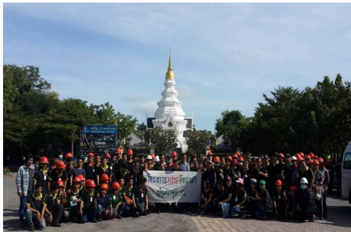
ภาพ: การปรับปรุงภูมิทัศน์รวมถึงทำความสะอาดวัด บริเวณชุมชนใกล้เคียง