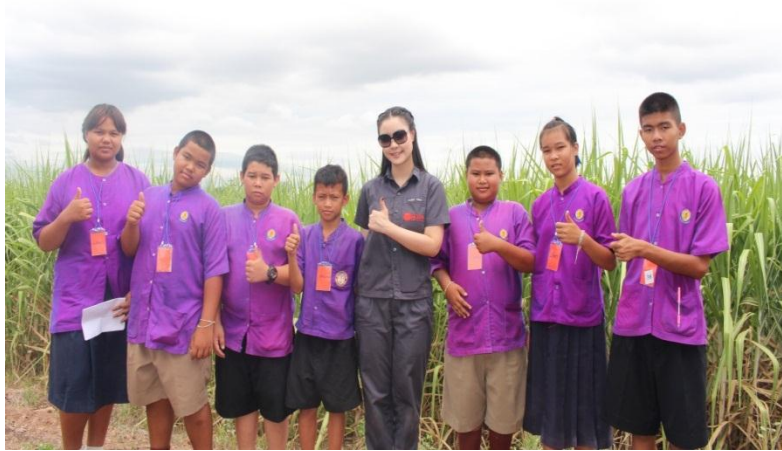
ภาพ: นักเรียนเข้าร่วมโครงการโรงเรียนเกษตรกรอ้อย