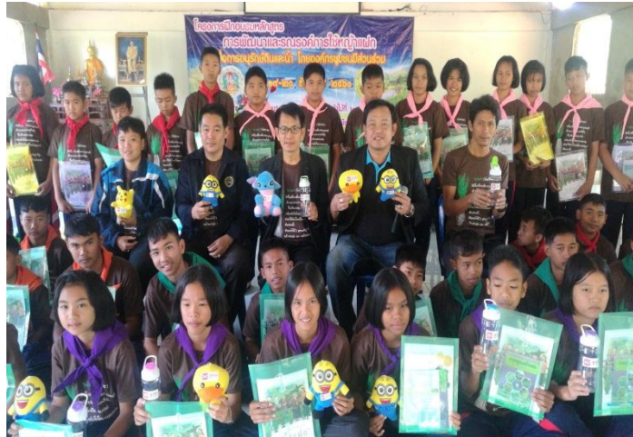
ภาพ: กิจกรรมโครงการรักษาสังคม รักษาชุมชน รักษาสิ่งแวดล้อม

(โครงการอบรมการพัฒนาและรณรงค์การใช้หญ้าแฝกเพื่ออนุรักษ์ดินและน้ำ ณ ศูนย์สาธิตการพัฒนาและรณรงค์การใช้หญ้าแฝกด้านป่าไม้ที่ 2 จ.สุโขทัย)