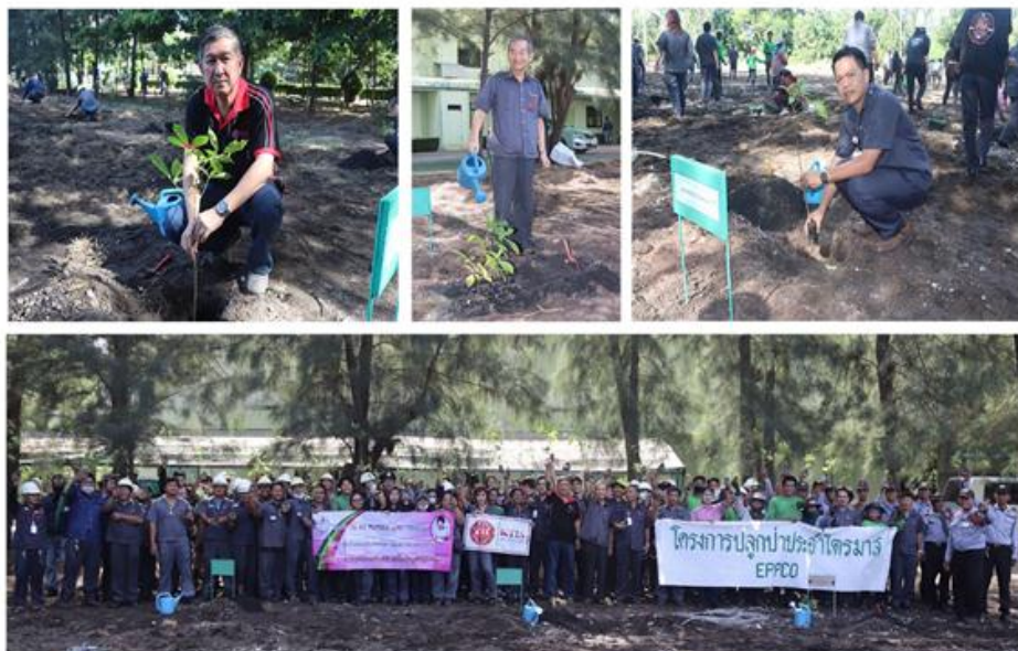
ภาพ: โครงการปลูกป่าประจำไตรมาส