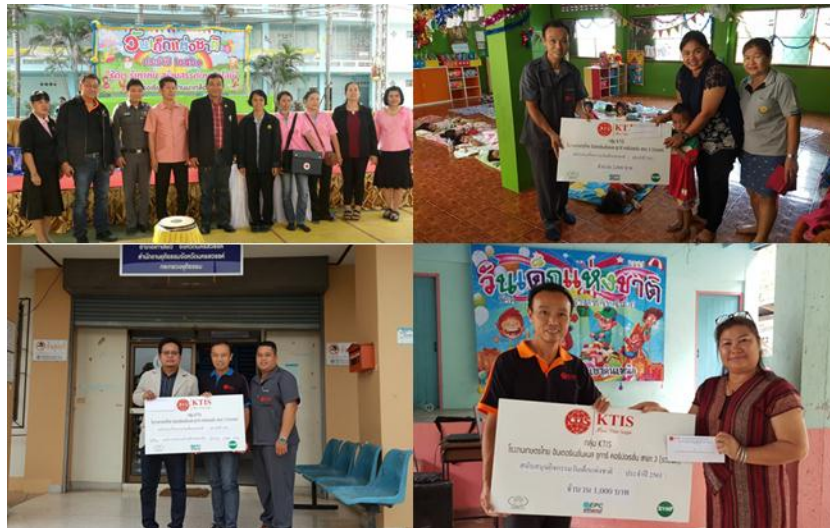
ภาพ: ร่วมกิจกรรมวันเด็กแห่งชาติ จ.นครสวรรค์