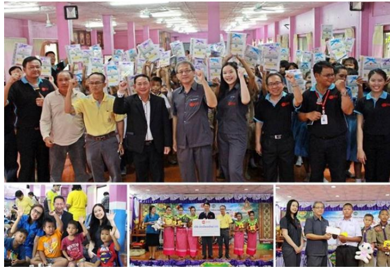
ภาพ: กิจกรรมโครงการ "KTIS หนึ่งอ้อม ยิ้มสุขใจ กับไทยเอกלקษณ์"