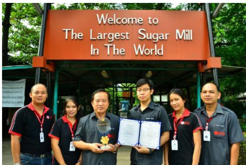
ภาพ: กลุ่ม KTIS รับรางวัลสถานประกอบการดีเด่น ด้านการส่งเสริมการพัฒนาฝีมือแรงงาน ประจำปี 2561