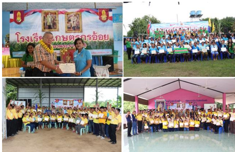
ภาพ: โรงเรียนเกษตรกรอ้อย

ด้วยนโยบายของกลุ่ม KTIS ที่มุ่งเน้นการพัฒนาอย่างมั่นคง มั่งคั่ง และยั่งยืนผ่านการให้ความรู้ เสริมสร้างองค์ความรู้แก่ชาวไร่อ้อย จึงก่อเกิดโรงเรียนเกษตรกรขึ้น ซึ่งเป็นโครงการที่กลุ่ม KTIS ดำเนินการมาอย่างต่อเนื่อง เพราะเทคนิคหรือวิธีการดูแลอ้อยนั้นมีการพัฒนาตลอดเวลา โดยโรงเรียนเกษตรกรนั้นจะมีการแลกเปลี่ยนความรู้ในด้านของการเลือกพันธุ์อ้อย การเตรียมดิน การสาธิตใช้เครื่องมือเครื่องจักร การบำรุงใส่ปุ๋ย ตามช่วงระยะต่างๆ ของอ้อย ผ่านทีมงานฝ่ายไร่อ้อยของกลุ่ม KTIS ซึ่งสถานที่จัดนั้นจะเป็นไร่อ้อยสาธิต เพื่อให้ชาวไร่อ้อยทดลองและลงมือปฏิบัติจริง พร้อมเปิดโอกาสให้ถามและแลกเปลี่ยนความรู้ระหว่างชาวไร่อ้อย