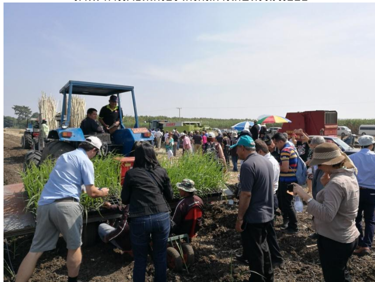
ภาพ: การสาธิตเครื่องจักรกลการเกษตร และพันธุ์อ้อยในอุทยานการเรียนรู้การทำอ้อยสมัยใหม่ครบวงจรสู่ความยั่งยืน

นอกจากนี้ กลุ่ม KTIS ยังได้นำความรู้ ประสบการณ์ และเทคนิคที่ทันสมัยจากประเทศออสเตรเลียมาพัฒนาขึ้นเป็นหลักการการทำอ้อยของกลุ่ม KTIS ที่เรียกว่า "5 Step Plan + 1" รวมถึงนำความรู้ ความเชี่ยวชาญด้านเครื่องมือเครื่องจักรมาต่อยอด พัฒนาเครื่องจักรกลในไร่อ้อยให้เหมาะสมกับสภาพภูมิประเทศ สภาพภูมิอากาศในประเทศไทย อาทิ เครื่องปลูกอ้อยแบบ Sonic เครื่องปลูกอ้อยแบบ Shute Planter เครื่องจักรพรวนดินใส่ปุ๋ย CRB MPI เครื่องตัดอ้อย เป็นต้น และสนับสนุนให้ชาวไร่อ้อยคู่สัญญานำมาใช้ในการทำไร่อ้อยให้ประสบความสำเร็จ ให้มีต้นทุนที่ต่ำลง เพิ่มผลผลิตต้นต่อไร่ อีกทั้งยังช่วยแก้ปัญหาการขาดแคลนแรงงานในไร่อ้อยด้วย