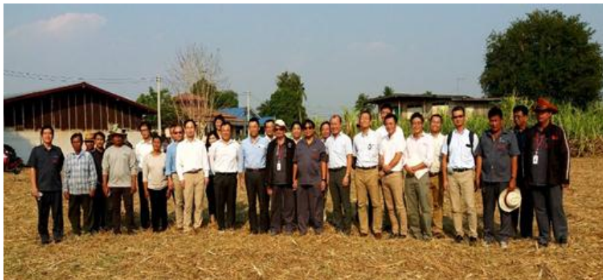
ภาพ : Sumitomo เยี่ยมชมอุทยานการเรียนรู้

กลุ่ม KTIS มุ่งมั่นที่จะพัฒนาการทำไร่อ้อยของเกษตรกรชาวไร่อ้อยให้ประสบความสำเร็จ อย่างมั่นคง และยั่งยืน จึงจัดตั้งโครงการอุทยานการเรียนรู้การทำอ้อยอย่างยั่งยืนขึ้น เพื่อให้เกษตรกรชาวไร่อ้อยมีความรู้ในการทำอ้อยที่ถูกต้องตามหลักการการทำอ้อยของกลุ่ม KTIS ที่เรียกว่า “5 Step Plan + 1” ช่วยเพิ่มผลผลิตต้นต่อไร่ ลดต้นทุน มีการนำเครื่องมือ เครื่องจักรกลการเกษตรสมัยใหม่มาใช้ในการทำไร่อ้อยได้อย่างเหมาะสม ทำให้เกษตรกรชาวไร่อ้อยสามารถยืดอายุชีพการทำอ้อยได้อย่างยั่งยืน และสร้างทายาทผู้สืบทอดในการทำไร่อ้อยของชาวไร่ต่อไป โดยกลุ่ม KTIS จะแนะนำ ให้ความรู้ตั้งแต่ขั้นตอนการวางแผน การทำความเข้าใจ การจัดสัดส่วนอ้อย การเตรียมดิน การปลูก การบำรุง การนำอ้อยเข้าหีบตลอดจนการเก็บใบอ้อยให้สอดคล้องกัน รวมทั้งการจัดการในแต่ละขั้นตอนของการทำอ้อยจะต้องอาศัยปัจจัย กรรมวิธี และอุปกรณ์ เครื่องมือ เครื่องจักรกลการเกษตรต่างๆ เข้ามาเกี่ยวข้องมากขึ้น จึงต้องควบคุมจังหวะเวลา คุณภาพ มาตรฐาน ให้มีความละเอียดขึ้น