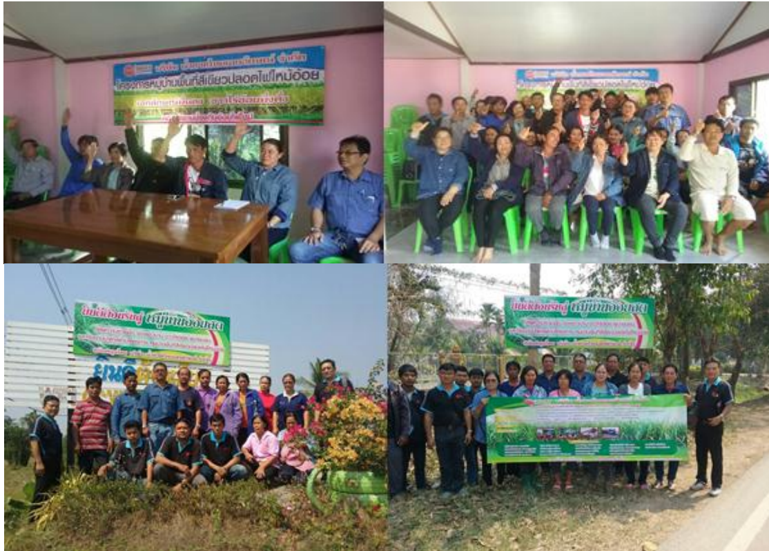
ภาพ: โครงการหมู่บ้านอ้อยสดของกลุ่ม KTIS

กลุ่ม KTIS เชื่อว่าความยั่งยืนอย่างแท้จริงจะเกิดขึ้นได้ต้องขับเคลื่อนจากทุกฝ่าย ทั้งเกษตรกรชาวไร่อ้อย โรงงาน และภาครัฐ เราจึงได้ริเริ่มโครงการหมู่บ้านอ้อยสด หรือหมู่บ้านพื้นที่สีเขียวปลอดไฟไหม้ เพื่อร่วมกันผลักดันให้เกษตรกรชาวไร่อ้อยในหมู่บ้านตัดอ้อยสดให้ได้ไม่ต่ำกว่า 80% ของอ้อยที่เข้าร่วมโครงการ การตัดอ้อยสดนั้นนอกจากจะเป็นการอนุรักษ์ธรรมชาติ ลดมลพิษที่ออกสู่อากาศ รักษาสิ่งแวดล้อม รักษาหน้าดินสำหรับปีการผลิตถัดไปแล้ว ยังช่วยเพิ่มผลผลิตต่อตันอ้อยให้สูงขึ้นด้วย โครงการหมู่บ้านอ้อยสด หรือหมู่บ้านพื้นที่สีเขียวปลอดไฟไหม้นี้ยังสนับสนุนให้เกษตรกรชาวไร่อ้อยร่วมกับชุมชน และหน่วยงานในท้องถิ่น ร่วมป้องกันอ้อยไฟไหม้ในไร่อ้อยด้วย ซึ่งโครงการนี้ได้รับผลสำเร็จได้เป็นอย่างดีและต่อเนื่อง ปัจจุบันมีหมู่บ้านที่เข้าร่วมโครงการหมู่บ้านอ้อยสดทั้งสิ้น 25 หมู่บ้าน