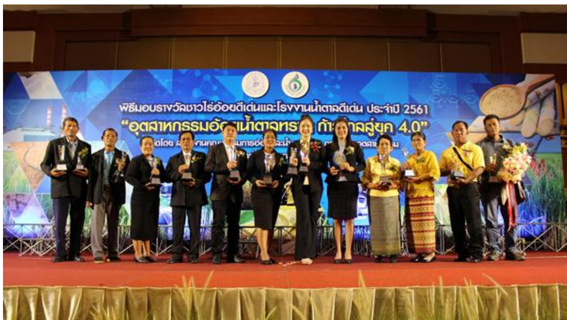
ภาพ: โรงงานน้ำตาลไทยเอกสิทธิ์ ในกลุ่ม KTIS รับรางวัลโรงงานน้ำตาลระดับดี และรางวัล "อ้อยรักษโลก"