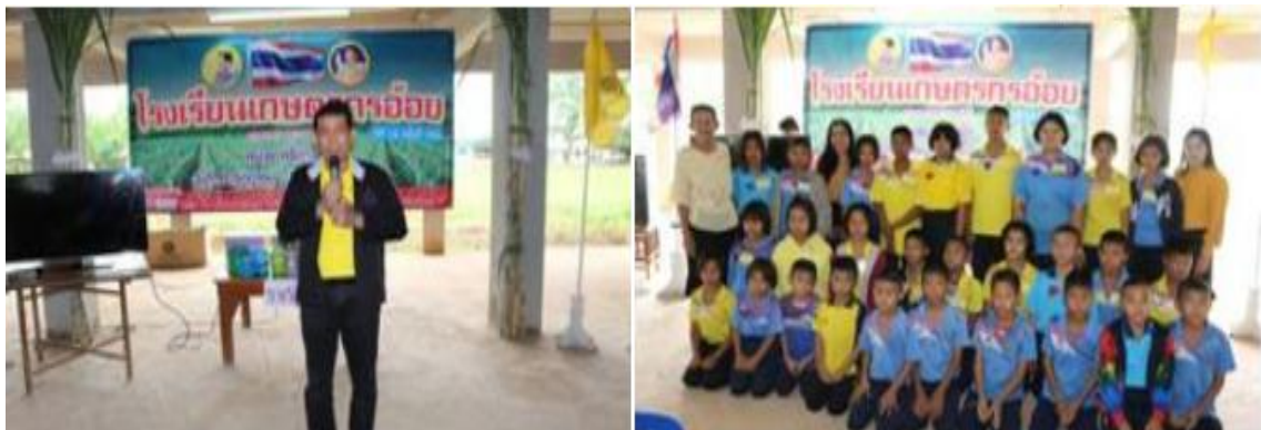
ภาพ: โรงเรียนเกษตรกรอ้อย

ด้วยนโยบายของกลุ่ม KTIS ที่มุ่งเน้นการพัฒนาอย่างมั่นคง มั่งคั่ง และยั่งยืนผ่านการให้ความรู้ เสริมสร้างองค์ความรู้แก่ชาวไร่อ้อย จึงก่อเกิดโรงเรียนเกษตรกรขึ้น ซึ่งเป็นโครงการที่กลุ่ม KTIS ดำเนินการมาอย่างต่อเนื่อง เพราะเทคนิคหรือวิธีการดูแลอ้อยนั้นมีการพัฒนาตลอดเวลา โดยโรงเรียนเกษตรกรนั้นจะมีการแลกเปลี่ยนความรู้ในด้านการเลือกพันธุ์อ้อย การเตรียมดิน การสาธิตใช้เครื่องมือเครื่องจักร การบำรุงใส่ปุ๋ย ตามช่วงระยะต่างๆ ของอ้อย ผ่านทีมงานฝ่ายไร่ของกลุ่ม KTIS ซึ่งสถานที่จัดนั้นจะเป็นไร่อ้อยสาธิต เพื่อให้ชาวไร่อ้อยทดลองและลงมือปฏิบัติจริง พร้อมเปิดโอกาสให้ถามและแลกเปลี่ยนความรู้ระหว่างชาวไร่อ้อย