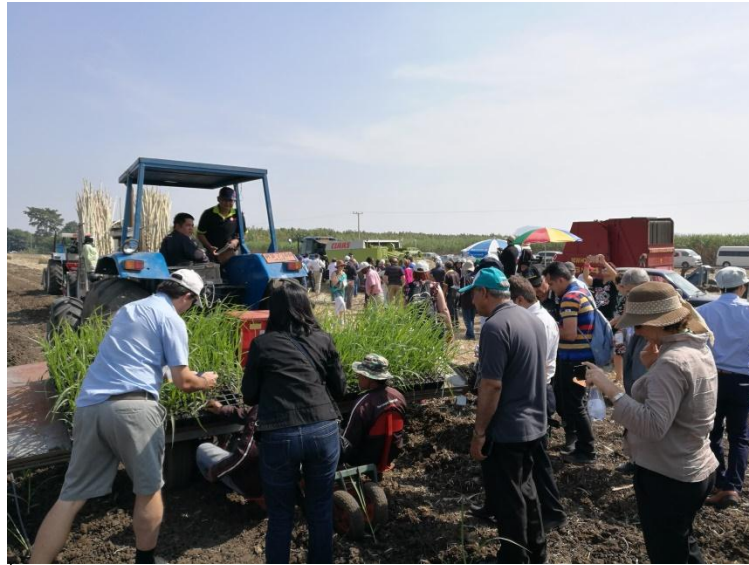
ภาพ: การสาธิตเครื่องจักรกลการเกษตร และพันธุ์อ้อยในอุทยานการเรียนรู้การทำอ้อยสมัยใหม่ครบวงจรสู่ความยั่งยืน

กลุ่ม KTIS ได้นำความรู้ ประสบการณ์ และเทคนิคที่ทันสมัยจากประเทศออสเตรเลียมาพัฒนาขึ้นเป็นหลักการการทำอ้อยของกลุ่ม KTIS ที่เรียกว่า "5 Step Plan + 2" โดยนำความรู้ ความเชี่ยวชาญด้านเครื่องมือเครื่องจักรมาต่อยอด พัฒนาเครื่องจักรกลในไร่อ้อยให้เหมาะสมกับสภาพภูมิประเทศ สภาพภูมิอากาศในประเทศไทย อาทิ เครื่องปลูกอ้อยแบบ Sonic เครื่องปลูกอ้อยแบบ Shute Planter เครื่องจักรพรวนดินไถปุ๋ย CRB MPI เครื่องตัดอ้อย เป็นต้น และสนับสนุนให้ชาวไร่อ้อยคู่สัญญานำมาใช้ในการทำไร่อ้อยให้ประสบความสำเร็จ ให้มีต้นทุนที่ต่ำลง เพิ่มผลผลิตต้นต่อไร่ และช่วยแก้ปัญหาการขาดแคลนแรงงานในไร่อ้อยด้วย