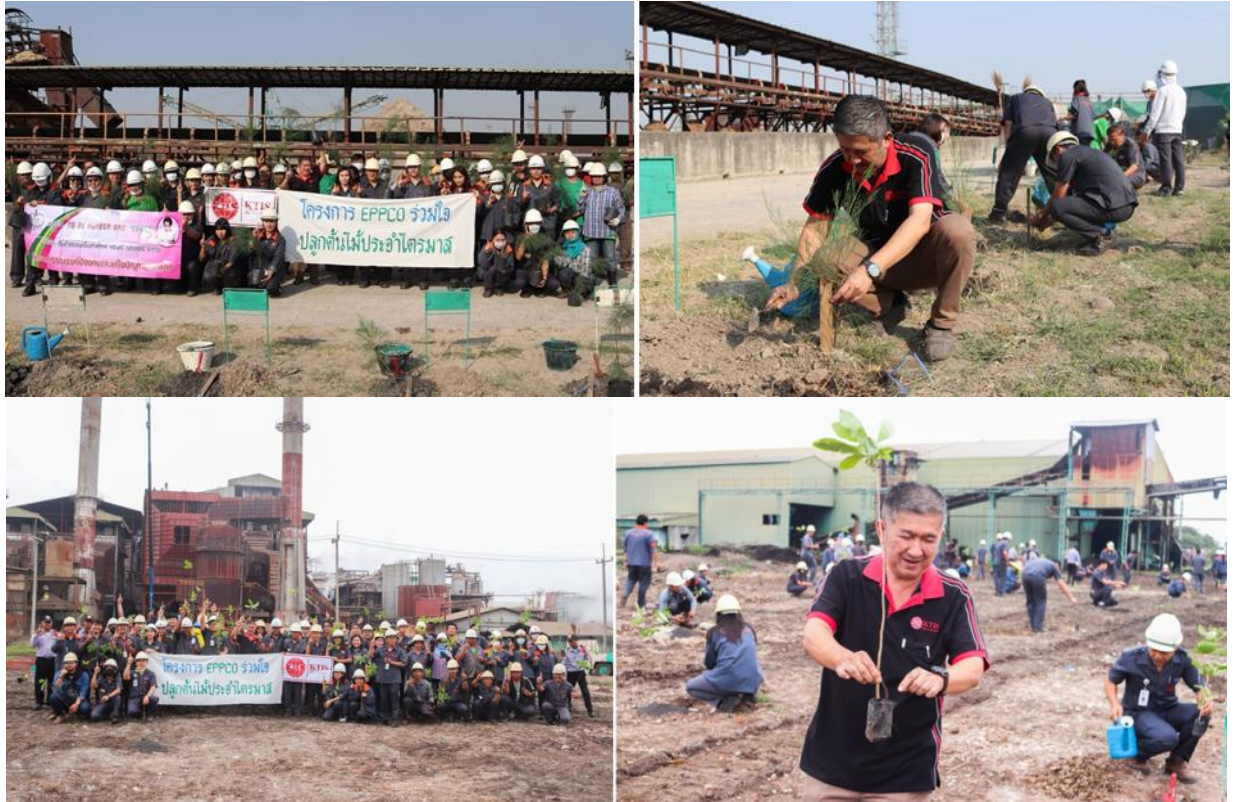
ภาพ: โครงการปลูกป่าประจำไตรมาส