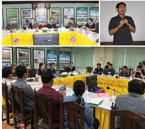
ภาพ : การอบรมให้ความรู้การทำไร่อ้อยสมัยใหม่ของโครงการปั้นทายาทชาวไร่อ้อยสู่เจ้าแก้วน้อย

กลุ่ม KTIS เปิดโครงการสร้างอาชีพสืบทอดอาชีพการทำไร่อ้อยจากรุ่นสู่รุ่น “ปั้นทายาท...สู่...เจ้าแก้วน้อย” รุ่นที่ 1 ณ โรงงานน้ำตาลไทยเอกลักษณ์ ต.คุ้งตะเภา อ.เมือง จ.อุตรดิตถ์ โครงการนี้เป็นการสืบทอดสานต่ออาชีพการทำไร่อ้อยของครอบครัว โดยจะเป็นการปลูกฝังแนวความคิดการทำไร่อ้อยสมัยใหม่ตามแนวเกษตร 4.0 การเพิ่มผลผลิตและลดต้นทุนการทำไร่อ้อย โดยผู้เชี่ยวชาญของกลุ่ม KTIS จะให้ความรู้เริ่มตั้งแต่หลักสูตรพื้นฐานทั้งทางทฤษฎีและการปฏิบัติ ตลอดจนถึงการนำเทคโนโลยีการเพาะปลูกอ้อยเพื่อเพิ่มผลผลิตและลดต้นทุนการทำไร่อ้อย พัฒนาทักษะด้านการบริหารจัดการ รวมถึงการแก้ไขปัญหาและการให้คำปรึกษาต่างๆ เพื่อให้มีอาชีพการทำไร่อ้อยที่มั่นคง มั่งคั่ง ยั่งยืน