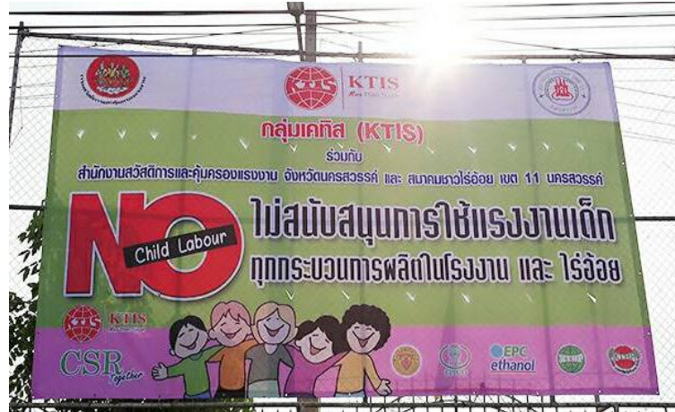
ภาพ: กลุ่ม KTIS ไม่สนับสนุนการใช้แรงงานเด็กในทุกกระบวนการผลิตในโรงงานและในไร่อ้อย

ในด้านของการอยู่ร่วมกับชุมชน (Community Relations) กลุ่ม KTIS ยังคงมีความสัมพันธ์อันดีกับชุมชนบริเวณใกล้เคียง มีการพบปะ ผู้นำชุมชนอย่างสม่ำเสมอ นอกจากนี้ ยังมีการจัดกิจกรรมต่างๆ เพื่อกระชับความสัมพันธ์ให้ดียิ่งขึ้น เช่น การจัดแข่งกีฬาท้องถิ่น การสนับสนุนการจัดแข่งขันกีฬาของโรงเรียนรอบโรงงาน การปรับภูมิทัศน์บริเวณชุมชน การเข้าร่วมกิจกรรมต่างๆ กับทางชุมชน เป็นต้น