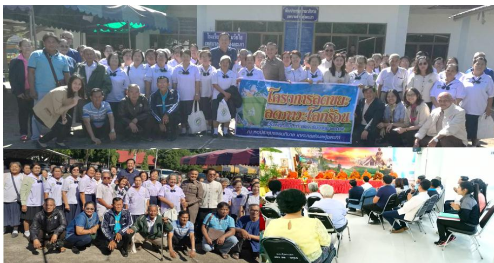
ภาพ: ร่วมกิจกรรมและสนับสนุนโครงการลดขยะ ลดภาวะโลกร้อน