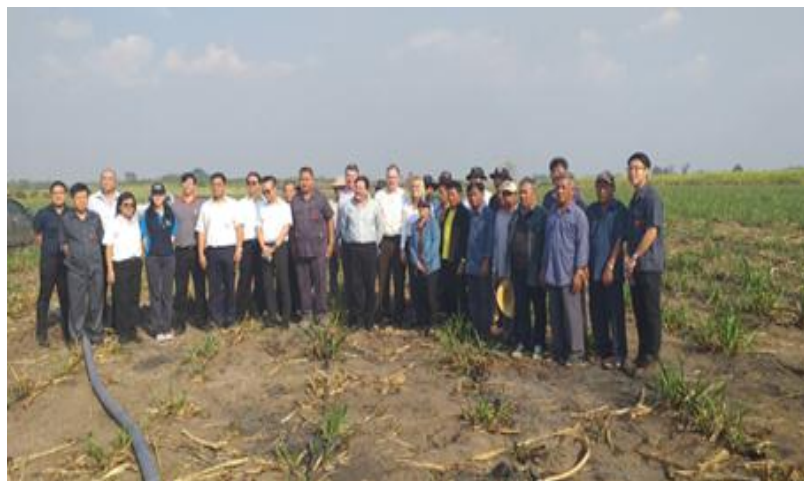
ภาพ : กลุ่ม KTIS และสมาคมชาวไร่อ้อยเขต 11 ให้การต้อนรับ NatureWorks, PTTGC และ GGC เยี่ยมชมอุทยานการเรียนรู้

กลุ่ม KTIS มุ่งมั่นที่จะพัฒนาการทำไร่อ้อยของเกษตรกรชาวไร่อ้อยให้ประสบความสำเร็จ อย่างมั่นคง และยั่งยืน จึงจัดตั้งโครงการอุทยานการเรียนรู้การทำอ้อยอย่างยั่งยืนขึ้น เพื่อให้เกษตรกรชาวไร่อ้อยมีความรู้ในการทำอ้อยที่ถูกต้องตามหลักการการทำอ้อยของกลุ่ม KTIS ที่เรียกว่า “5 Step Plan + 2” ช่วยเพิ่มผลผลิตต้นต่อไร่ ลดต้นทุน มีการนำเครื่องมือ เครื่องจักรกลการเกษตรสมัยใหม่มาใช้ในการทำไร่อ้อยได้อย่างเหมาะสม ทำให้เกษตรกรชาวไร่อ้อยสามารถยืดอายุการทำอ้อยได้อย่างยั่งยืน และสร้างทายาทผู้สืบทอดในการทำไร่อ้อยของชาวไร่ต่อไป โดยกลุ่ม KTIS จะแนะนำ ให้ความรู้ตั้งแต่ขบวนการวางแผน การทำความเข้าใจ การจัดสัดส่วนอ้อย การเตรียมดิน การปลูก การบำรุง การนำอ้อยเข้าหีบตลอดจนการเก็บใบอ้อยให้สอดคล้องกัน รวมทั้งการจัดการในแต่ละขั้นตอนของการทำอ้อยจะต้องอาศัยปัจจัย กรรมวิธี และอุปกรณ์ เครื่องมือ เครื่องจักรกลการเกษตรต่างๆ เข้ามาเกี่ยวข้องมากขึ้น จึงต้องควบคุมจังหวะเวลา คุณภาพ มาตรฐาน ให้มีความละเอียดขึ้น