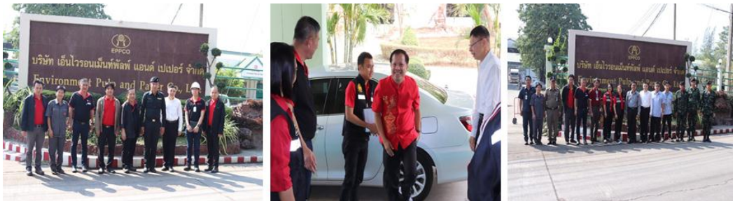
ภาพ: ให้การต้อนรับรองผู้ว่าราชการจังหวัดนครสวรรค์ และหน่วยงานราชการในการติดตามเรื่องฝุ่น และมาตรการป้องกันแก้ไขของโรงงานอุตสาหกรรม จ.นครสวรรค์