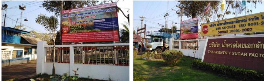
ภาพ: ป้ายไวนิลรณรงค์การหยุดเผาอ้อย ลดโลกร้อน ลดหมอกควัน รักษาสิ่งแวดล้อม กำจัดฝุ่น PM 2.5