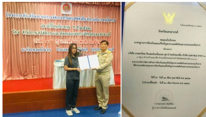
ภาพ : KTIS 3 รับรางวัลมาตรฐานการป้องกันและแก้ไขปัญหายาเสพติดในสถานประกอบการ จ.นครสวรรค์