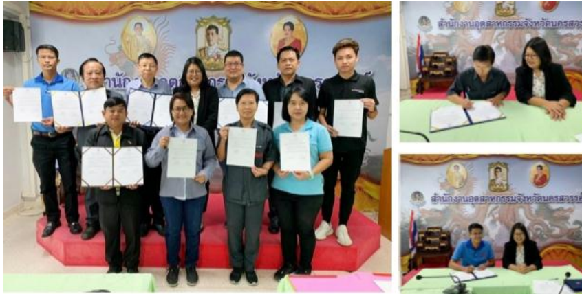
ภาพ : กลุ่ม KTIS ลงนาม MOU การเฝ้าระวังและป้องกันปัญหายาเสพติดในสถานประกอบการโรงงานกับกระทรวงอุตสาหกรรม