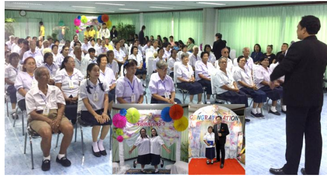
ภาพ: ร่วมกิจกรรมและสนับสนุนการจัดงานผู้สูงอายุ