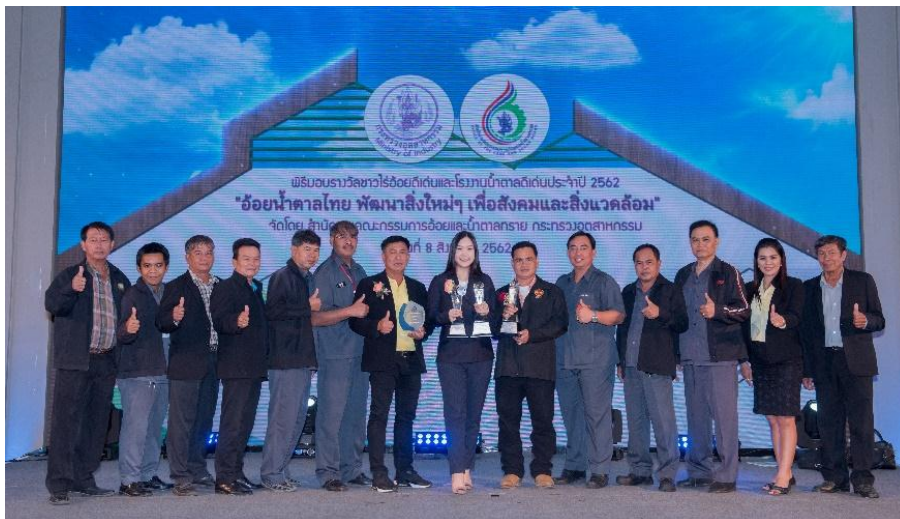
ภาพ: โรงงานน้ำตาลไทยเอกลักษณ์ ในกลุ่ม KTIS รับรางวัลโรงงานน้ำตาลระดับดี และรางวัล “อ้อยรักษ์โลก”