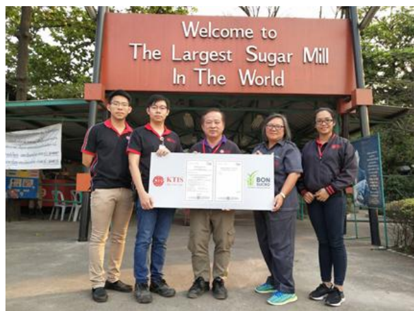
ภาพ: กลุ่ม KTIS กับรางวัลมาตรฐานสากลบอนซูโคร (Bonsucro)

ด้านนวัตกรรมและการพัฒนากระบวนการทำงานต่างๆ กลุ่ม KTIS ยังคงมุ่งมั่นพัฒนานวัตกรรมและปรับปรุงกระบวนการทำงานที่สร้างคุณค่าเพิ่มต่อสังคม และตอบสนองความต้องการของลูกค้าอย่างต่อเนื่อง อาทิ น้ำเชื่อม และน้ำตาลทรายขาวบริสุทธิ์พิเศษมาตรฐานญี่ปุ่น เพื่อตอบสนองความต้องการของลูกค้าอุตสาหกรรมอาหารและเครื่องดื่ม รวมทั้งลูกค้าที่ต้องการน้ำตาลคุณภาพพรีเมียมด้วย