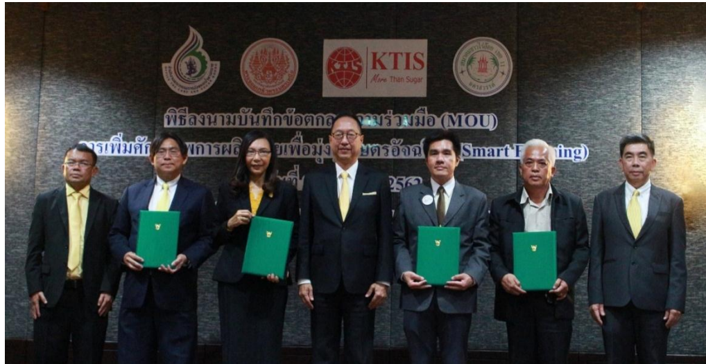
ภาพ: กลุ่ม KTIS ลงนาม MOU กับ สอน., มจพ. และสมาคมชาวไร่อ้อยเขต 11 นครสวรรค์ พัฒนาชาวไร่อ้อยสู่ Smart Farming

นอกจากนี้ ในปี 2562 กลุ่ม KTIS ได้ลงนามความร่วมมือทางวิชาการกับ 3 หน่วยงาน คือ สำนักงานคณะกรรมการอ้อยและน้ำตาลทราย (สอน.), มหาวิทยาลัยเทคโนโลยีพระจอมเกล้าพระนครเหนือ (มจพ.) และสมาคมชาวไร่อ้อยเขต 11 นครสวรรค์ ภายใต้โครงการ “การเพิ่มศักยภาพการผลิตอ้อยมุ่งสู่ Smart Farming” เพื่อส่งเสริมและผลักดันให้ชาวไร่อ้อยใช้เทคโนโลยีให้เป็นประโยชน์สำหรับการเพาะปลูกครบวงจร ช่วยลดต้นทุน เพิ่มศักยภาพการผลิต เพื่อให้ได้อ้อยพันธุ์ดีมีคุณภาพสอดคล้องกับเจตนารมณ์ของกลุ่ม KTIS ที่ต้องการสร้างความมั่งคั่งให้ชาวไร่อ้อยอย่างยั่งยืน