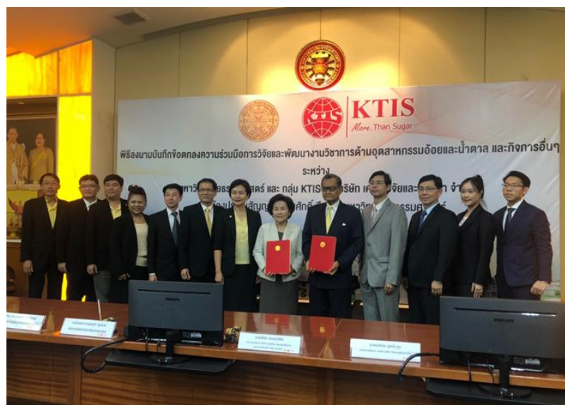
ภาพ: การลงนาม MOU ระหว่างกลุ่ม KTIS กับ มหาวิทยาลัยธรรมศาสตร์

ในปี 2558 กลุ่ม KTIS ได้จัดตั้งบริษัทย่อย คือ บริษัท เคทีเอส วิจัยและพัฒนา จำกัด เพื่อดำเนินธุรกิจวิจัยและพัฒนา ซึ่งได้ลงนามความร่วมมือด้านงานวิจัยกับหน่วยงานภาครัฐและเอกชน ที่มีความเป็นเลิศทางการวิจัย รวม 10 สถาบัน ได้แก่ มหาวิทยาลัยเทคโนโลยีพระจอมเกล้าธนบุรี, มหาวิทยาลัยเชียงใหม่, มหาวิทยาลัยนเรศวร, สถาบันวิจัยวิทยาศาสตร์และเทคโนโลยีแห่งประเทศไทย (วว.), มหาวิทยาลัยขอนแก่น, มหาวิทยาลัยเกษตรศาสตร์, มหาวิทยาลัยเทคโนโลยีพระจอมเกล้าพระนครเหนือ, บริษัท โกลบอลกรีนเคมิคอล จำกัด (มหาชน), บริษัท ปตท. จำกัด (มหาชน) และ มหาวิทยาลัยธรรมศาสตร์ ทั้งนี้ ในปี 2562 ได้ดำเนินโครงการวิจัยและพัฒนา ทั้งสิ้น 6 โครงการ