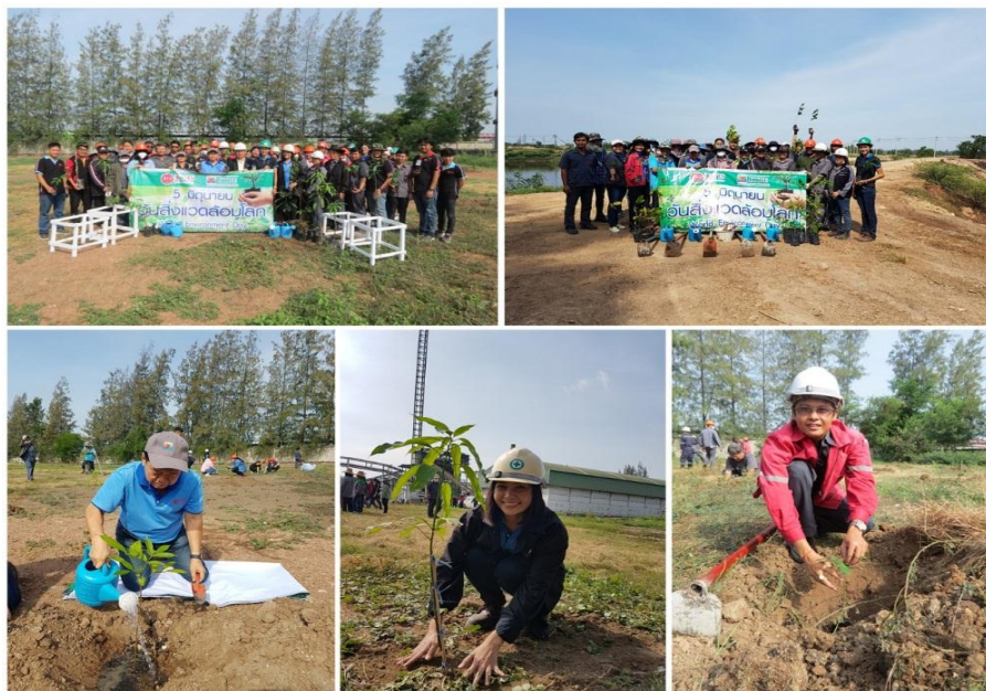
ภาพ: กลุ่ม KTIS และ GKBI ร่วมกันปลูกต้นไม้ในวันสิ่งแวดล้อมโลก