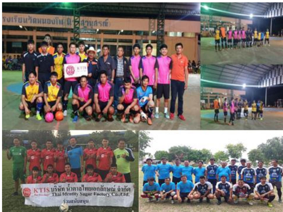
ภาพ : กลุ่ม KTIS จัดกิจกรรมแข่งขันกีฬาต้านภัยยาเสพติด