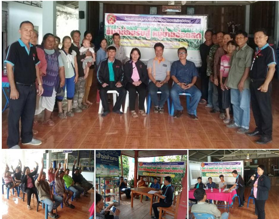
ภาพ: โครงการหมู่บ้านอ้อยสดของกลุ่ม KTIS