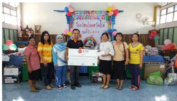
ภาพ: ร่วมกิจกรรมและสนับสนุนการจัดงานวันเด็กแห่งชาติ