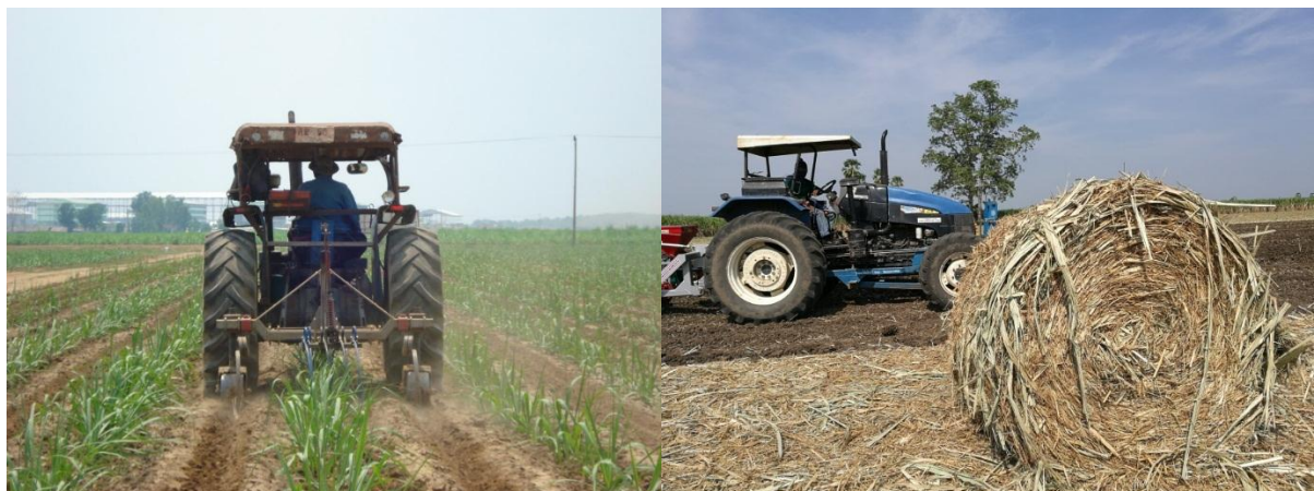
ภาพ: เครื่องจักรกลการเกษตรในไร่อ้อย