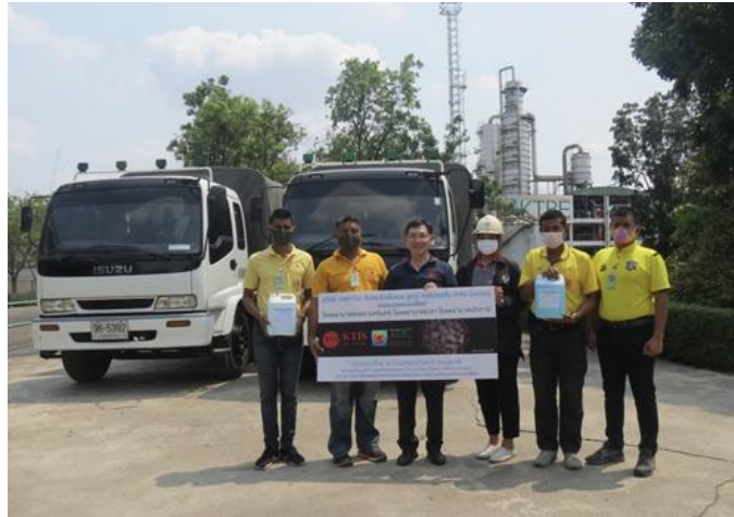
ภาพ: กลุ่ม KTIS ส่งมอบแอลกอฮอล์ให้โรงพยาบาล 3 จังหวัดภาคใต้