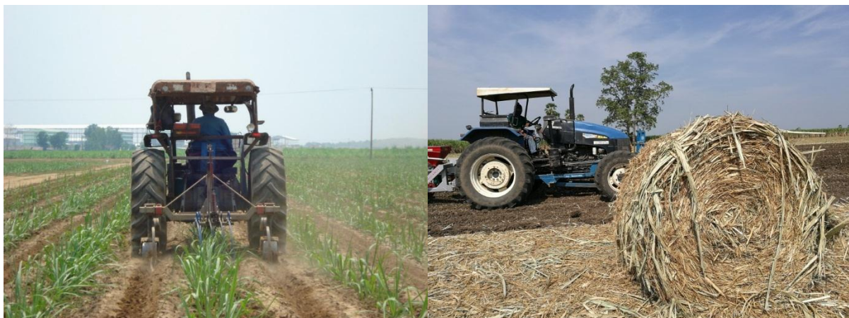
ภาพ: เครื่องจักรกลการเกษตรในไร่อ้อย