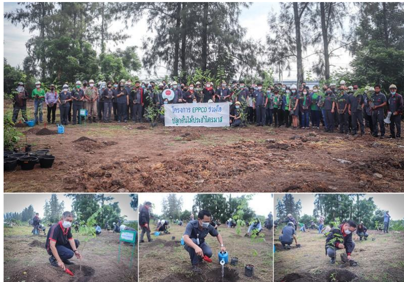
ภาพ: โครงการปลูกป่าประจำไตรมาส