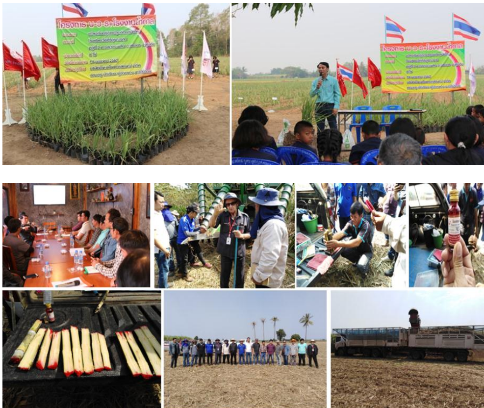
ภาพ : โครงการ บ ว ร + โรงงานน้ำตาล จ.อุดรดิต

อย่างต่อเนื่องมาตั้งแต่ 2556 มีวัตถุประสงค์เพื่อส่งเสริมและเป็นแหล่งเรียนรู้ให้กับนักเรียน ชุมชน และประชาชนทั่วไป ได้ศึกษา และเรียนรู้การปลูกอ้อย โดยได้รับการไว้วางใจจากวัดและโรงเรียนเป็นศูนย์การเรียนรู้โดยผู้นำชุมชนและชาวบ้าน รวมถึงชาวไร่อ้อย คู่สัญญาได้ร่วมกับโรงงานน้ำตาลสนับสนุนพันธุ์อ้อย ปุ๋ยยา และเครื่องจักรกลการเกษตร โดยคณาจารย์และนักเรียนเป็นผู้ดูแลแปลงอ้อย ซึ่งรายได้จากการปลูกอ้อยจะนำมาสนับสนุนเป็นค่าใช้จ่ายให้กับวัดในการบูรณะพระพุทธรูปศาสนา รวมถึงเป็นทุนการศึกษาให้กับนักเรียน โดยระหว่างการดำเนินการนั้นจะมีบุคลากรฝ่ายไร่ของกลุ่ม KTIS ให้คำแนะนำและดูแลอย่างใกล้ชิด