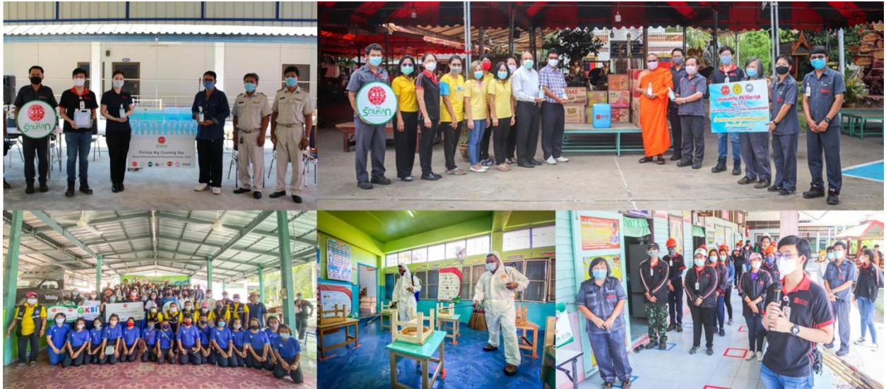
ภาพ: กลุ่ม KTIS ได้จัดกิจกรรม Big Cleaning Day : โครงการพัฒนาโรงเรียนและวัด

นอกจากนี้ ช่วงการระบาดรุนแรงของไวรัสโควิด-19 เมื่อต้นปี 2563 นั้น การใช้แอลกอฮอล์มีความต้องการเพิ่มขึ้นอย่างมากจนเกิดปัญหาการขาดแคลนแอลกอฮอล์ และมีการขายแพงเกินราคา กลุ่ม KTIS มีเจตนารมณ์ชัดเจนที่ต้องการจะช่วยเหลือสังคม โดยเป็นบริษัทแรกๆ ที่จำหน่ายแอลกอฮอล์ให้พี่น้องประชาชนในราคาถูก โดยจำหน่ายแอลกอฮอล์ 95% ที่ผลิตจากโรงงานของ บริษัท เคทีเอส ไบโอเอทานอล จำกัด (KTBE) ซึ่งเป็นบริษัทในกลุ่ม KTIS ในราคาหน้าโรงงานที่ลดละ 35 บาท ซึ่งคุณภาพของแอลกอฮอล์ที่ผลิตได้จากโรงงานของกลุ่ม KTIS นี้ได้มาตรฐานในระดับสากล สามารถนำไปใช้ในผลิตภัณฑ์ฆ่าเชื้อโรค รวมถึงผลิตภัณฑ์ทำความสะอาด และผลิตภัณฑ์อื่นๆ ได้เป็นอย่างดี