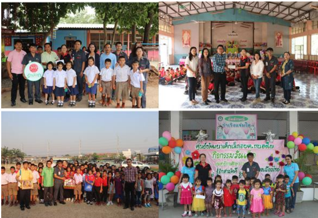
ภาพ: ร่วมกิจกรรมและสนับสนุนการจัดงานวันเด็กแห่งชาติ