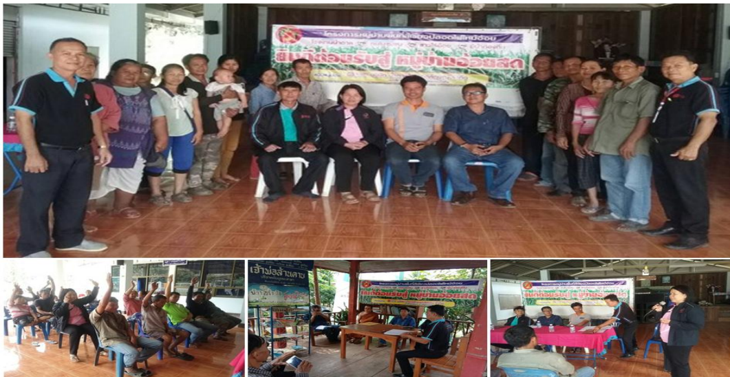
ภาพ: โครงการหมู่บ้านอ้อยสดของกลุ่ม KTIS

กลุ่ม KTIS เชื่อว่าความยั่งยืนอย่างแท้จริงจะเกิดขึ้นได้ต้องขับเคลื่อนจากทุกๆ ฝ่าย ทั้งเกษตรกรชาวไร่ โรงงาน และภาครัฐ เราจึงได้ริเริ่มโครงการหมู่บ้านอ้อยสด หรือหมู่บ้านพื้นที่สีเขียวปลอดไฟไหม้ เพื่อร่วมกันผลักดันให้เกษตรกรชาวไร่อ้อยในหมู่บ้านตัดอ้อยสดให้ได้ไม่ต่ำกว่า 80% ของอ้อยที่เข้าร่วมโครงการ การตัดอ้อยสดนั้นนอกจากจะเป็นการอนุรักษ์ธรรมชาติ ลดมลพิษที่ออกสู่อากาศ รักษาสิ่งแวดล้อม รักษาหน้าดินสำหรับปีการผลิตถัดไปแล้ว ยังช่วยเพิ่มผลผลิตต่อต้นอ้อยให้สูงขึ้นด้วย โครงการหมู่บ้านอ้อยสด หรือหมู่บ้านพื้นที่สีเขียวปลอดไฟไหม้นี้ยังสนับสนุนให้เกษตรกรชาวไร่อ้อยร่วมกับชุมชน และหน่วยงานในท้องถิ่น ร่วมป้องกันอ้อยไฟไหม้ในไร่อ้อยด้วย ซึ่งโครงการนี้ได้บรรลุผลสำเร็จได้เป็นอย่างดีและต่อเนื่อง ปัจจุบันมีหมู่บ้านที่เข้าร่วมโครงการหมู่บ้านอ้อยสดทั้งสิ้น 57 หมู่บ้าน