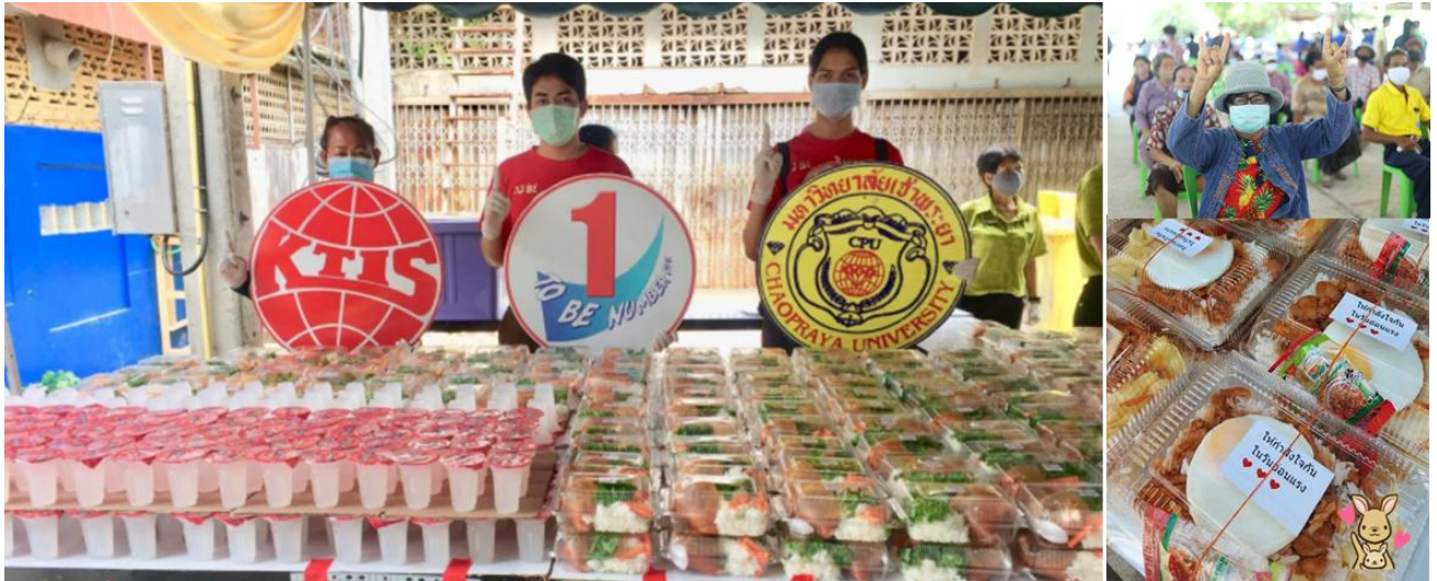
ภาพ: กลุ่ม KTIS ร่วมกับสถาบันการศึกษาในเครือข่าย มอบ "ถุงน้ำใจ" ให้กับพี่น้องชาวนครสวรรค์

สำหรับพี่น้องชาวนครสวรรค์ที่อยู่ห่างไกลจากตัวเมืองนั้น กลุ่ม KTIS, มหาวิทยาลัยเจ้าพระยา และวิทยาลัยอาชีวศึกษาวิทยาลัยนครสวรรค์ ยังผนึกความร่วมมือกับพันธมิตรทางธุรกิจ จัดตั้งโครงการ "ถุงน้ำใจ" ซึ่งเป็นถุงยังชีพ ที่บรรจุของใช้ที่จำเป็นในชีวิตประจำวัน โดยแจกจ่ายให้กับพี่น้องชาวนครสวรรค์ ในบริเวณชุมชนรอบโรงงานน้ำตาลเกษตรไทยฯ และโรงงานน้ำตาลเกษตรไทยฯ สาขา 3 จำนวนทั้งสิ้น 2,000 ชุด พร้อมมอบ "ของน้ำใจ" หรือเงินสดจำนวนหนึ่งสำหรับใช้จ่ายในครอบครัวอีกด้วย ทั้งนี้ผู้ว่าราชการจังหวัดนครสวรรค์และกาชาดจังหวัดนครสวรรค์ รวมถึงสภาอุตสาหกรรมนครสวรรค์ ก็ได้เข้ามามีส่วนร่วมกระจาย "ถุงน้ำใจ" ของกลุ่ม KTIS ไปยังพื้นที่ห่างไกลออกไป