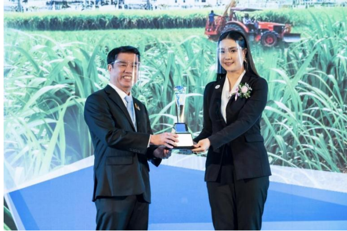
ภาพ: โรงงานน้ำตาลไทยเอกสิทธิ์ ในกลุ่ม KTIS รับรางวัลโรงงานน้ำตาลระดับดี (ปีที่ 7) และรางวัล “อ้อยรักษ์โลก” (ปีที่ 4)