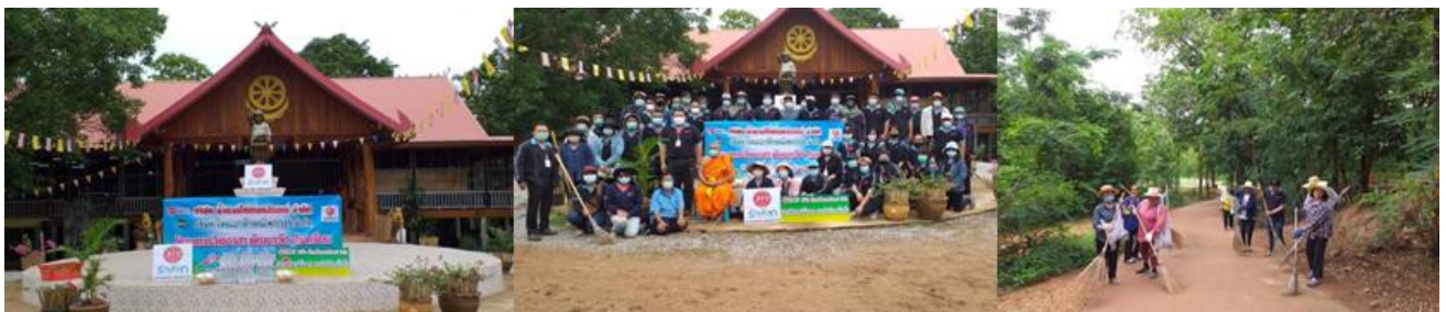
ภาพ: กลุ่ม KTIS ได้จัดกิจกรรม Big Cleaning Day : โครงการพัฒนาโรงเรียนและวัด

สำหรับโรงเรียน และวัดรอบๆ โรงงานของกลุ่ม KTIS นั้น กลุ่ม KTIS ได้จัดกิจกรรม Big Cleaning Day : โครงการพัฒนาโรงเรียนและวัด โดยร่วมกันทำความสะอาดและฉีดพ่นแอลกอฮอล์ KNAS ในโรงเรียนเพื่อเพิ่มความปลอดภัยด้านสุขอนามัยให้เด็กๆ เตรียมความพร้อมก่อนการเปิดภาคเรียนการสอนอีกครั้งในวันที่ 1 กรกฎาคม 2563 และในวัดเพื่อเตรียมความพร้อมก่อนวันงานสำคัญทางศาสนา เช่น วันอาสาฬหบูชา วันเข้าพรรษา เป็นต้น