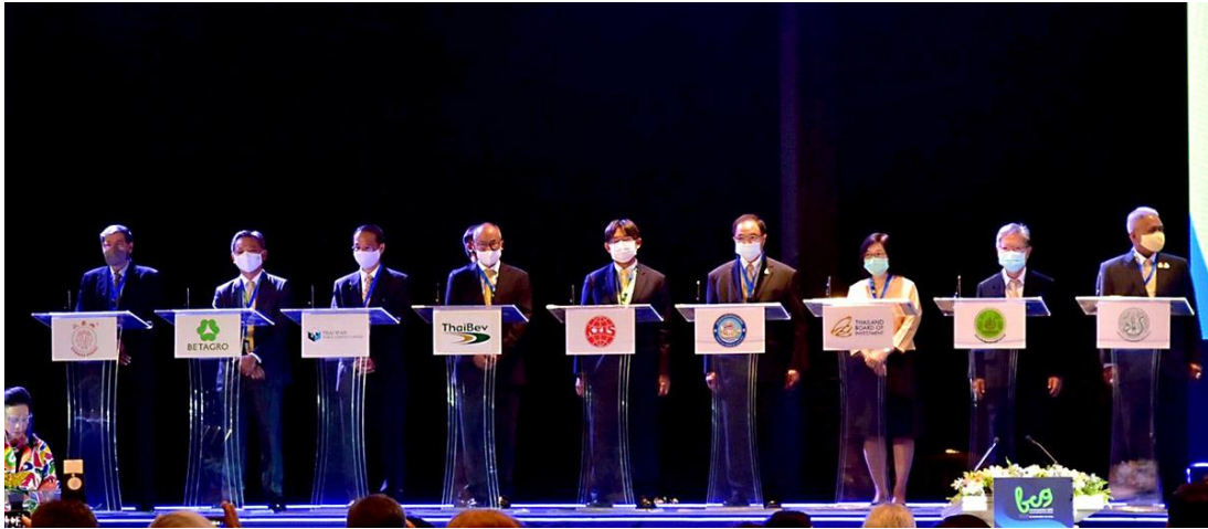
ภาพ: กลุ่ม KTIS ร่วมลงนามโมเดลเศรษฐกิจใหม่ BCG ขับเคลื่อนประเทศไทยสู่การเติบโตอย่างยั่งยืน