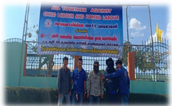
ภาพ: กลุ่ม KTIS ไม่สนับสนุนการใช้แรงงานเด็กในทุกกระบวนการผลิตในโรงงานและในไร่อ้อย

ในด้านของการอยู่ร่วมกับชุมชน (Community Relations) กลุ่ม KTIS ยังคงมีความสัมพันธ์อันดีกับชุมชนบริเวณใกล้เคียง มีการพบปะผู้นำชุมชนอย่างสม่ำเสมอ นอกจากนี้ ยังมีการจัดกิจกรรมต่างๆ เพื่อกระชับความสัมพันธ์ให้ดียิ่งขึ้น เช่น การจัดแข่งกีฬาท้องถิ่น การสนับสนุนการจัดแข่งขันกีฬาของโรงเรียนรอบโรงงาน การปรับภูมิทัศน์บริเวณชุมชน การเข้าร่วมกิจกรรมต่างๆ กับทางชุมชน เป็นต้น