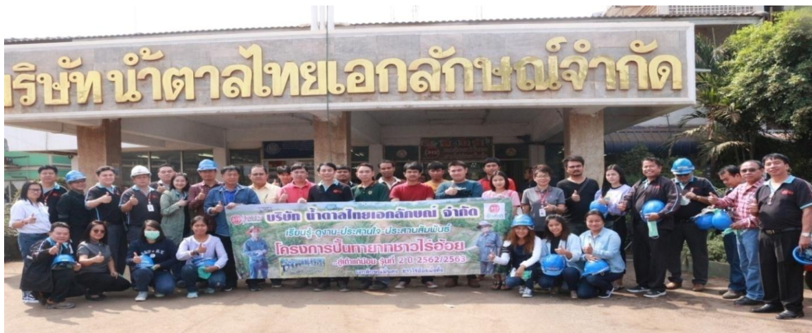
ภาพ : การอบรมให้ความรู้การทำไร่อ้อยสมัยใหม่ของโครงการปั้นทายาทชาวไร่อ้อยสู่เจ้าแกน้อย

กลุ่ม KTIS เปิดโครงการสร้างอาชีพสืบทอดอาชีพการทำไร่อ้อยจากรุ่นสู่รุ่น “ปั้นทายาท...สู่...เจ้าแกน้อย” รุ่นที่ 1 ณ โรงงานน้ำตาลไทยเอกลักษณ์ จำกัด ต.คงคา อ.เมือง จ.อุดรธานี โครงการนี้เป็นการสืบสานต่ออาชีพการทำไร่อ้อยของครอบครัว โดยจะเป็นการปลูกฝังแนวความคิดการทำไร่อ้อยสมัยใหม่ตามแนวเกษตร 4.0 การเพิ่มผลผลิตและลดต้นทุนการทำไร่อ้อย โดยผู้เชี่ยวชาญของกลุ่ม KTIS จะให้ความรู้เริ่มตั้งแต่หลักสูตรพื้นฐานทั้งทางทฤษฎีและการปฏิบัติ ตลอดจนถึงการนำเทคโนโลยีการเพาะปลูกอ้อยเพื่อเพิ่มผลผลิตและลดต้นทุนการทำไร่อ้อย พัฒนาทักษะด้านการบริหารจัดการ รวมถึงการแก้ไขปัญหาและการให้คำปรึกษาต่างๆ เพื่อให้มีอาชีพการทำไร่อ้อยที่มั่นคง มั่งคั่ง ยั่งยืน