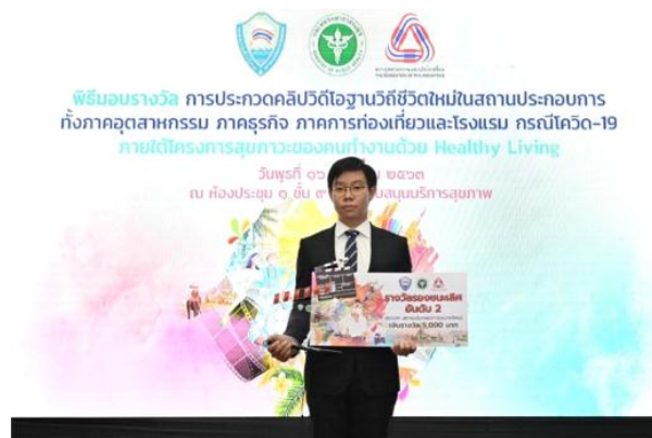
ภาพ: กลุ่ม KTIS รับรางวัลรองชนะเลิศอันดับ 2 จากการประกวดคลิปรีดิโอฐานวิถีชีวิตใหม่ในสถานประกอบการ

อย่างไรก็ตาม การระบาดในวงกว้างของไวรัสโควิด-19 ก็ทำให้ผู้คนทั่วโลกได้เห็นถึงความสำคัญของการดูแลตัวเองให้ห่างไกลจากโรคภัยต่างๆ มากขึ้น ในส่วนของโรงงาน และสำนักงานของกลุ่ม KTIS ก็ตระหนักและได้มีการปรับตัว ปรับเปลี่ยนพฤติกรรมตามวิถีชีวิตใหม่ (New Normal) เพื่อให้เกิดความยั่งยืนในเชิงรุก เพื่อลดความเสี่ยงในการการแพร่กระจายของเชื้อโรคต่างๆ ในอนาคตมากขึ้น เช่น การวัดอุณหภูมิก่อนเข้าโรงงาน และสำนักงาน การสวมหน้ากากอนามัยเมื่ออยู่นอกบ้านเพื่อป้องกันตัวเองและรับผิดชอบต่อสังคม การเว้นระยะห่างทางสังคม หลีกเลี่ยงสถานที่ที่มีคนพลุกพล่าน การล้างมืออย่างถูกวิธี หรือล้างมือด้วยเจลแอลกอฮอล์ บรรจุภัณฑ์เพื่อสิ่งแวดล้อมจะถูกใช้เป็นทางเลือกในการใช้แล้วทิ้งมากขึ้น และคอยติดตามข่าวสารเพื่ออัปเดตการแพร่ระบาดของไวรัสโควิด-19 นี้ เป็นต้น ทั้งนี้ เมื่อเดือนกันยายน 2563 ที่ผ่านมา กลุ่ม KTIS ได้ทำคลิปรีดิโอฐานวิถีชีวิตใหม่ในสถานประกอบการส่งเข้าประกวด และได้รับรางวัลรองชนะเลิศอันดับ 2 ประเภทสถานประกอบการขนาดใหญ่ จากการประกวดคลิปรีดิโอฐานวิถีชีวิตใหม่ในสถานประกอบการ ภาคอุตสาหกรรม ภาคธุรกิจ ภาคการท่องเที่ยวและโรงแรม กรณีโควิด-19 ภายใต้โครงการสุขภาวะของคนทำงานด้วย Healthy Living จัดโดย กรมควบคุมโรค กระทรวงสาธารณสุข ร่วมกับ สภาอุตสาหกรรมแห่งประเทศไทย และหอการค้าไทย โดยมีนายแพทย์ยงยศ ธรรมวุฒิ รองปลัดกระทรวงสาธารณสุข เป็นผู้มอบรางวัล ตามรูป