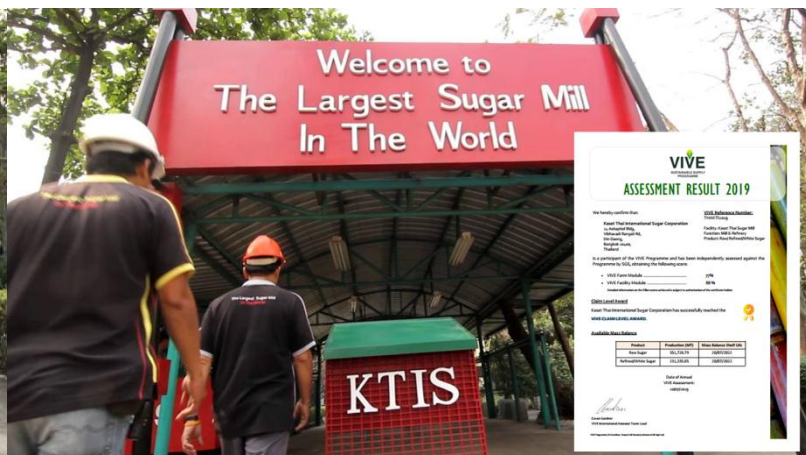
ภาพ: กลุ่ม KTIS กับรางวัลมาตรฐานสากลบอนซูโคร (Bonsucro) และรางวัล VIVE CLAIM LEVEL