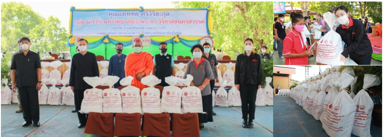
ภาพ: กลุ่ม KTIS ร่วมกับสถาบันการศึกษาในเครือข่าย มอบ "ถุงน้ำใจ" ให้กับพี่น้องชาวนครสวรรค์

สำหรับพี่น้องชาวนครสวรรค์ที่อยู่ห่างไกลจากตัวเมืองนั้น กลุ่ม KTIS, มหาวิทยาลัยเจ้าพระยา และวิทยาลัยอาชีวศึกษาวิทยาลัยนครสวรรค์ ยังผนึกความร่วมมือกับพันธมิตรทางธุรกิจ จัดตั้งโครงการ "ถุงน้ำใจ" ซึ่งเป็นถุงยังชีพ ที่บรรจุของใช้ที่จำเป็นในชีวิตประจำวัน โดยแจกจ่ายให้กับพี่น้องชาวนครสวรรค์ ในบริเวณชุมชนรอบโรงงานน้ำตาลเกษตรไทยฯ และโรงงานน้ำตาลเกษตรไทยฯ สาขา 3 จำนวนทั้งสิ้น 2,000 ชุด พร้อมมอบ "ของน้ำใจ" หรือเงินสดจำนวนหนึ่งสำหรับใช้จ่ายในครอบครัวอีกด้วย ทั้งนี้ผู้ว่าราชการจังหวัดนครสวรรค์และกาชาดจังหวัดนครสวรรค์ รวมถึงสภาอุตสาหกรรมนครสวรรค์ ก็ได้เข้ามามีส่วนร่วมกระจาย "ถุงน้ำใจ" ของกลุ่ม KTIS ไปยังพื้นที่ห่างไกลออกไป