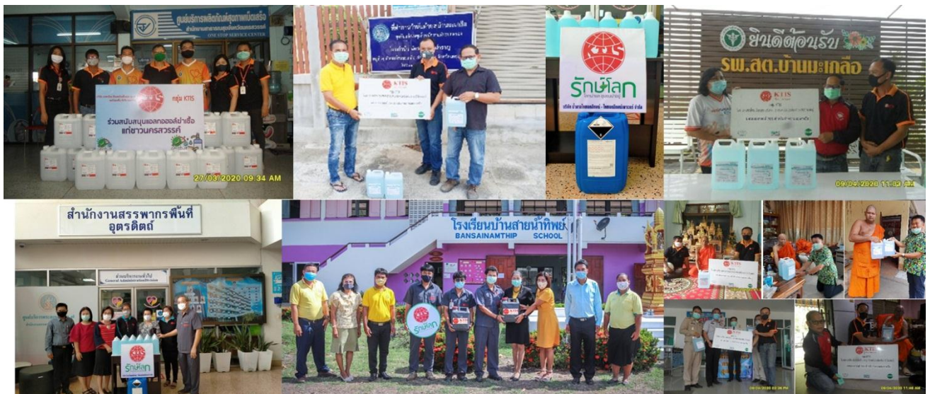
ภาพ: กลุ่ม KTIS มอบแอลกอฮอล์ให้โรงเรียน วัด หน่วยงานภาครัฐ และชุมชน

สำหรับโรงเรียน และวัดรอบๆ โรงงานของกลุ่ม KTIS นั้น กลุ่ม KTIS ได้จัดกิจกรรม Big Cleaning Day : โครงการพัฒนาโรงเรียนและวัด โดยร่วมกันทำความสะอาดและฉีดพ่นแอลกอฮอล์ KNAS ในโรงเรียนเพื่อเพิ่มความปลอดภัยด้านสุขอนามัยให้เด็กๆ เตรียมความพร้อมก่อนการเปิดภาคเรียนการสอนอีกครั้งในวันที่ 1 กรกฎาคม 2563 และในวัดเพื่อเตรียมความพร้อมก่อนวันงานสำคัญทางศาสนา เช่น วันอาสาฬหบูชา วันเข้าพรรษา เป็นต้น