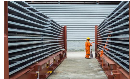
งานโครงสร้างเหล็ก – อุตสาหกรรมพลังงานแสงอาทิตย์ โครงการ SunSHIFT ประเทศออสเตรเลีย