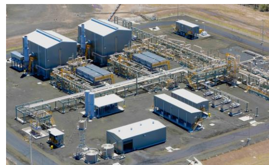
งานแปรรูปและประกอบกลุ่มชิ้นงานขนาดใหญ่ – อุตสาหกรรมก๊าซโครงการ APLNG – Pre Assemble Unit ประเทศออสเตรเลีย