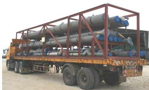
งานระบบท่อ – อุตสาหกรรมปิโตรเคมี โครงการ UTC-Pipe spool fabrication ประเทศบราซิล