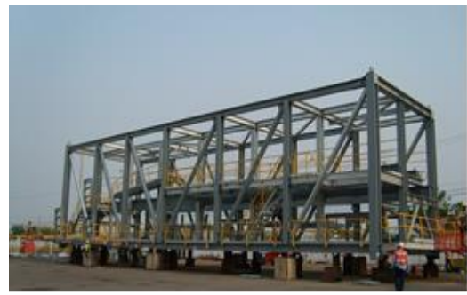
งานโครงสร้างเหล็ก – อุตสาหกรรมเหมืองแร่ โครงการ Cape Lambert Port B ประเทศออสเตรเลีย