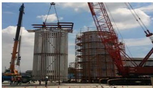
โครงสร้างเตาเผาอุตสาหกรรม โครงการ Abadan ประเทศอิหร่าน

บริษัทฯ ให้บริการแปรรูปผลิตภัณฑ์เหล็กเป็นชิ้นส่วนโครงสร้างเตาเผาอุตสาหกรรมและโครงสร้างอุปกรณ์กำเนิดความร้อน ซึ่งจะถูกนำไปใช้ในอุตสาหกรรมต่างๆ เช่น อุตสาหกรรมปิโตรเคมี โรงกลั่นน้ำมัน และอุตสาหกรรมเหมืองแร่ เป็นต้น โดยที่ผ่านมา บริษัทฯ ได้ก่อสร้างโครงสร้างเตาเผาอุตสาหกรรมและโครงสร้างอุปกรณ์กำเนิดความร้อนมากกว่า 300 โครงการ