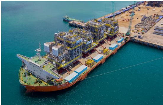
งานแปรรูปและประกอบกลุ่มชิ้นงานขนาดใหญ่ – อุตสาหกรรมน้ำมันและก๊าซโครงการ TUPi FPSOs Modules ประเทศบราซิล