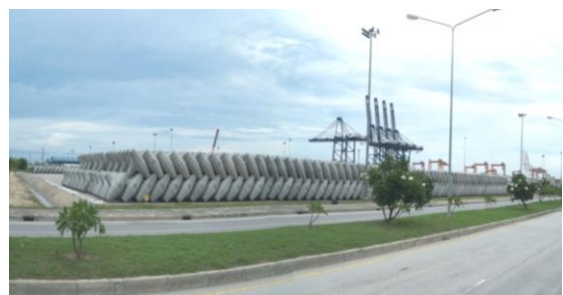
ชิ้นส่วนเขื่อนกันชายฝั่งจากคลื่นทะเล (Breakwater) โครงการ Sino Iron Cape Preston Breakwater ประเทศออสเตรเลีย

ด้วยประสบการณ์อันยาวนานเข้าสู่ปีที่ 25 ในการดำเนินธุรกิจ ทำให้บริษัทฯ มีประสบการณ์และความเชี่ยวชาญเป็นอย่างสูง รวมถึงได้รับการยอมรับจากลูกค้าในระดับนานาชาติ บริษัทฯ มีความสามารถในการผลิตสินค้าได้หลากหลายรูปแบบและให้บริการได้ตรงตามความต้องการของลูกค้า และมีคุณภาพตามมาตรฐานสากล เป็นผลมาจากบริษัทฯ มีทีมงานวิศวกรที่มีความชำนาญและมีความเข้าใจในงานโครงสร้างผลิตภัณฑ์ประเภทต่างๆ เป็นอย่างดี