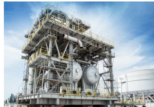
งานแปรรูปและประกอบกลุ่มชิ้นงานขนาดใหญ่ – อุตสาหกรรมน้ำมันและก๊าซโครงการ FPSOs P75/P77 ประเทศบราซิล