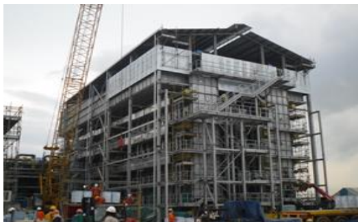
งานติดตั้งนอกสถานที่ – อุตสาหกรรมก๊าซ โครงการ Hermes Hydrogen ประเทศสิงคโปร์