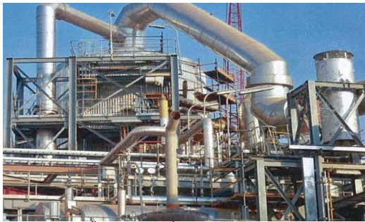
งานติดตั้งนอกสถานที่ – อุตสาหกรรมเหมืองแร่ โครงการ Tenke Fungurume Mining สาธารณรัฐประชาธิปไตยคองโก