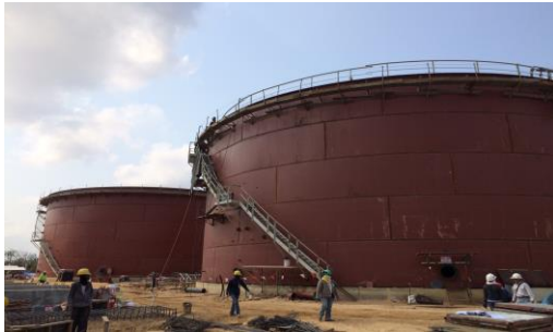
โครงการ HDCE Sriracha ประเทศไทย

บริษัทฯ ให้บริการแปรรูปผลิตภัณฑ์เหล็กเป็นภาชนะบรรจุสินค้าประเภท ของเหลว ก๊าซ หรือสารเคมี ซึ่งภาชนะดังกล่าวไม่ได้ออกแบบเพื่อให้สามารถรับความดันในกระบวนการผลิต (Non-pressured Tank)