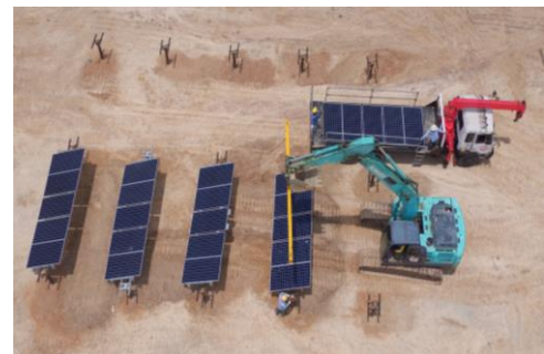
งานโครงสร้างเหล็ก – อุตสาหกรรมพลังงานแสงอาทิตย์ โครงการ SunSHIFT ประเทศออสเตรเลีย