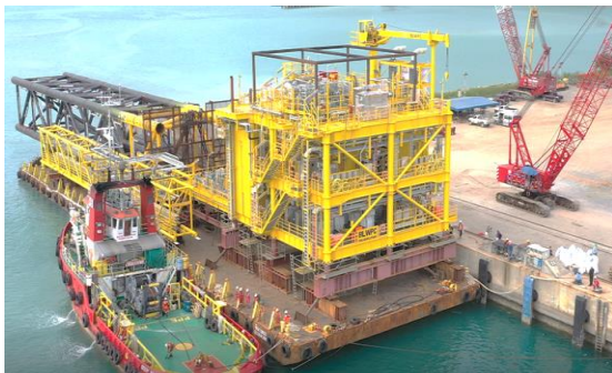
งานแปรรูปและประกอบกลุ่มชิ้นงานขนาดใหญ่ – อุตสาหกรรมน้ำมันและก๊าซโครงการ Phase 4B BLWPC and Decks Fabrication and Transportation ประเทศไทย

งานแปรรูปผลิตภัณฑ์เหล็กเป็นชิ้นส่วนต่างๆ นั้น บริษัทฯ จะดำเนินการภายในพื้นที่โรงงานของบริษัทฯ และนำไปประกอบเป็นโครงสร้างกลุ่มชิ้นงานขนาดใหญ่ ณ บริเวณพื้นที่ก่อสร้างซึ่งอยู่ใกล้ท่าเรือ ทั้งนี้เพื่อความสะดวกในการขนส่งชิ้นงานโครงสร้างซึ่งมีขนาดใหญ่ทางเรือไปยังจุดหมายที่ลูกค้ากำหนด