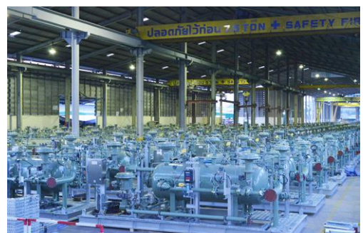
ภาชนะความดัน – อุตสาหกรรมก๊าซ โครงการ APLNG WHS ประเทศออสเตรเลีย

ทั้งนี้ ส่วนสำคัญของงานแปรรูปผลิตภัณฑ์เหล็กคือ ความสามารถของวิศวกรผู้ปฏิบัติงานและช่างฝีมือในงานประเภทโครงสร้างโลหะ ได้แก่ การตัด (Cutting) การดัด (Bending) การเจาะ (Drilling) และการเชื่อม (Welding) มาประกอบให้ได้ลักษณะโครงสร้างหรือชิ้นงานตามแบบที่ลูกค้ากำหนด บริษัทฯ มีทีมวิศวกรผู้ปฏิบัติงานที่มีประสบการณ์ ได้แก่ วิศวกรออกแบบ วิศวกรควบคุมการผลิต และวิศวกรควบคุมคุณภาพ และมีทีมช่างฝีมือที่มีประกาศนียบัตรช่างเชื่อมตามที่มาตรฐานของผลิตภัณฑ์แต่ละประเภทกำหนด ตัวอย่างมาตรฐานผลิตภัณฑ์ที่กำหนด ได้แก่ มาตรฐานฝีมือช่างเชื่อม มาตรฐานในการผลิตภาชนะความดัน มาตรฐานในการก่อสร้างการเดินท่อนำส่งก๊าซในโรงงานอุตสาหกรรมที่เกี่ยวข้องกับก๊าซต่างๆ หรือโรงกลั่นน้ำมัน และมาตรฐานในการก่อสร้างโครงสร้างที่ใช้ในการรับน้ำหนัก