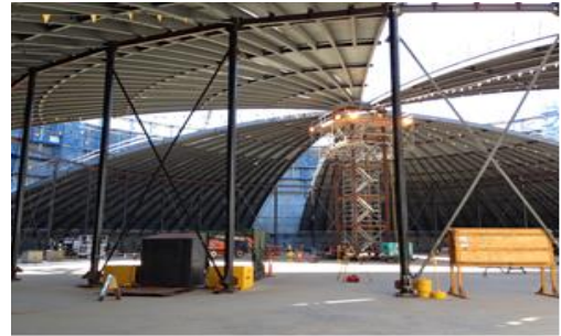
โครงการ Wheatstone LNG Plant ประเทศออสเตรเลีย