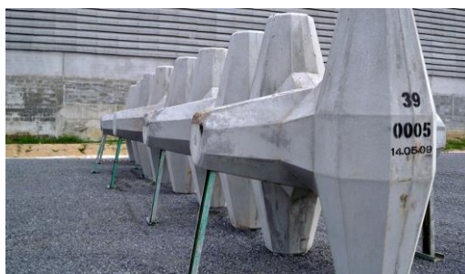
ชิ้นส่วนเขื่อนกันชายฝั่งจากคลื่นทะเล (Breakwater) โครงการ Sino Iron Cape Preston Breakwater ประเทศออสเตรเลีย

บริษัทฯ ให้บริการผลิตผลิตภัณฑ์ชิ้นส่วนคอนกรีตสำเร็จรูปตามแบบของลูกค้าเป็นหลัก โดยลูกค้าเป็นผู้จัดหาแม่แบบ (Mold) และส่งให้กับบริษัทฯ หรือบริษัทฯ เป็นผู้จัดหาแม่แบบเองแล้วแต่ข้อตกลง ตัวอย่างผลิตภัณฑ์คอนกรีตหล่อสำเร็จรูปที่บริษัทฯ ได้ทำการผลิตในอดีต ได้แก่ ชิ้นส่วนเขื่อนกันชายฝั่งหรือท่าเรือจากคลื่นของน้ำทะเล (Breakwater แบบ CORE-LOC™) เพื่อป้องกันคลื่นกัดเซาะชายฝั่ง แผ่นคอนกรีตสำเร็จรูป (Precast Concrete Panel) แผ่นคอนกรีตสำเร็จรูปอัดแรง (Pre-stress Concrete Panel) เพื่อใช้เป็นสะพาน ทางยกระดับ ท่าเทียบเรือ เป็นต้น