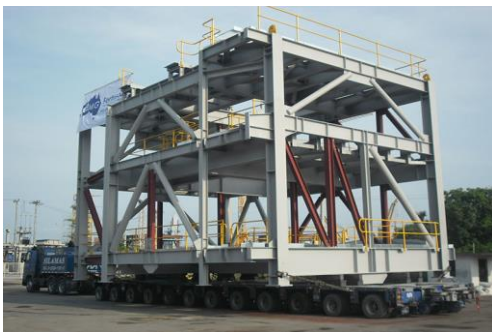
งานโครงสร้างเหล็ก – อุตสาหกรรมเหมืองแร่ โครงการ FMG Solomon Mines Stock Yard ประเทศออสเตรเลีย

งานโครงสร้างเหล็ก เป็นการแปรรูปผลิตภัณฑ์เหล็กต่างๆ ให้เป็นชิ้นงานโครงสร้างขนาดใหญ่ ซึ่งจะถูกนำไปใช้เป็นโครงสร้างหลักในโรงงานอุตสาหกรรมขนาดใหญ่ เช่น โรงกลั่นน้ำมัน โรงงานปิโตรเคมี โรงไฟฟ้า และเหมือง เป็นต้น ตัวอย่างงานโครงสร้างเหล็ก ที่นำมาใช้ในโรงงานอุตสาหกรรม ได้แก่ โครงสร้างเหล็กอาคารโรงงาน โครงสร้างเหล็กรับท่อ โครงสร้างระบบสายพานลำเลียง เป็นต้น