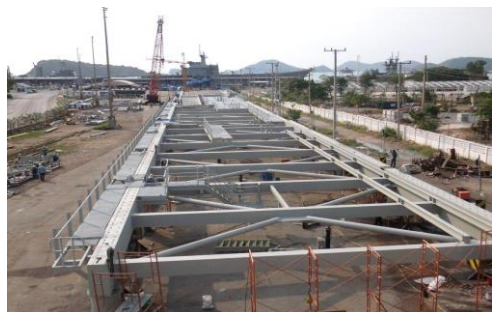
งานโครงสร้างเหล็กท่าเรือ – อุตสาหกรรมขนส่งและโลจิสติกส์ โครงการ Geraldton Port Berth 7 ประเทศออสเตรเลีย