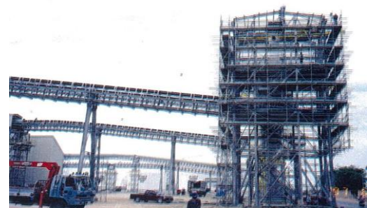
งานติดตั้งนอกสถานที่ – อุตสาหกรรมปิ๋ย โครงการปิ๋ยแห่งชาติ ประเทศไทย