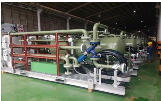
ภาชนะความดัน – อุตสาหกรรมก๊าซ โครงการ SANTOS ประเทศออสเตรเลีย

ภาชนะความดันและชิ้นส่วนทนแรงดัน เป็นอุปกรณ์ที่สามารถทนต่อแรงดันในกระบวนการผลิตของโรงงานอุตสาหกรรมได้ โดยส่วนใหญ่ภาชนะความดันและชิ้นส่วนทนแรงดันจะถูกใช้สำหรับบรรจุหรือเป็นท่อนำส่งสารเคมีที่เป็นก๊าซหรือของเหลว ซึ่งในระหว่างกระบวนการผลิตจะต้องมีการควบคุมความดันตามกระบวนการทางวิศวกรรมเพื่อควบคุมไม่ให้เกิดการรั่วไหลและก่อให้เกิดอันตรายได้ ดังนั้นผลิตภัณฑ์ต้องมีคุณภาพตามที่มาตรฐานความปลอดภัยกำหนด โดยภาชนะความดันนี้จะถูกนำไปใช้ในอุตสาหกรรมปิโตรเคมี และก๊าซ เป็นต้น