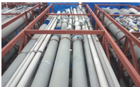
งานระบบท่อ – อุตสาหกรรมปิโตรเคมี โครงการ UTC-Pipe spool fabrication ประเทศบราซิล

บริษัทฯ ให้บริการประกอบและเชื่อมต่อให้ได้ขนาดและรูปร่างตามแบบ และนำไปประกอบติดตั้งเป็นระบบท่อเพื่อใช้ในกระบวนการผลิตของโรงงานอุตสาหกรรม