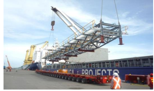
งานโครงสร้างระบบสายพานลำเลียง – อุตสาหกรรมเหมืองแร่ โครงการ BHP – RGP 5 ประเทศออสเตรเลีย