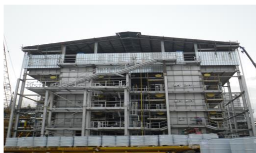
โครงสร้างอุปกรณ์กำเนิดความร้อน โครงการ Hermes H2 ประเทศสิงคโปร์