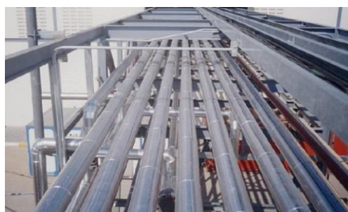
งานระบบท่อ – อุตสาหกรรมปิโตรเคมี โครงการปุ๋ยแห่งชาติ ประเทศไทย