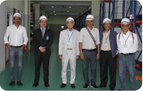
รายงานการเข้าร่วมประชุมของสมาชิก มีดังต่อไปนี้

คณะกรรมการตรวจสอบได้เข้าเยี่ยมชมบริษัทย่อยที่ประเทศพม่า เมื่อวันที่ 16 พฤศจิกายน พ.ศ. 2558 และได้พบปะกับผู้บริหารผู้ตรวจสอบภายในและยังได้เข้าเยี่ยมชมโรงงานอีกด้วย