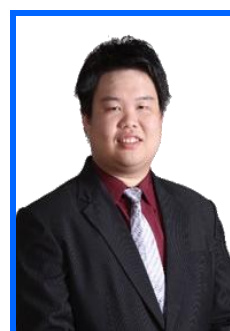
นายพลเอก รุ่งโรจน์กิตติยศ