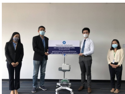
ร่วมบริจาคเครื่องช่วยหายใจให้แก่โรงพยาบาล ราชภัฏ บูรณะ โดยมีตัวแทนของทางโรงพยาบาลเป็นผู้รับมอบที่ สำนักงานกรุงเทพ เมื่อวันที่ 6 สิงหาคม 2564