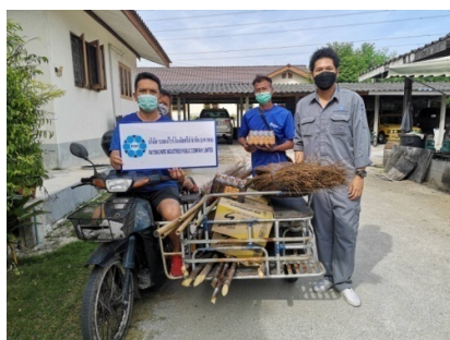
สนับสนุนกิจกรรม CSR พัฒนาชุมชนในวันคล้ายวันพระบรม ราชสมภพของพระบาทสมเด็จพระบรมชนกาธิเบศร มหาภูมิ พลอดุลยเดชมหาราช บรมราถบพิตร ของชุมชนหนองน้ำ เย็น ในวันที่ 4 ธ.ค. 2564