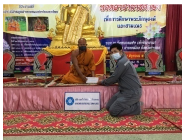
ร่วมเป็นเจ้าภาพทอดผ้าป่าเพื่อการศึกษาพระภิกษุสามเณร ณ วัดหนองแพบ วันที่ 17 มิถุนายน 2564