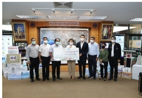
มอบเงินให้กับโรงพยาบาลมาบตาพุด เพื่อสู้ภัย COVID-19 เมื่อวันที่ 18 มิถุนายน 2564