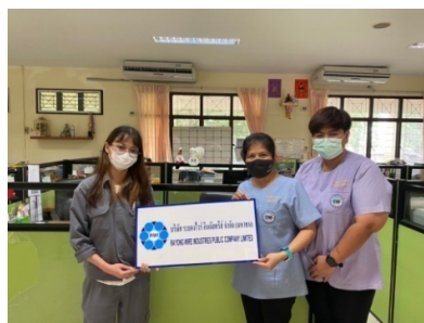
ร่วมสนับสนุนกิจกรรมCSR ชื้อถุ้งยังชีพในโครงการดูแล ผู้สูงอายุระยะยาวที่มีภาวะพึ่งพิงและบุคคลอื่นที่มีภาวะ พึ่งพิง ณ สำนักงานเทศบาลเมืองมาบตาพุด ในวันที่ 19 พ.ย. 2564