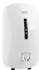
P-Series WH 3.8

เครื่องทำน้ำอุ่นรุ่นนี้มาพร้อมกับชุดฝักบัวโครเมียม 3 Step พร้อม Slide Bar เพื่อเสริมสุนทรีย์ในการอาบน้ำที่เน้นความหรูหรา และโดดเด่นในกลุ่มผู้บริโภค นอกจากนี้ ยังมีระบบตรวจสอบสายดินแสดงผล “EARTH” ที่มีไฟแสดงผลพร้อมใช้งานก็ต่อเมื่อระบบการติดตั้งที่สมบูรณ์อย่างแท้จริง