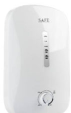
P-Series WH 4.5

ช่องทางการจัดจำหน่าย : ผ่านระบบ E-commerce ภายใต้เว็บไซต์ www.safealkaline.com โมเดิร์นเทรด (เช่น โฮมโปร) การออกบูธแสดงสินค้าตามงานต่าง ๆ และการขายโดยพนักงานขายทางโทรศัพท์ (Telesales)