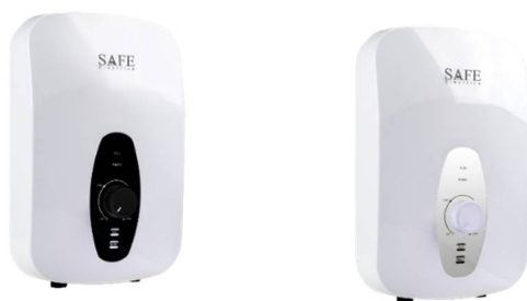
Q-Series WH 3.8