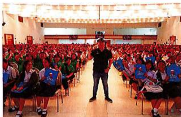
อิชิตัน กรุ๊ป จัดโครงการ “Ichitan Road to University”

โดยรวม 10 ตัวเตอรืชื่อดังจากสถาบัน กวดวิชาชั้นนำในเมืองไทย เปิดคอร์สติวเข้มเทคนิคพิชิตข้อสอบ 8 วิชาหลัก ในระบบการสอบเข้ามหาวิทยาลัยแบบใหม่ล่าสุด ทีแคส หรือ