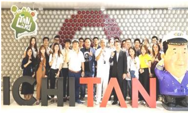
ต้อนรับ คณะนักลงทุน จาก MAYBANK