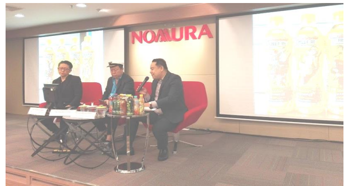
CONSUMER DAY 2019