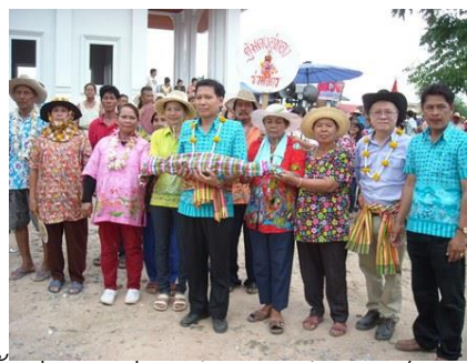
วันที่ 4 มิถุนายน 2557 พนักงานบริษัท ไทย อะโกร เอ็นเนอรยี่ จำกัด (มหาชน) ร่วมบริจาคโลหิต ในงาน