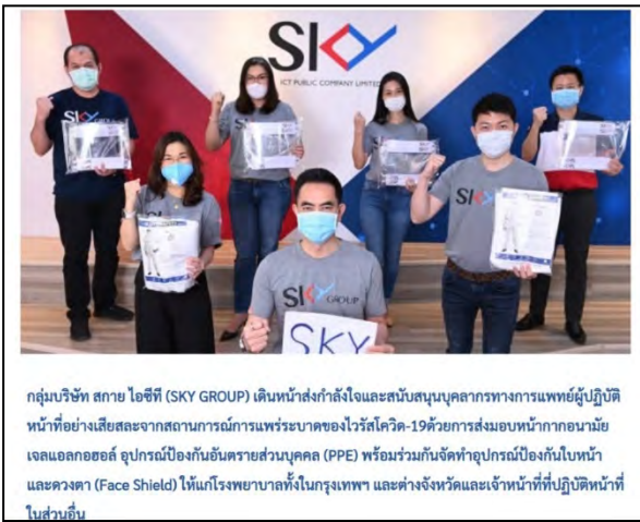
กลุ่มบริษัท สกาย ไอซีที (SKY GROUP) เดินทางส่งกำลังใจและสนับสนุนบุคลากรทางการแพทย์ผู้ปฏิบัติหน้าที่อย่างเสียสละจากสถานการณ์การแพร่ระบาดของไวรัสโควิด-19 ด้วยการมอบหน้ากากอนามัย เจลแอลกอฮอล์ อุปกรณ์ป้องกันอันตรายส่วนบุคคล (PPE) พร้อมร่วมกันจัดทำอุปกรณ์ป้องกันใบหน้าและดวงตา (Face Shield) ให้แก่โรงพยาบาลในกรุงเทพฯ และต่างจังหวัดและเจ้าหน้าที่ที่ปฏิบัติงานในสวน