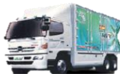
รถสิบล้อ-หกล้อเชิงพาณิชย์