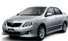
รถยนต์นั่งส่วนบุคคล