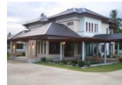
บ้านและที่ดิน