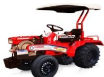
รถแทรกเตอร์