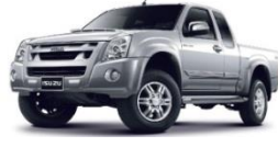
รถกระบะส่วนบุคคล