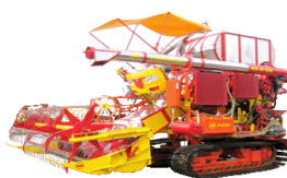
รถเกี่ยวข้าว