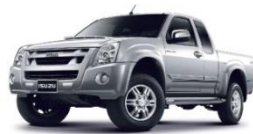
รถกระบะส่วนบุคคล