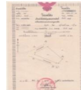
บ้านและที่ดิน

หากพิจารณาตามประเภทของนิติกรรมสัญญาในการให้กู้ยืม สามารถแบ่งได้เป็น 2 กลุ่มดังนี้