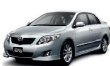
รถยนต์นั่งส่วนบุคคล