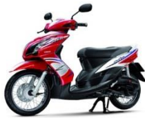
รถจักรยานยนต์