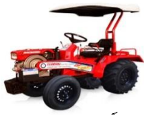
รถแทรกเตอร์