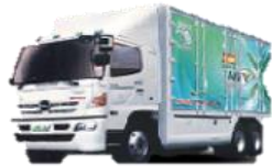
รถสิบล้อ-หกล้อเชิงพาณิชย์