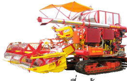
รถเกี่ยวข้าว