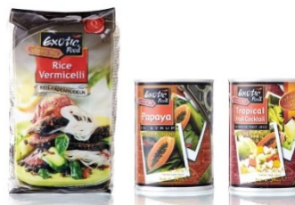
ตัวอย่างผลิตภัณฑ์อาหารกึ่งสำเร็จรูป