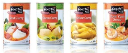
ตัวอย่างผลิตภัณฑ์อาหารสำเร็จรูปพร้อมรับประทาน