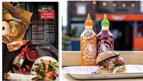
ตัวอย่างการจัดกิจกรรมส่งเสริมการขายร่วมกับพันธมิตรของบริษัท

แต่ละช่วงเวลาและภาวะของตลาด โดยผู้นำเข้าและผู้จัดจำหน่ายจะให้ข้อมูลเกี่ยวกับสภาพตลาด การแข่งขัน และความต้องการของผู้บริโภคในประเทศต่างๆ เพื่อให้บริษัทนำไปพัฒนาผลิตภัณฑ์ที่สร้างความพึงพอใจสูงสุดแก่ผู้บริโภคในตลาดนั้นๆ