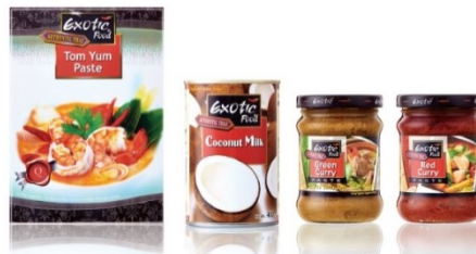
ตัวอย่างผลิตภัณฑ์เครื่องปรุงรสและเครื่องประกอบอาหาร