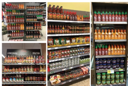
การจัดวางสินค้าของบริษัทในซูเปอร์มาร์เก็ตในประเทศต่างๆ ทั่วโลก

บริษัทมีการจำหน่ายสินค้าสู่ผู้บริโภคผ่านผู้จัดจำหน่ายชั้นนำในต่างประเทศ ซึ่งมีความสามารถในการกระจายสินค้าของบริษัทเข้าสู่ห้างสรรพสินค้า ซูเปอร์มาร์เก็ต และร้านค้าในประเทศต่างๆ ทั่วโลก ทั้งนี้ การที่บริษัทมีสินค้าที่หลากหลายและครอบคลุมเกือบทุกประเภทของอาหารไทย ทำให้การจัดวางสินค้าของบริษัทมีความสะดวกเมื่อเทียบกับผลิตภัณฑ์ของผู้ผลิตรายอื่นๆ ที่มีสินค้านำมาจัดวางน้อยกว่า นอกจากนี้ ผู้บริโภคยังสามารถสั่งซื้อผลิตภัณฑ์ของบริษัทผ่านทางเว็บไซต์ของผู้จัดจำหน่ายต่างๆ โดยมีต้องเดินทางไปซื้อที่ร้านค้า จึงเป็นการตอบสนองความต้องการของลูกค้ากลุ่มที่นิยมสั่งซื้อสินค้าผ่านอินเทอร์เน็ตได้เป็นอย่างดี นับเป็นการเพิ่มช่องทางการจัดจำหน่ายและเข้าถึงของผู้บริโภคอีกทางหนึ่งด้วย