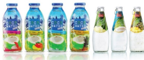
ตัวอย่างผลิตภัณฑ์เครื่องดื่มจากผักและผลไม้