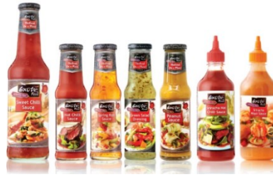
ตัวอย่างผลิตภัณฑ์ซอสปรุงรสและน้ำจิ้มต่างๆ

รสผลไม้ต่างๆ บริษัทเป็นผู้ผลิตและจำหน่ายภายใต้ตราสินค้าของบริษัทเองเป็นส่วนใหญ่ ซึ่งได้แก่ EXOTIC FOOD THAI PRIDE และ FLYING GOOSE