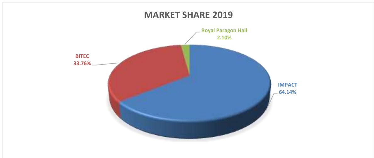
แผนภาพที่ 3 ส่วนแบ่งทางการตลาดของ 3 สถานที่หลักในธุรกิจการประชุมและศูนย์การแสดงสินค้า ปี 2562

แผนภาพแสดงส่วนแบ่งทางการตลาดของ 3 สถานที่หลักในธุรกิจการประชุมและศูนย์การแสดงสินค้าระหว่างวันที่ 1 มกราคม – 31 ธันวาคม พ.ศ. 2562 โดยรวบรวมจากข้อมูลที่ประชาสัมพันธ์งานแสดงสินค้าในเว็บไซต์