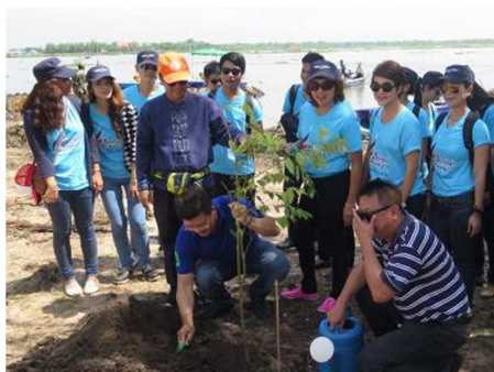
จัดกิจกรรม “Fly for Forest” ที่ จังหวัด อุดรธานี