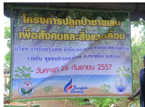
จัดกิจกรรม “Fly for Forest” ที่ จังหวัด ตรัง