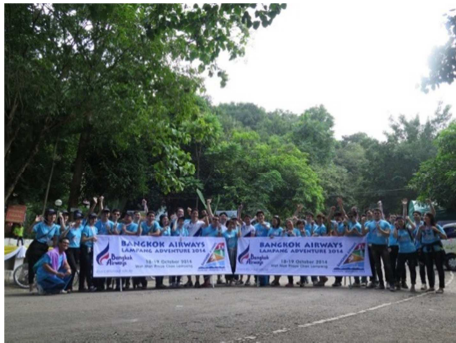
จัดกิจกรรม “Fly for Forest ร่วมสร้างฝายที่ จังหวัด ลำปาง