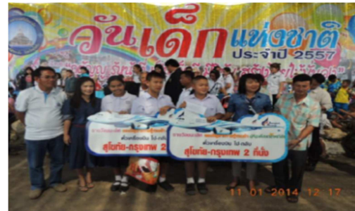
จัดงานวันเด็กให้โรงเรียน 13 แห่งใกล้สนามบินสุโขทัย