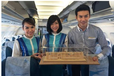
บางกอกแอร์เวย์สร่วมช่วยเหลือเชียงราย

บริษัทฯ และบริษัทย่อย ได้ทำกิจกรรมเพื่อประโยชน์ต่อสังคมและสิ่งแวดล้อมอย่างต่อเนื่อง เช่น การร่วมบริจาค, การร่วมปลูกป่า และการสร้างฝาย บริษัทฯ ได้ให้ความสำคัญกับการจัดกิจกรรมส่งเสริมการเรียนรู้ให้แก่เด็กและเยาวชนท้องถิ่น เช่น การจัดกิจกรรมวันเด็ก ให้ทุนการศึกษาสำหรับนักเรียนที่มีผลการเรียนดี นอกจากนี้ บริษัทฯ ยังได้จัดกิจกรรมเพื่อส่งเสริมสิ่งแวดล้อม โดยจัดให้มีกิจกรรม “Car Free Day” เพื่อรณรงค์เรื่องลดการใช้รถยนต์ส่วนบุคคล และหันมาใช้รถขนส่งมวลชน และรถจักรยาน เพิ่มมากขึ้น เพื่อลดปัญหามลพิษทางอากาศและเสียง ปัญหาการจราจรและลดการเกิดอุบัติเหตุ ตลอดจนลดการใช้พลังงาน เป็นต้น