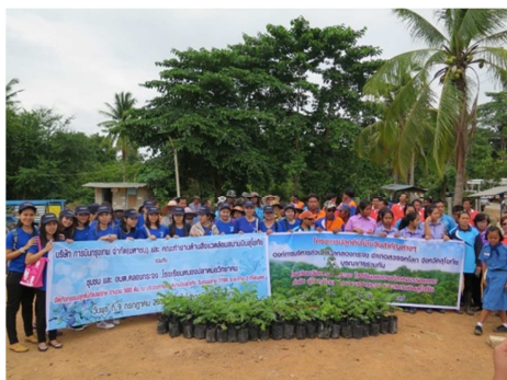
จัดกิจกรรม “Fly for Forest” ที่ จังหวัด สุโขทัย