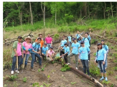
จัดกิจกรรม “Fly for Forest” ที่ จังหวัด ลำปาง