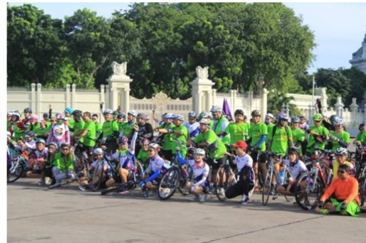
กิจกรรม Car Free Day 2014