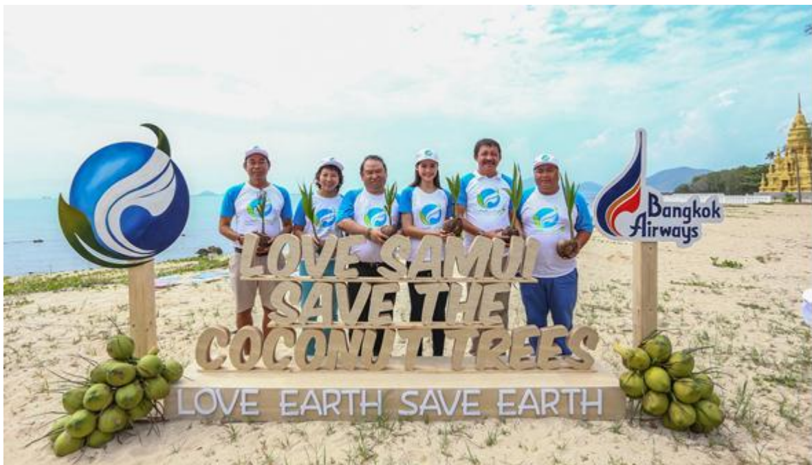
Love Earth save Earth