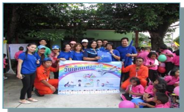
จัดงานวันเด็กให้โรงเรียนใกล้เคียงสนามบินสุโขทัย ตราด และสมุย