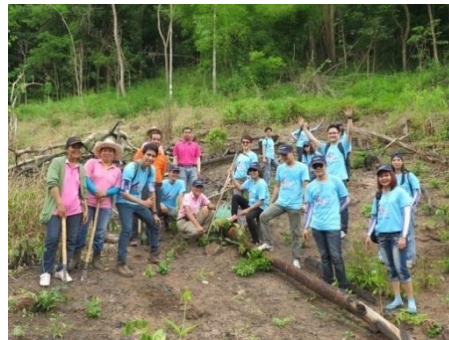
จัดกิจกรรม “Fly for Forest” ที่ จังหวัด อุตรดิตถ์ ลำปาง และตราด