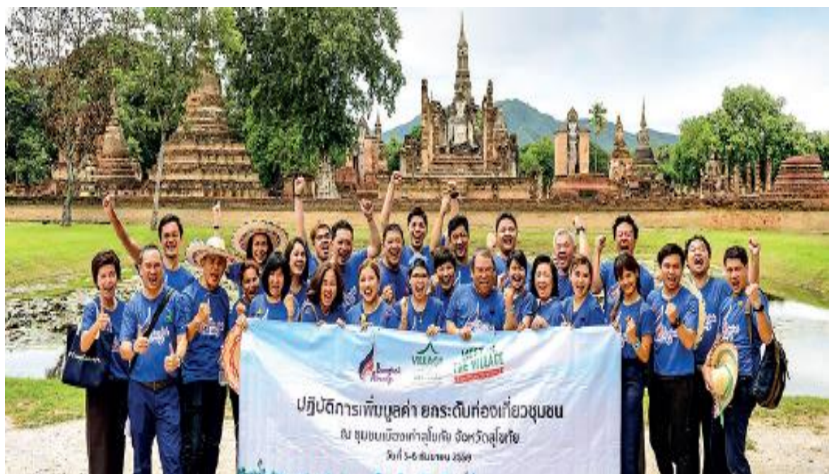
กิจกรรม Meet in the Village to the world เพื่อโปรโมตการท่องเที่ยว “ชุมชนเมืองเก่า จังหวัดสุโขทัย”