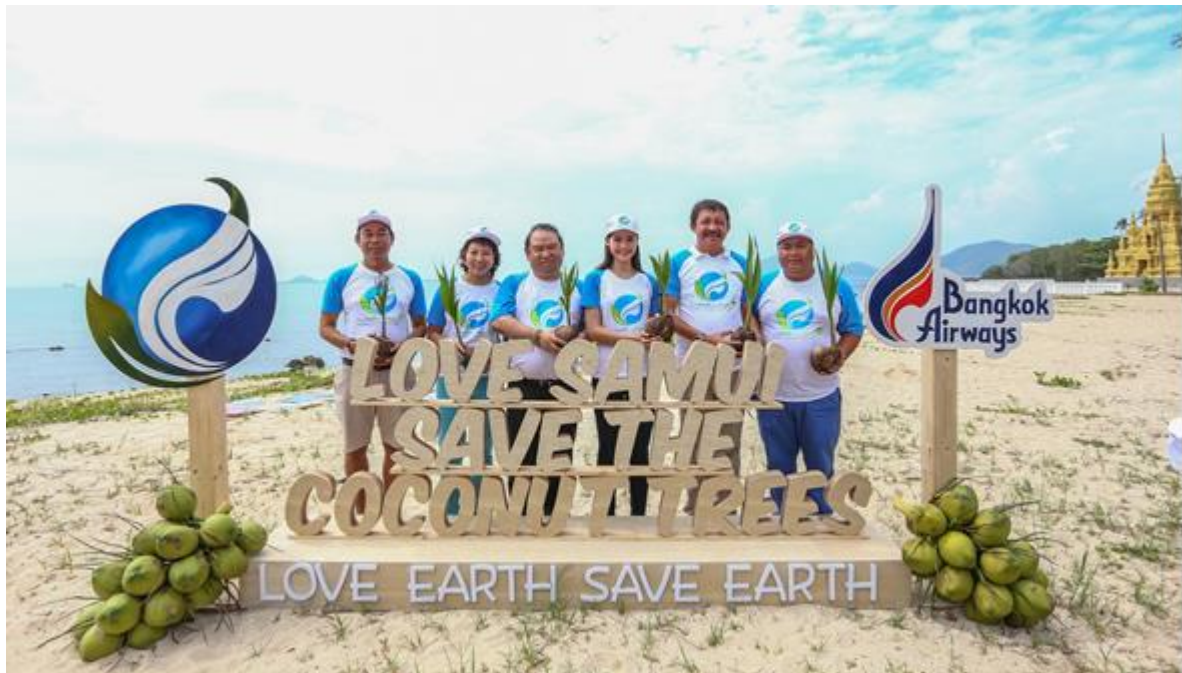
Love Earth save Earth