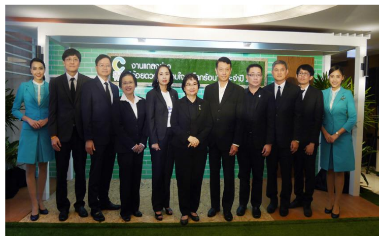
การได้รับการขึ้นทะเบียนคาร์บอนฟุตพริ้นท์