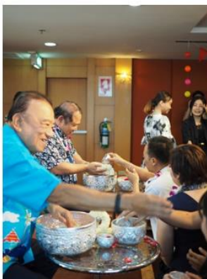
พิธีค้ำน้ำผู้บริหารเนื่องในเทศกาลสงกรานต์