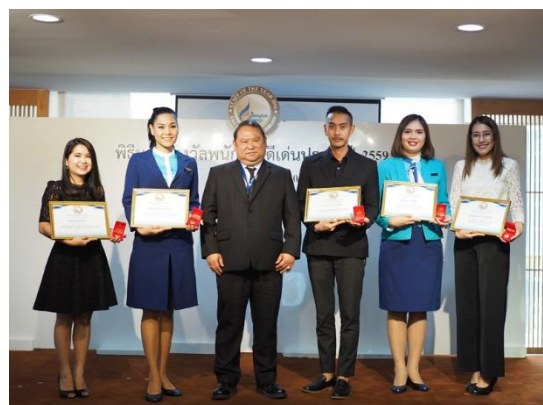
พิธีมอบรางวัลพนักงานดีเด่นประจำปี 2559