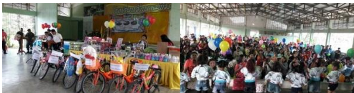
บริษัท สยาม โซลาร์ เอ็นเนอร์ยี 1 จำกัด สาขา SSE1 – PV10 ร่วมสนับสนุนการจัดกิจกรรมงานวันเด็ก ณ โรงเรียนวัดนางพิมพ์ ต.วังลึก อ.สามชุก จ.สุพรรณบุรี