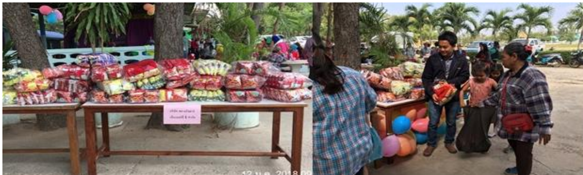
บริษัท สยาม โซลาร์ เอ็นเนอร์ยี 1 สาขา SSE1 – PV03 ร่วมมอบขนมในการจัดกิจกรรมงานวันเด็ก ณ โรงเรียนวัดปลั่งลัก ต.หนองหญ้าไซ อ.หนองหญ้าไซ จ.สุพรรณบุรี