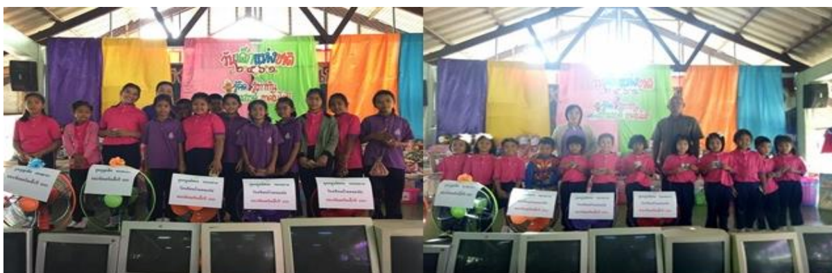
บริษัท สยาม โซลาร์ เอ็นเนอร์ยี 1 จำกัด สาขา SSE1 – PV06 ร่วมสนับสนุนการจัดกิจกรรมงานวันเด็ก ณ โรงเรียนบ้านหนองไผ่ ต.หนองไผ่ อ.ด่านมะขามเตี้ย จ.กาญจนบุรี