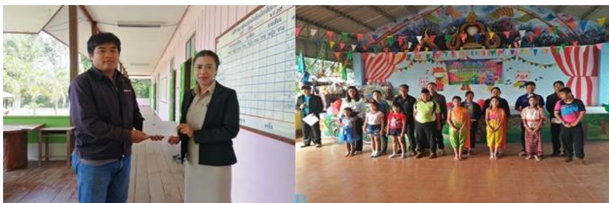
บริษัท สยาม โซลาร์ เอ็นเนอร์ยี 1 จำกัด สาขา SSE1 – PV04, PV05 ร่วมสนับสนุนการจัดกิจกรรมงานวันเด็ก ณ โรงเรียนวัดหนองกระทุ่ม อ.เดิมบางนางบวช จ.สุพรรณบุรี