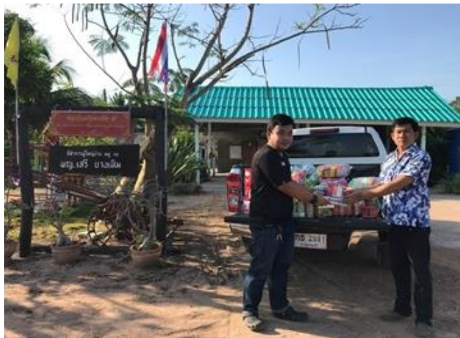
บริษัท สยาม โซลาร์ เอ็นเนอร์ยี 1 จำกัด สาขา SSE1 – PV07 ร่วมสนับสนุนการจัดกิจกรรมงานวันเด็ก ณ โรงเรียนวัดขุนไทยธรรม ต.รางสาส์ อ.ท่าม่วง จ.กาญจนบุรี