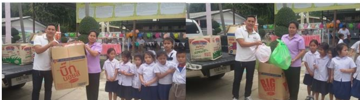
บริษัท สยาม โซลาร์ เอ็นเนอร์ยี 1 จำกัด สาขา SSE1 – PV01 ร่วมสนับสนุนการจัดกิจกรรมวันเด็ก ณ โรงเรียนบ้านวังใหญ่ ต.ช่องด่าน อ.บ่อพลอย จ.กาญจนบุรี