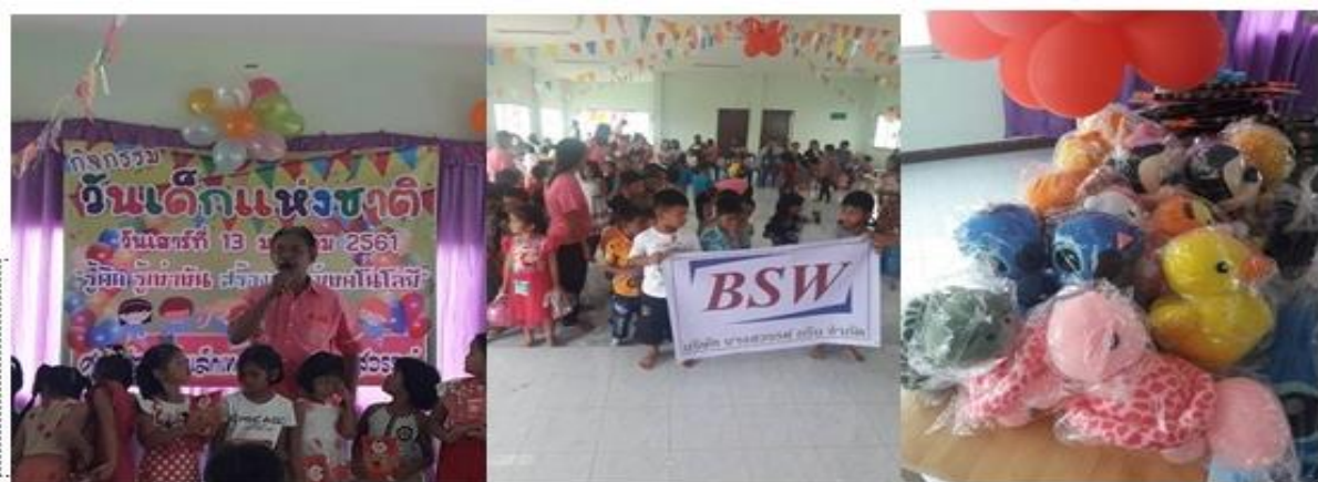
บริษัท บางสวรค์ กรีน จำกัด ร่วมมอบตุ๊กตา ขนม และเครื่องดื่ม ในกิจกรรมงานวันเด็กปี 2561 ณ ศูนย์พัฒนาเด็กเล็ก เทศบาลตำบลบางสวรค์ จ.สุราษฎร์ธานี