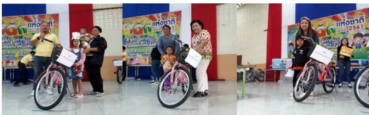
บริษัท สยาม โซลาร์ เอ็นเนอร์ยี 1 สาขา SSE1 – PV02 ร่วมมอบจักรยานจำนวน 3 คัน ในการจัดกิจกรรมวันเด็ก ณ สำนักงานเทศบาลตำบลสระกระโจม อ.ดอนเจดีย์ จ.สุพรรณบุรี