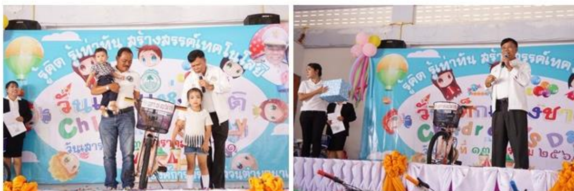
บริษัท ออัสการ์ เซฟ เดอะ เวิลด์ จำกัด ร่วมจัดกิจกรรมงานวันเด็ก และมอบจักรยานเพื่อเป็นของขวัญในกิจกรรมงานวันเด็ก ณ องค์การบริหารส่วนตำบลนาเชือก จ.นครศรีธรรมราช

กลุ่มบริษัทไทย โซลาร์ เอ็นเนอร์ยี ได้ดำเนินธุรกิจควบคู่กับการมีส่วนร่วมดูแลสังคม ชุมชน และสิ่งแวดล้อม ซึ่งเป็นส่วนหนึ่งของเป้าหมายในการพัฒนาองค์กรอย่างยั่งยืน นอกจากนี้ยังให้ความสำคัญกับการสร้างประโยชน์สุขต่อเด็กและเยาวชนในวัยศึกษา ซึ่งนับเป็นพลังสำคัญที่จะดูแลสังคมและประเทศในอนาคต