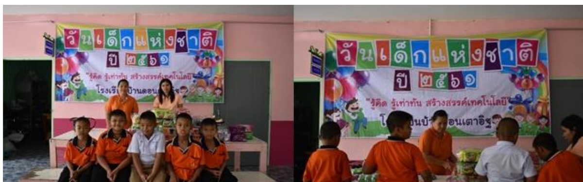
บริษัท สยาม โซลาร์ เอ็นเนอร์ยี 1 จำกัด สาขา SSE1 – PV08 ร่วมสนับสนุนการจัดกิจกรรมงานวันเด็ก ณ โรงเรียนบ้านดอนเตาอิฐ ต.รางหวาย อ.พนมทวน จ.กาญจนบุรี