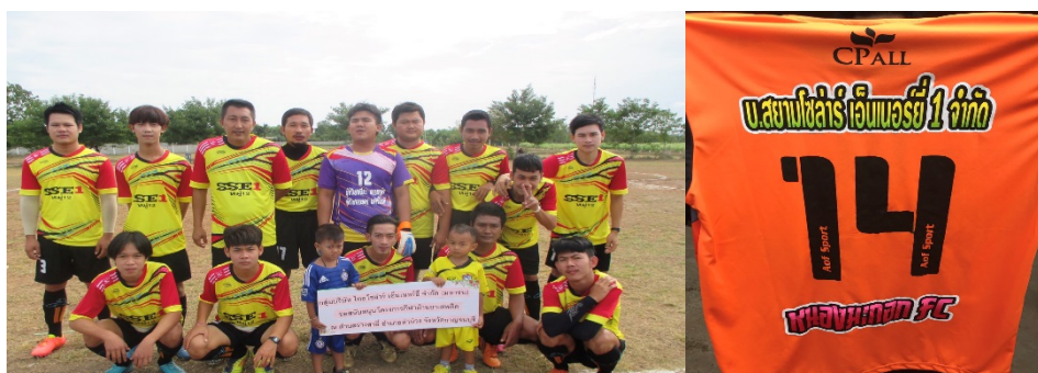
บริษัท สยาม โซลาร์ เอ็นเนอร์ยี 1 จำกัด สาขา SSE1 – PV07 ร่วมสนับสนุนชุดกีฬาโครงการกีฬาต่อต้านยาเสพติด ณ ต.รางสาลี่ อ.ท่าม่วง จ.กาญจนบุรี

นอกจากนี้ ตลอดปี 2561 กลุ่มบริษัทฯ ได้จัดกิจกรรมเพื่อสังคมและสิ่งแวดล้อมอย่างต่อเนื่อง อาทิ