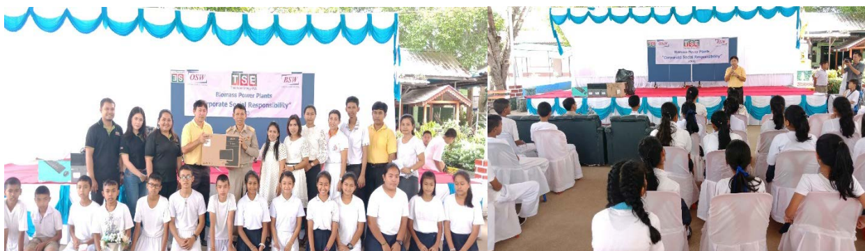
บริษัท ออสการ์ เซฟ เดอะ เวิลด์ จำกัด ร่วมจัดกิจกรรมโครงการ CSR "ปันรัก ปันน้ำใจ กลุ่มบริษัท ไทย โซลาร์ เอ็นเนอร์ยี สู่ โรงเรียนชนบท ครั้งที่ 1" มอบโต๊ะปิงปองและคอมพิวเตอร์ ณ โรงเรียนวัดสามัคคีนุกูล ตำบลไสหร้า จ.นครศรีธรรมราช