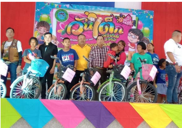
บริษัท สยาม โซลาร์ เอ็นเนอร์ยี 1 จำกัด สาขา SSE1 – PV01 ร่วมสนับสนุนการจัดกิจกรรมวันเด็ก 2562 ณ โรงเรียนบ้านวังใหญ่ ต.ช่องด่าน อ.บ่อพลอย จ.กาญจนบุรี