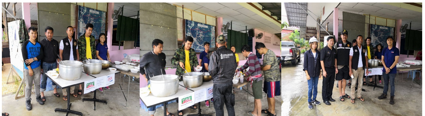
บริษัท ออสการ์ เซฟ เดอะ เวิลด์ จำกัด ร่วมกันช่วยผู้ประสบภัยน้ำท่วมภาคใต้ 2562

นอกจากนี้ ตลอดปี 2562 กลุ่มบริษัทฯ ได้จัดกิจกรรมเพื่อสังคมและสิ่งแวดล้อมอย่างต่อเนื่อง อาทิ