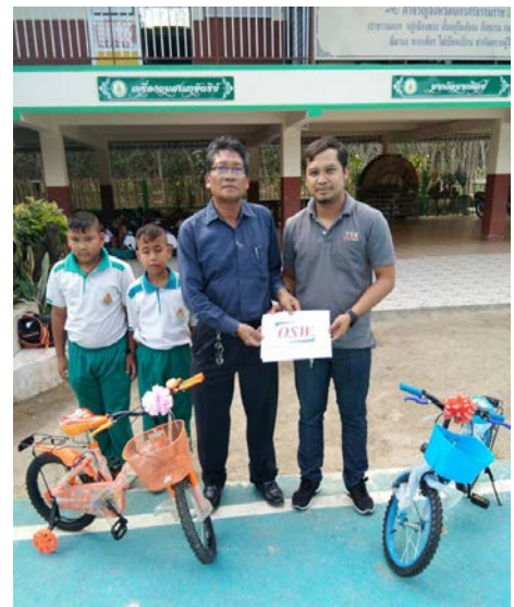
บริษัท ออสการ์ เซฟ เดอะ เวิลด์ จำกัด ร่วมมอบจักรยานใน กิจกรรมงานวันเด็กปี 2562 ณ โรงเรียนบ้านโคกมะขาม ต.นาเขลียง จ.นครศรีธรรมราช