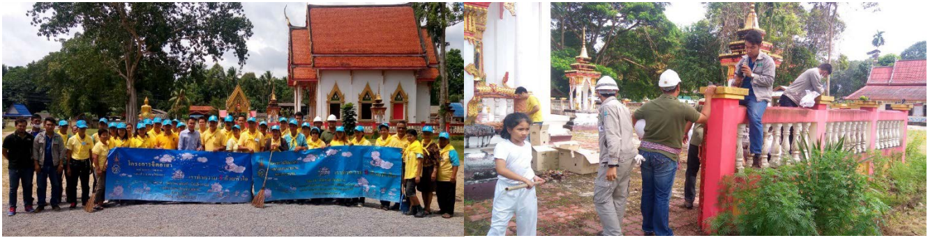
บริษัท ออสการ์ เซฟ เดอะ เวิลด์ จำกัด ร่วมกับสำนักงานอุตสาหกรรมจังหวัดนครศรีธรรมราช จัดกิจกรรมโครงการจิตอาสาพิทักษ์ศาสนสถานติดตั้ง/ซ่อมแซมระบบไฟฟ้า ณ วัดโคกหาด ต.ไสหรั จ.นครศรีธรรมราช