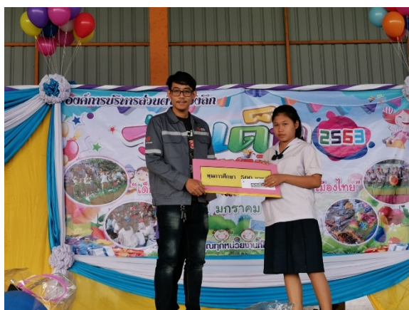
บริษัท ไทย โซลาร์ เอ็นเนอร์ยี จำกัด (มหาชน) และบริษัทย่อย ร่วมมอบทุนการศึกษาให้แก่เด็กนักเรียนในกิจกรรมงานวันเด็กแห่งชาติ ณ องค์การบริหารส่วนตำบลวังลึก จังหวัดสุพรรณบุรี