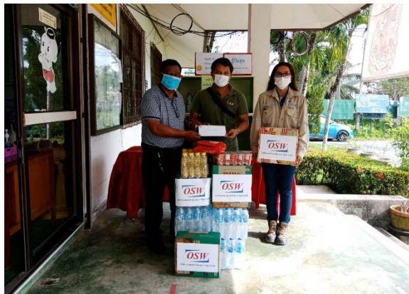
บริษัท ไทย โซลาร์ เอ็นเนอร์ยี จำกัด (มหาชน) และบริษัทย่อย ร่วมมอบสิ่งของใส่ตู้ปันสุข เพื่อช่วยเหลือประชาชนที่ได้รับผลกระทบ โควิด-19 ณ องค์การบริหารส่วนตำบลไสหาร อ.ฉวาง จ.นครศรีธรรมราช