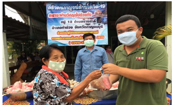
บริษัท ไทย โซลาร์ เอ็นเนอร์ยี จำกัด (มหาชน) และบริษัทย่อย ร่วมแจกอาหารช่วยเหลือประชาชนที่ได้รับผลกระทบ โควิด-19 ณ ที่ทำการผู้ใหญ่บ้านหมู่ 12 อ.ท่าม่วง จ.กาญจนบุรี