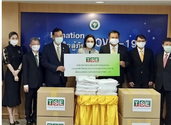
บริษัท ไทย โซลาร์ เอ็นเนอร์ยี จำกัด (มหาชน) มอบชุดอุปกรณ์ป้องกันความปลอดภัยส่วนบุคคล หรือ PPE จำนวน 500 ชุด เพื่อส่งต่อความห่วงใยและดูแลความปลอดภัยของบุคลากรทางการแพทย์ที่เฝ้าระวังและดูแลรักษาผู้ป่วยโรคติดเชื้อไวรัสโคโรนา 2019 (โควิด-19) ณ กระทรวงสาธารณสุข