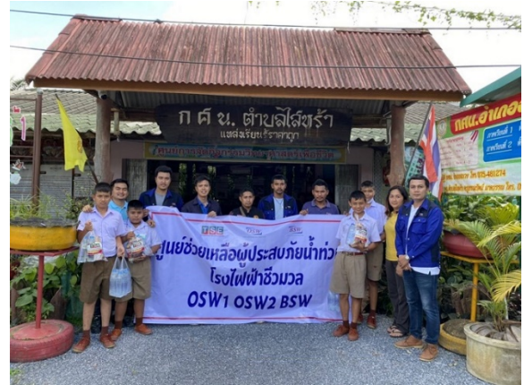
บริษัท ไทย โซลาร์ เอ็นเนอร์ยี จำกัด (มหาชน) และบริษัทย่อย มอบถุงยังชีพและน้ำดื่มให้แก่ผู้ประสบอุทกภัยใน ต.ไสหาร อ.ฉวาง จ.นครศรีธรรมราช