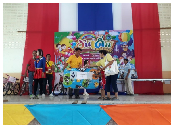
บริษัท ไทย โซลาร์ เอ็นเนอร์ยี จำกัด (มหาชน) และบริษัทย่อย ร่วมมอบของรางวัลและขนมในกิจกรรมงานวันเด็กแห่งชาติ ณ เทศบาลสระกระโจม ตำบลดอนเจดีย์ จังหวัดสุพรรณบุรี