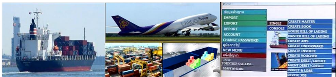
ตัวอย่างภาพการขนส่งระหว่างประเทศและการจัดตู้คอนเทนเนอร์