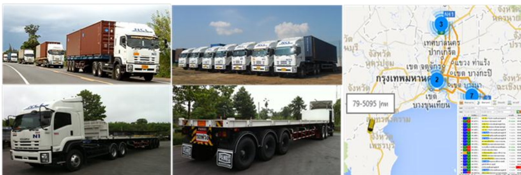
ตัวอย่างภาพรถบรรทุกหัวลาก-ทางลาก