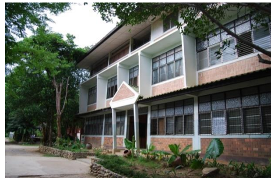
อาคารที่พักของเด็กผู้ชาย, ห้องเรียน, ห้องสมุด, ห้องหย่อนใจ, ห้องพักพระสงฆ์ และ ห้องรับแขก