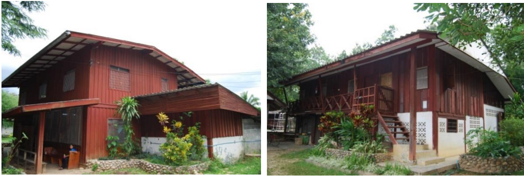
บ้านพักของเด็กผู้หญิงและบ้านพักของซิสเตอร์ที่จะรื้อและสร้างศูนย์การเรียนรู้

ในโครงการนี้ ทางศูนย์ฯ มีความต้องการที่จะรื้อบ้านพักของเด็กผู้หญิงและบ้านพักซิสเตอร์ที่เป็นเรือนไม้ 2 ชั้น ทั้งสองหลังนี้ เพื่อสร้างเป็นศูนย์การเรียนรู้และฝึกอาชีพ