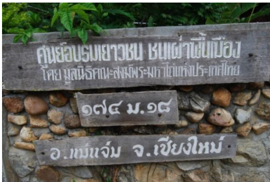
ป้ายทางเข้าหน้าศูนย์ฯ