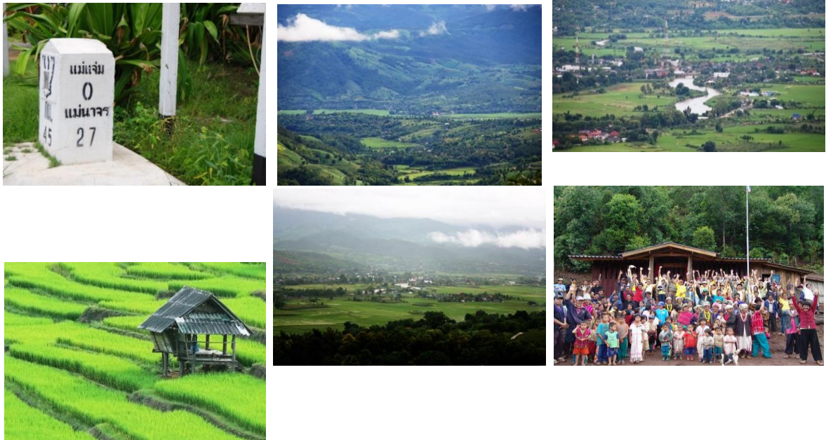
ภาพอำเภอแม่แจ่ม จังหวัดเชียงใหม่