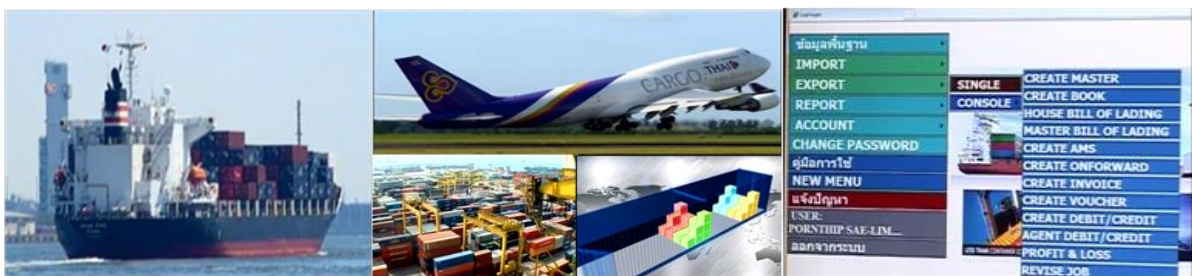
ตัวอย่างภาพการขนส่งระหว่างประเทศและการจัดตู้คอนเทนเนอร์

1.1.3 บริการอื่น ๆ : บริษัทฯ มีการให้บริการด้านพิธีการศุลกากรและเอกสารต่าง ๆ ที่เกี่ยวข้อง ตลอดจนการเป็นตัวแทนในการออกสินค้าให้แก่ลูกค้า ซึ่งการดำเนินการดังกล่าวต้องอาศัยผู้ที่มีความเชี่ยวชาญด้านพิธีการศุลกากรและกฎระเบียบเกี่ยวกับการนำเข้า-ส่งออก เพื่อให้ลูกค้าสามารถปฏิบัติตามข้อกำหนดที่เกี่ยวข้องในแต่ละประเทศได้อย่างถูกต้องและสามารถรับหรือส่งสินค้าไปยังจุดหมายปลายทางได้ตรงตามกำหนดเวลา