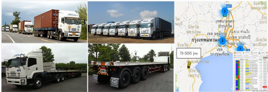
ตัวอย่างภาพรถบรรทุกหัวลาก-หางลาก

ท่าเรือแหลมฉบัง ท่าเรือคลองเตย และแบบระยะทางไกลโดยการนำตู้คอนเทนเนอร์เปล่าไปปรับสินค้าในจังหวัดแถบภาคกลางและภาคตะวันออกแล้วนำสินค้ากลับมาส่งที่ท่าเรือแหลมฉบัง และท่าเรือคลองเตย