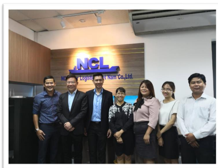
คณะผู้บริหาร NCL เข้าตรวจเยี่ยมสำนักงาน NCL Inter Logistics Viet Nam Co.,Ltd. ประเทศเวียดนาม ระหว่างวันที่ 17-18 กันยายน 2561