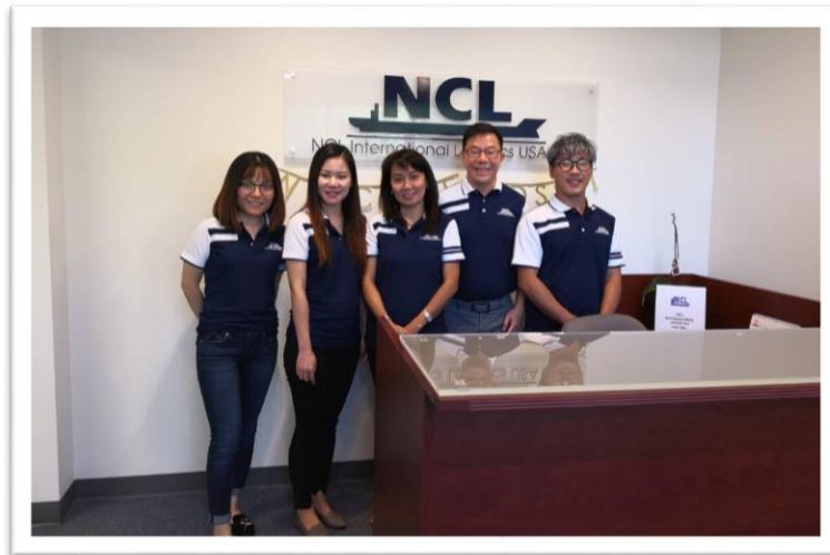
คณะผู้บริหาร NCL เข้าตรวจเยี่ยมสำนักงาน NCL International Logistics USA Inc. ประเทศสหรัฐอเมริกา เมื่อวันที่ 1 ตุลาคม 2561 ที่ผ่านมา