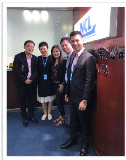
คณะผู้บริหาร NCL ตรวจเยี่ยมสำนักงาน Qingdao NCL Co., Ltd. ประเทศจีน ระหว่างวันที่ 11 - 13 กันยายน 2561