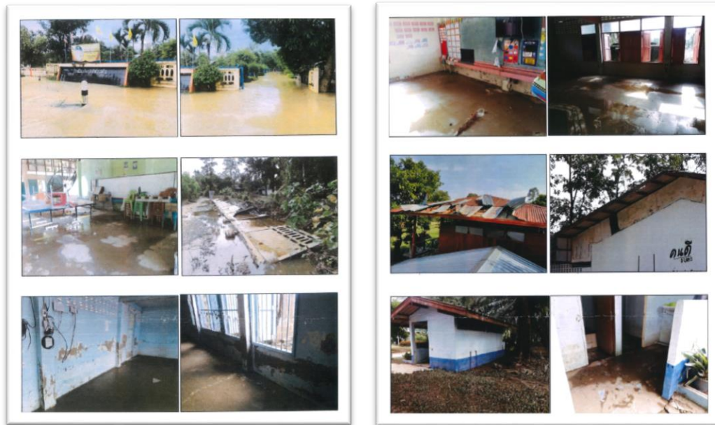
ภาพก่อนปรับปรุง