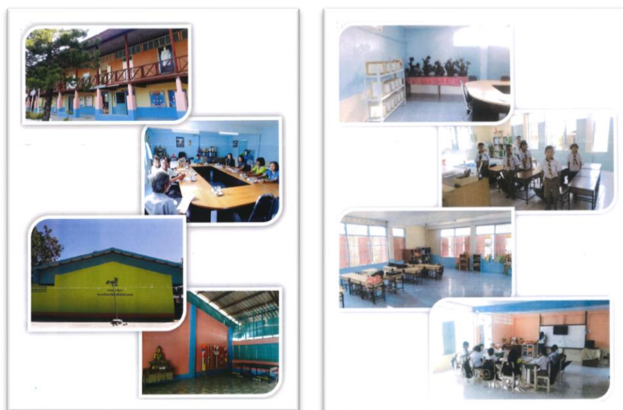
ภาพหลังปรับปรุง