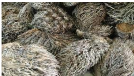
ทะลายปาล์ม