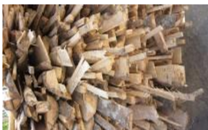
ปึกไม้ยางพารา