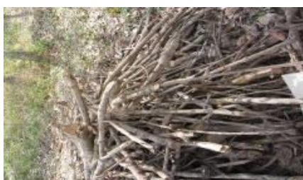
เศษไม้ยางพารา