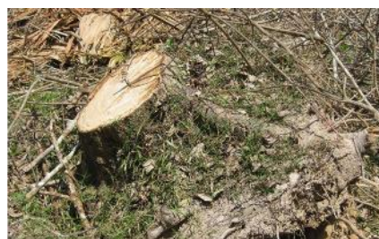
ตอไม้ยางพารา