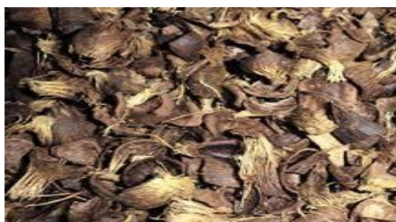
เปลือกปาล์ม