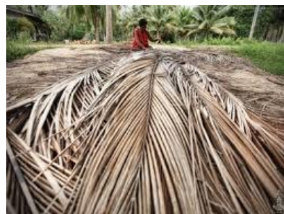
ทางมะพร้าว

ในบริเวณ 4 จังหวัดข้างต้น เป็นแหล่งในการทำสวนมะพร้าวที่สำคัญของประเทศไทย โดยการปลูกส่วนใหญ่เป็นการปลูกเชิงพาณิชย์เพื่อแปรรูปและส่งออกเป็นหลัก และจากการทำสวนมะพร้าวอย่างแพร่หลายในบริเวณดังกล่าวทำให้บริษัทฯ สามารถจัดหาทางมะพร้าวจำนวนมากจากสวนมะพร้าว นอกจากนั้น บริเวณ 4 จังหวัดข้างต้นยังเป็นที่ตั้งของโรงงานผลิตน้ำมะพร้าวกระป๋อง และโรงแปรรูปมะพร้าวจำนวนมาก ผลพลอยได้จากโรงงานดังกล่าวคือเปลือกและกะลามะพร้าวซึ่ง MGP จะใช้เป็นเชื้อเพลิงหลักในการผลิตไฟฟ้า โดยพื้นที่เพาะปลูกมะพร้าวใน 4 จังหวัดดังกล่าวสามารถสรุปได้ดังนี้