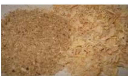
ขี้เลื่อย

ต้นยางพาราซึ่งเป็นเชื้อเพลิงหลักสำหรับโรงไฟฟ้าชีวมวลของ CRB และ TSG เป็นพืชเศรษฐกิจที่สำคัญของประเทศไทย ซึ่งพื้นที่เพาะปลูกยางพาราส่วนใหญ่อยู่ในเขตภาคใต้ของประเทศไทย โดยทั่วไปเมื่อต้นยางพารามีอายุประมาณ 25 - 30 ปี จะให้ปริมาณและคุณภาพของน้ำยางที่ลดลงซึ่งส่งผลให้เกษตรกรต้องโค่นต้นยางพาราเพื่อปลูกต้นยางพาราใหม่ทดแทน ดังนั้นการโค่นต้นยางพาราที่ทำการทุกปี จะนำไปสู่แหล่งเชื้อเพลิงสำหรับโรงไฟฟ้าชีวมวลที่มีอย่างต่อเนื่อง โดยส่วนของลำต้นยางพาราจะถูกนำไปทำเฟอร์นิเจอร์เป็นส่วนใหญ่ ส่วนที่เหลือคือ ตอไม้ ราก ปึกไม้ และเศษไม้ยางพารา ไม่ได้ถูกนำไปใช้ประโยชน์อื่นใด ดังนั้นส่วนตอไม้ ราก ปึกไม้ และเศษไม้ยางพารา รวมทั้งขี้เลื่อยที่ได้จากการแปรรูปไม้ยางพารา จะสามารถนำมาใช้เป็นเชื้อเพลิงหลักในการผลิตไฟฟ้าของโรงไฟฟ้า CRB และ TSG โดยมีพื้นที่เพาะปลูกต้นยางพาราใน 4 จังหวัดดังกล่าวสามารถสรุปได้ดังนี้