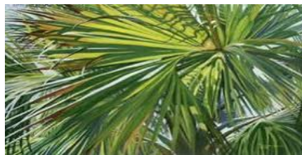
ทางปาล์ม