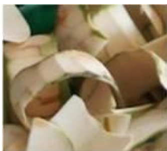
เปลือกมะพร้าว

ทั้งนี้ก่อนพัฒนาโครงการโรงไฟฟ้าชีวมวลของ MGP ได้มีการทำการสำรวจเชื้อเพลิงในรัศมีที่สามารถขนส่งมายังโรงไฟฟ้าได้ ซึ่งครอบคลุมทั้งหมด 4 จังหวัด ได้แก่ สมุทรสาคร สมุทรสงคราม นครปฐม และราชบุรี พบว่ามีเชื้อเพลิงหลักจากเปลือก กะลา และทางมะพร้าวเพียงพอต่อความต้องการของโรงไฟฟ้าชีวมวลของ MGP