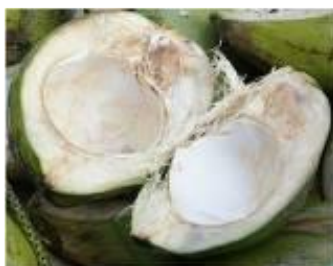
กะลามะพร้าว