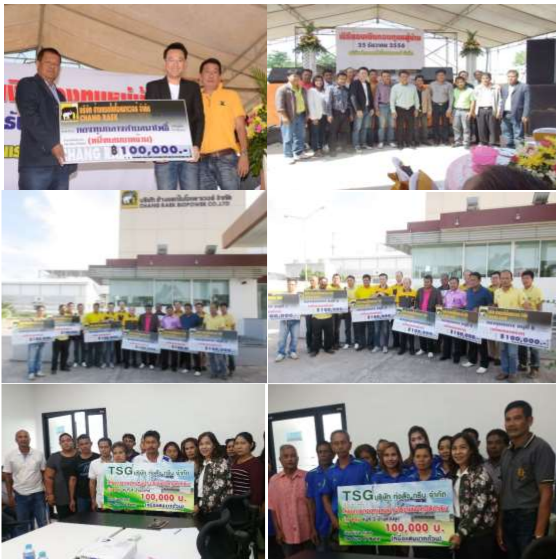
ภาพการมอบเงินให้กับกองทุนหมู่บ้านของโรงไฟฟ้าบริษัทย่อย

เพื่อรับผิดชอบในส่วนของผลกระทบของชุมชนรอบข้างโรงไฟฟ้า บริษัทฯ และบริษัทย่อยจึงได้กำหนดนโยบายจัดตั้งกองทุนชุมชนรอบโรงไฟฟ้า โดยทุกหน่วยการผลิตกระแสไฟฟ้าที่โรงไฟฟ้าสามารถผลิตได้นั้นโรงไฟฟ้าจะสมทบเงินให้แก่กองทุนของคณะกรรมการกำกับกิจการพลังงาน 1 สตางค์ต่อหน่วยผลิตไฟฟ้าตามที่กฎหมายกำหนด ซึ่งเงินกองทุนนี้ชุมชนสามารถนำไปพัฒนาชุมชนในส่วนต่างๆ ได้ต่อไป นอกจากนี้ในทุกปี ตั้งแต่ปี 2556 จนถึงปัจจุบัน CRB ได้สมทบเงินเพิ่มเติมให้แก่หมู่บ้านรอบโรงไฟฟ้า 100,000 บาทต่อหมู่บ้าน จำนวน 5 หมู่บ้าน และ 1 อบต รวมเป็นเงิน 600,000 บาท เพื่อเป็นการสนับสนุนโครงการและกิจกรรมต่างๆ ของชุมชนในการพัฒนาหมู่บ้าน การพัฒนาอาชีพ ซึ่งเป็นการกระตุ้นเศรษฐกิจในระดับรากหญ้าและเสริมสร้างภูมิคุ้มกันทางเศรษฐกิจและสังคมของประชาชนและเสริมสร้างความเข้มแข็งของชุมชน