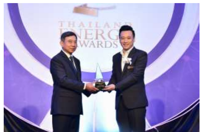
ภาพ MWE ได้รับรางวัล Thailand Energy Awards 2018