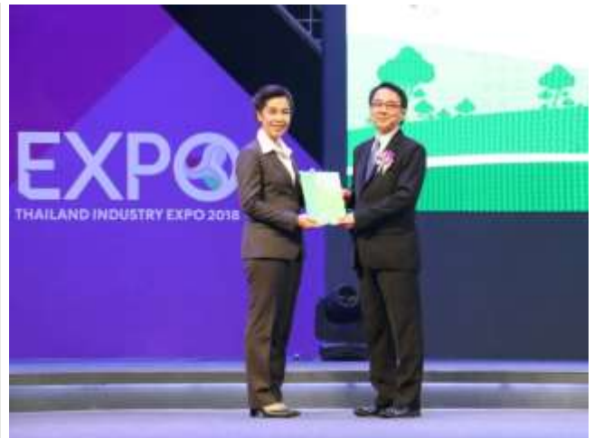
ภาพ: CRB รับมอบรางวัลทรัพยากรสิ่งแวดล้อม ปี 2561