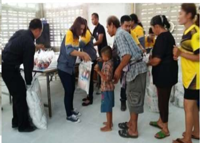
ภาพ โรงไฟฟ้า TSG และ CRB มอบถุงยังชีพเพื่อช่วยเหลือผู้ประสบอุทกภัย จ.นครศรีธรรมราช