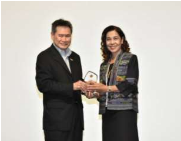
CRB: ASEAN Renewable Energy Project Awards 2018

บริษัทฯ ได้รับคัดเลือกให้ติดอันดับ ESG100 (Environmental, Social and Governance) ปี 2561 โดยติดอันดับ ESG100 3 ปีซ้อน ตั้งแต่ปี 2559 ใน กลุ่มทรัพยากร จากสถาบันไทยพัฒน์ ซึ่งทำการประเมินการดำเนินงานด้านสิ่งแวดล้อม สังคม ทรัพยากร และผลประกอบการ จากหลักการแนวทางตามมาตรฐานการประเมินความยั่งยืนของ GISR (Global Initiative for Sustainability Ratings)