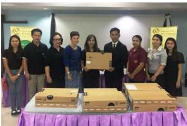
ภาพ มอบคอมพิวเตอร์ให้วิทยาลัยเทคนิคแม่วงก์ จ.นครสวรรค์