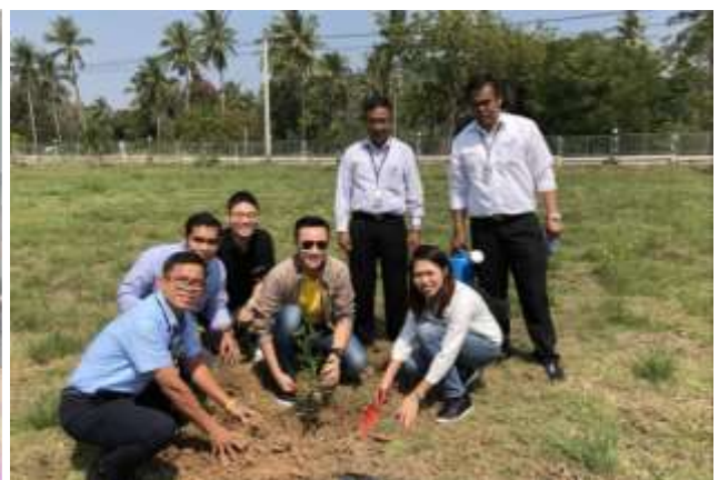
ภาพ ร่วมปลูกต้นไม้ให้ชุมชน จ.ประจวบคีรีขันธ์