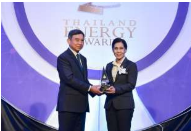
ภาพ CRB ได้รับรางวัล Thailand Energy Awards 2018