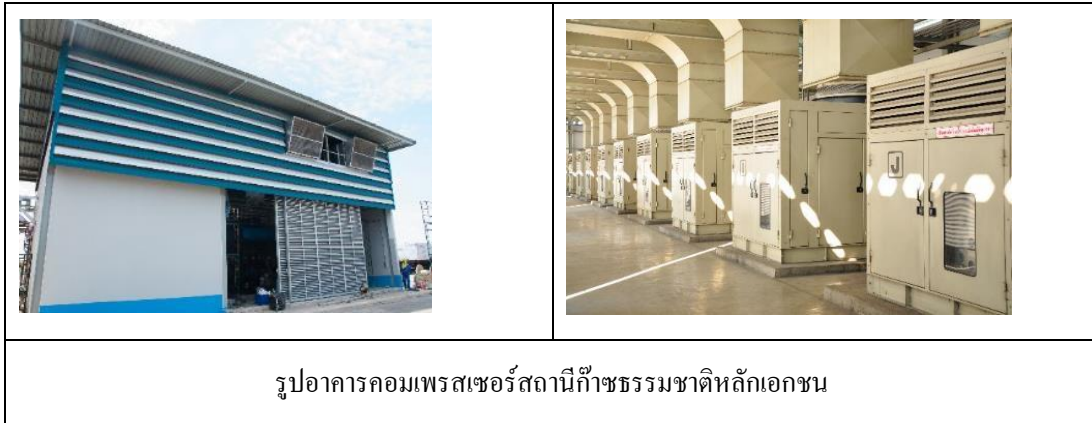
รูปอาคารคอมเพรสเซอร์สถานีก๊าซธรรมชาติหลักเอกราช