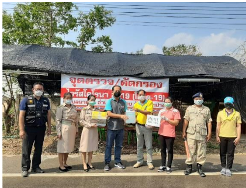
สนับสนุนเจลแอลกอฮอล์ ให้กับจุดคัดกรองในเขตตำบลแม่กัวะ อำเภอสบปราบ จังหวัดลำปาง