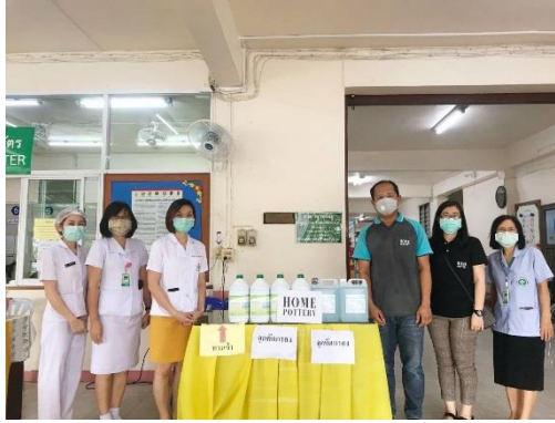
สนับสนุนเจลแอลกอฮอล์ ให้กับโรงพยาบาลสบปราบ อำเภอสบปราบ จังหวัดลำปาง