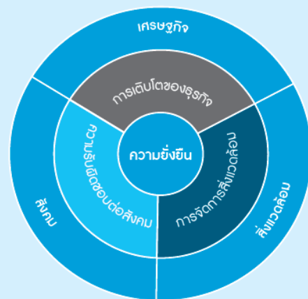
กรอบการพัฒนาความยั่งยืน บริษัท อาซีฟา จำกัด (มหาชน)

ทั้งนี้ กรอบการพัฒนาความยั่งยืนของบริษัทฯ ครอบคลุมในประเด็น เศรษฐกิจ สังคม และสิ่งแวดล้อม เป็นสำคัญ