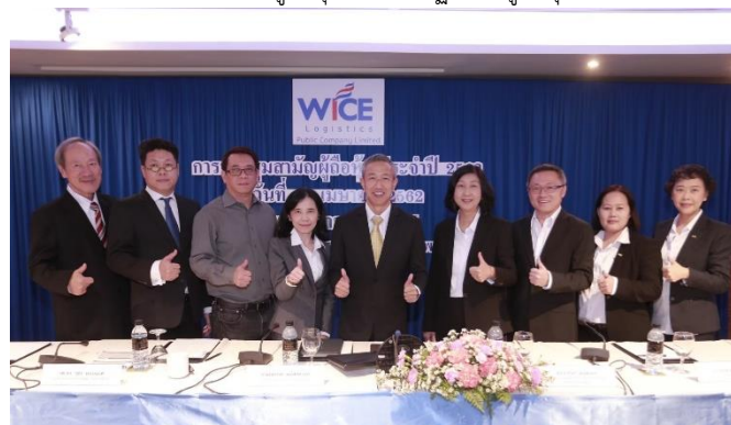
การประชุมสามัญผู้ถือหุ้น ประจำปี 2562

บริษัทฯ ให้ความสำคัญสิทธิขั้นพื้นฐานของผู้ถือหุ้น และปฏิบัติต่อผู้ถือหุ้นทุกรายอย่างเท่าเทียมกัน สร้างความพึงพอใจสูงสุดให้กับผู้ถือหุ้น เช่น สิทธิในการเข้าร่วมประชุมสามัญประจำปีสิทธิในการออกเสียงลงคะแนน การเสนอระเบียบวาระการประชุมและเสนอชื่อบุคคลเข้ารับเลือกเป็นกรรมการ การรับฟังความคิดเห็นและข้อเสนอแนะของผู้ถือหุ้น รวมทั้งจัดให้มีช่องทางติดต่อกับผู้ถือหุ้นทางเว็บไซต์ www.wice.co.th และอีเมล secretary2@wice.co.th ตามที่เปิดเผยในหัวข้อสิทธิของผู้ถือหุ้นและการปฏิบัติต่อผู้ถือหุ้นอย่างเท่าเทียมกัน