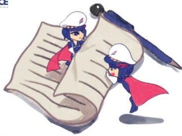
Use both sides of paper