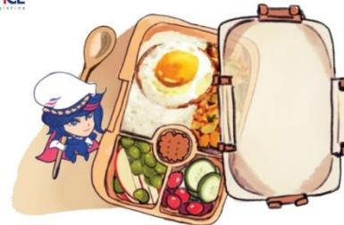
Bring lunchbox to cut plastic waste