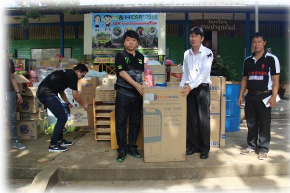
โรงเรียนสวนป่าอุปถัมภ์ ตำบลลาดกระโทง อำเภอสนาชยเขต จังหวัดฉะเชิงเทรา