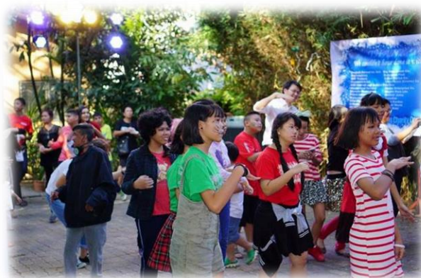
โรงเรียนบ้านเด็กgramอินทรา (บ้านเด็กตามอดผู้พิการซ้ำซ้อน) ถนนรามอินทรา บางเขน กรุงเทพฯ