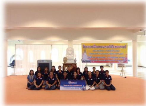
วัดพระธาตุผาซ่อนแก้ว ตำบลแคมป์สน อำเภอเขาค้อ จังหวัดเพชรบูรณ์

บริษัทฯ จัดทำกิจกรรมเพื่อประโยชน์ต่อสังคมและสิ่งแวดล้อมอย่างสม่ำเสมอ สำหรับปี 2559 บริษัทฯ ยังคงสานต่อ “โครงการ CSR-MASTERKOO ร้อยความเย็น สู้สังคม” ซึ่งมีจุดประสงค์เพื่อมอบผลิตภัณฑ์ของบริษัทฯ ให้เป็นสาธารณประโยชน์แก่หน่วยงานต่างๆ ที่ประสบปัญหาอากาศร้อน และมีปัญหาเรื่องค่าไฟฟ้าของเครื่องปรับอากาศ โดยได้มีการมอบผลิตภัณฑ์ของบริษัทฯ ในโครงการดังกล่าวให้กับหลายหน่วยงาน โดยส่วนหนึ่งของปี 2559 มีดังนี้