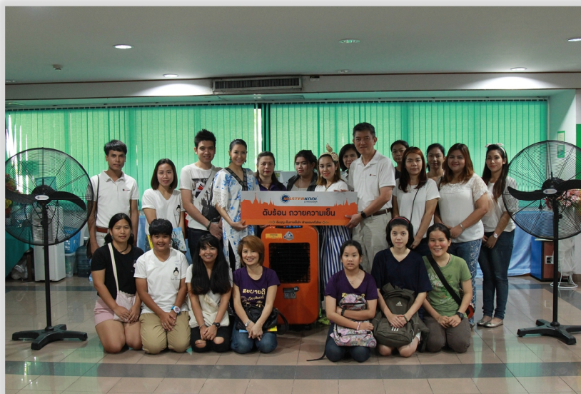
โรงพยาบาลสงฆ์

บริษัทฯ จัดทำกิจกรรมเพื่อประโยชน์ต่อสังคมและสิ่งแวดล้อมอย่างสม่ำเสมอ สำหรับปี 2558 บริษัทฯ ยังคงสานต่อ “โครงการ CSR-MASTERKOOOL ร้อยความเย็น สู้สังคม” จากปี 2557 ซึ่งมีจุดประสงค์เพื่อมอบผลิตภัณฑ์ของบริษัทฯ เพื่อเป็นสาธารณประโยชน์แก่หน่วยงานต่างๆ ที่ประสบปัญหาอากาศร้อน และมีปัญหาเรื่องค่าไฟฟ้าของเครื่องปรับอากาศ โดยได้มีการมอบผลิตภัณฑ์ของบริษัทฯ ในโครงการดังกล่าวให้กับหลายหน่วยงาน