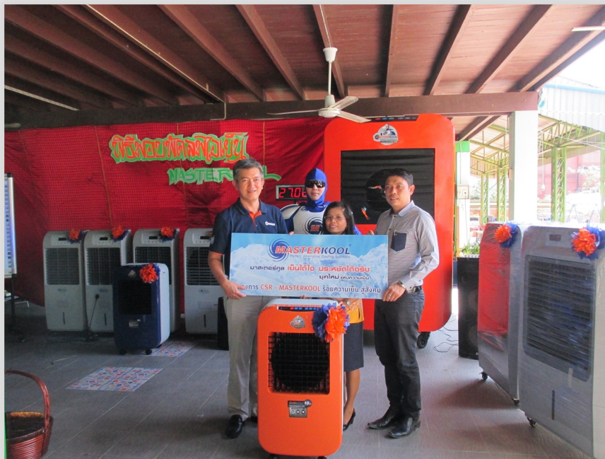
โรงเรียนบ้านท้อดั่ง จ.สมุทรปราการ