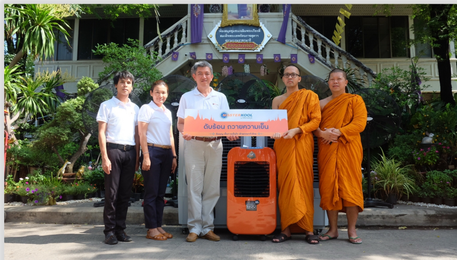
วัดพระราม 9 กาญจนาภิเษก