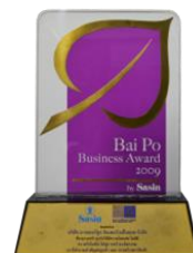
BAI PO BUSINESS AWARD 2009 ธนาคารไทยพาณิชย์ร่วมกับสตินท์