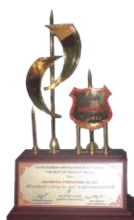
BEST PRODUCT 2002