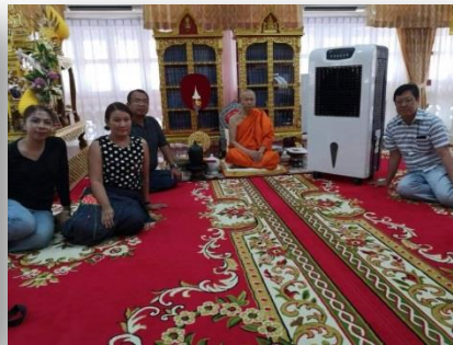
กิจกรรมถวายพัดลมไอเย็น ณ วัดสุทัศน์เทพวรารามราชวรมหาวิหาร