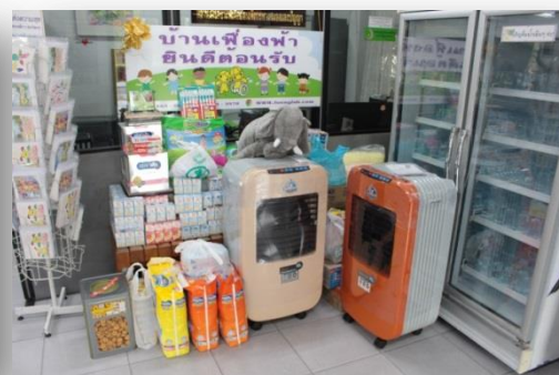
กิจกรรมเลี้ยงอาหารและมอบเครื่องบริโภคมุข ณ สถานสงเคราะห์เด็กอ่อนและพิการทางสมองและปัญญา ตำบลบางตลาด อำเภอปากเกร็ด จังหวัดนนทบุรี