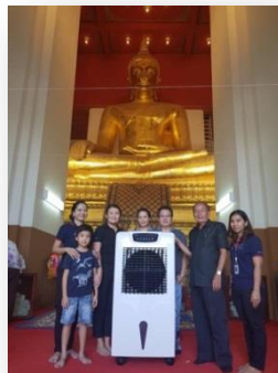
กิจกรรมถวายพัดลมไอเย็น ณ วิหารพระมงคลบพิตร ซึ่งเป็นวัดอารามหลวงตั้งอยู่ที่ตำบลประตูลี้ อำเภอมหาราช จังหวัดพระนครศรีอยุธยา

ในปี 2561 ที่ผ่านมา ผู้บริหารและพนักงานของบริษัทฯ ได้นำพัดลมไปถวาย และมอบเพื่อเป็นประโยชน์ต่อศาสนกิจ สถานที่สำหรับบริการประชาชน และสถานสงเคราะห์ต่างๆ