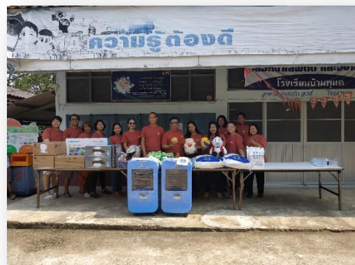
ณ โรงเรียนบ้านพุด จังหวัดราชบุรี

นอกจากนั้นในปี 2562 ที่ผ่านมา บริษัทฯ ได้สนับสนุนเขตกรุงเทพมหานครในการติดตั้งหอพักอากาศบริเวณหน้าห้างสรรพสินค้าเซ็นทรัลเวิลด์ เพื่อช่วยบรรเทาผลกระทบจากฝุ่นพิษ PM2.5 ให้กับประชาชนผู้สัญจรทั่วไปอีกด้วย