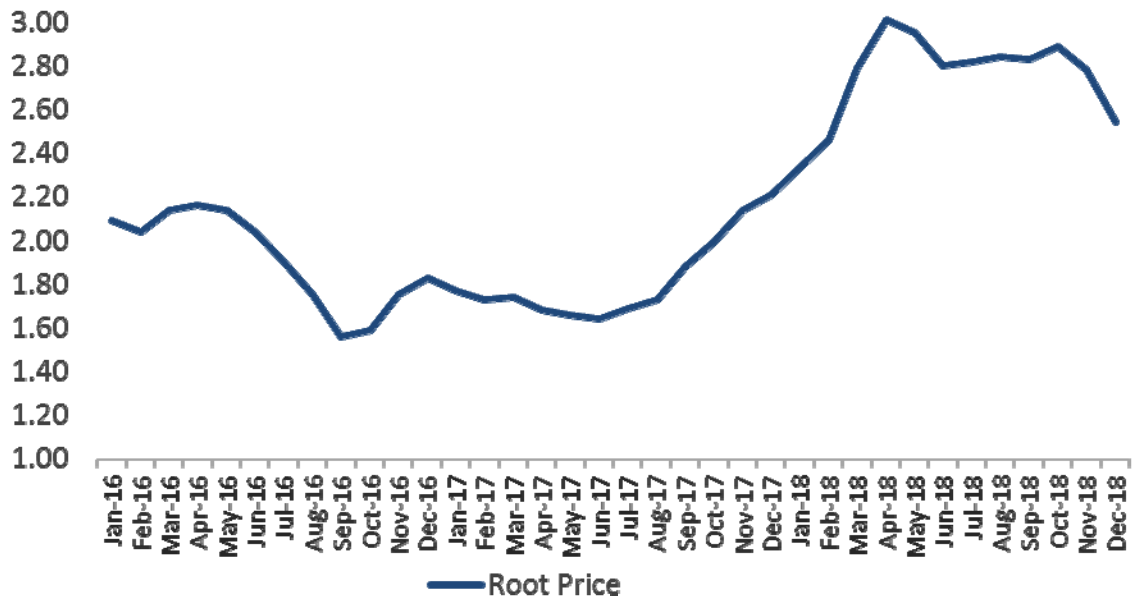
แผนภาพ 2 แสดงราคาวัตถุดิบห้วมันสำปะหลังย้อนหลัง 3 ปี

ในช่วงปี 2561 ราคาห้วมันสำปะหลังในประเทศมีการปรับตัวสูงขึ้นอย่างมีนัยสำคัญ โดยราคาต้นทุนวัตถุดิบห้วมันสำปะหลังอยู่ในทิศทางขาขึ้นตลอดทั้งปี จากจุดต่ำสุดอยู่ที่ 1.64 บาทต่อกิโลกรัม ในช่วงกลางปี 2560 ขึ้นมาจุดสูงสุดอยู่ที่ 3.01 บาทต่อกิโลกรัม ในเดือนเมษายน 2561 ซึ่งถือว่าสูงสุดในรอบ 10 ปี ปัจจัยหลักเนื่องมาจากสภาวะขาดแคลนห้วมันสำปะหลังในประเทศไทย เวียดนาม และกัมพูชา สาเหตุจากเกษตรกรในเวียดนามและกัมพูชาเผชิญกับการระบาดของเชื้อไวรัสใบด่าง “คาซาวา โมซายิก” ในขณะที่ประเทศไทยเป็นเพียงประเทศเดียวที่ไม่ได้รับผลกระทบ ประกอบกับเกษตรกรหันไปปลูกพืชชนิดอื่นที่ให้ผลตอบแทนดีกว่า เช่น อ้อย