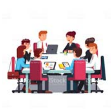
คณะกรรมการบริษัท