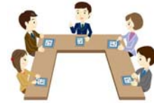
คณะกรรมการสรรหาและ กำหนดค่าตอบแทน