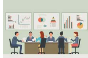
คณะกรรมการตรวจสอบและ บริหารความเสี่ยง