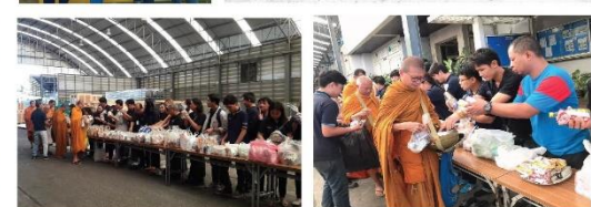
ส่งเสริมให้ยึดหลักศีลธรรมในการดำเนินชีวิต (Happy Soul)