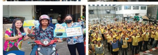
สร้างความผ่อนคลาย (Happy Relax)