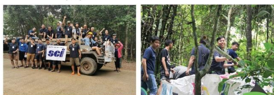
ส่งเสริมให้รู้จักการเป็นผู้ให้ มีน้ำใจ และเสียสละ (Happy Heart)