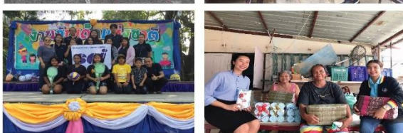
ส่งเสริมความรัก ความสามัคคี และความเอื้อเฟื้อเผื่อแผ่ (Happy Society)