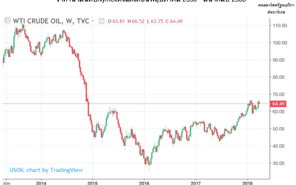
ราคาน้ำมันดิบ Nymex ตั้งแต่เดือนพฤษภาคม 2556 - มีนาคมปี 2560

ข้อมูลในเดือนมีนาคม 2560