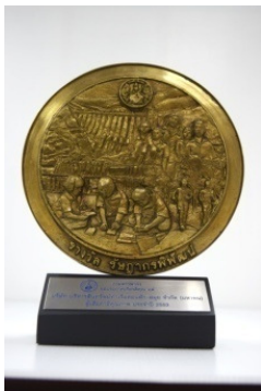
รางวัลรัฐภาพรพัฒนา

บริษัทให้ความสำคัญในการมุ่งเน้นปฏิบัติตามหลักการกำกับดูแลกิจการที่ดีในทุกส่วนงานและทุกกระบวนการทำงานทั้งองค์กร ซึ่งตั้งบนหลักพื้นฐานของความถูกต้อง โปร่งใส ยุติธรรม ตรวจสอบได้ นอกจากนี้ พันธกิจของบริษัทที่วางไว้ “มุ่งมั่นพัฒนาคุณภาพการบริหารจัดการแบบบูรณาการ” เพื่อให้สามารถตอบสนองต่อความต้องการของลูกค้าได้อย่างครอบคลุมสะท้อนให้เห็นถึงความเชื่อมั่นในหลักการกำกับดูแลกิจการที่ดีและมีความรับผิดชอบต่อสังคม ซึ่งบริษัทเร่งสร้างมาตรฐานการกำกับดูแลกิจการที่ดีอย่างต่อเนื่องโดยบริษัทยังได้รับรางวัลต่างๆ นับเป็นความสำเร็จและความภาคภูมิใจในการขับเคลื่อนองค์กรให้เติบโตได้อย่างยั่งยืนต่อไปในอนาคต