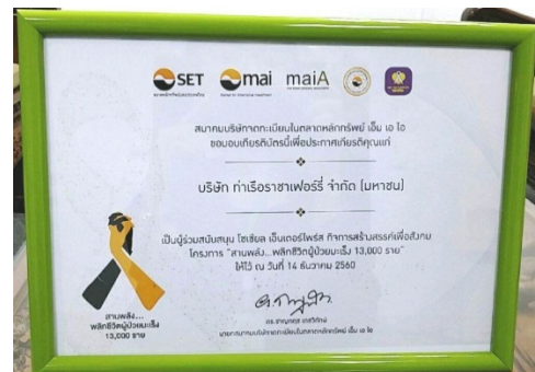
รางวัล Social Enterprise