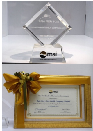
รางวัลThe Market of Alternative Investment