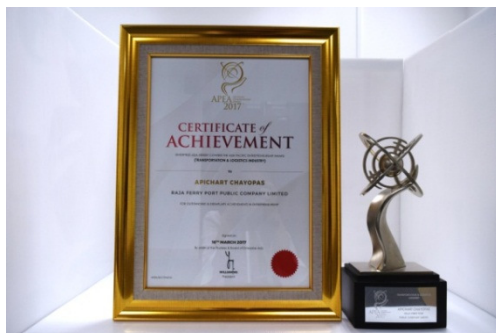
รางวัล Asia Pacific Entrepreneurship