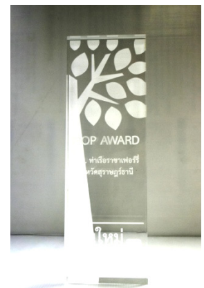
รางวัล IPOP Award