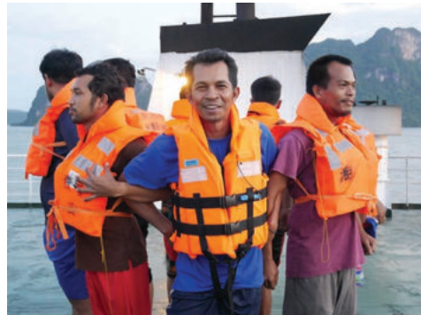
ฝึกซ้อมแผนฉุกเฉินบนเรือประจำปี 2563