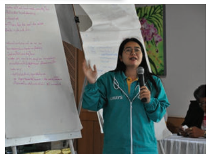
การสัมมนา Working Group แต่ละฝ่ายงาน