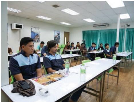
ฝึกอบรมคนประจำเรือ