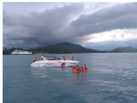
ซ้อมแผนเผชิญเหตุภัยพิบัติทางทะเล 24 กันยายน 2563