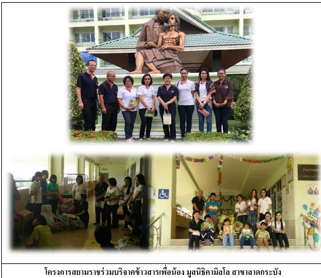
โครงการสยามราชร่วมบริจาคข้าวสารเพื่อน้อง มูลนิธิคามิลโล สาขาลาดกระบัง