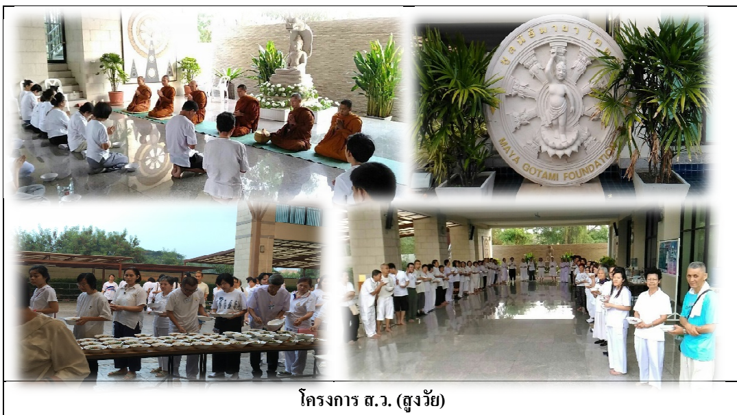
โครงการ ส.ว. (สูงวัย)

โครงการ ส.ว. (สูงวัย) เป็นโครงการที่บริษัทฯ จัดกิจกรรมขึ้นเพื่อส่งเสริมให้พนักงานมีจิตอาสาในการทำประโยชน์ต่อสังคม ช่วยเหลือผู้สูงอายุ และร่วมปฏิบัติธรรมกับผู้สูงอายุร่วมกับมูลนิธิมายาโกตมิ กรุงเทพมหานคร โครงการนี้เริ่มขึ้นในเดือนกันยายน ปี 2554 ถึงธันวาคม 2555 ในแต่ละเดือนจะผลัดเปลี่ยนหมุนเวียนพนักงานของแผนกต่างๆ ในการเป็นตัวแทนจิตอาสาเข้าร่วมกิจกรรมนี้ และตั้งแต่ปี 2554 จนถึงปัจจุบัน ก็ยังเปิดโอกาสให้พนักงานเข้าร่วมเป็นจิตอาสาธรรมบิกร และ เข้าร่วมปฏิบัติธรรมได้ตามความประสงค์