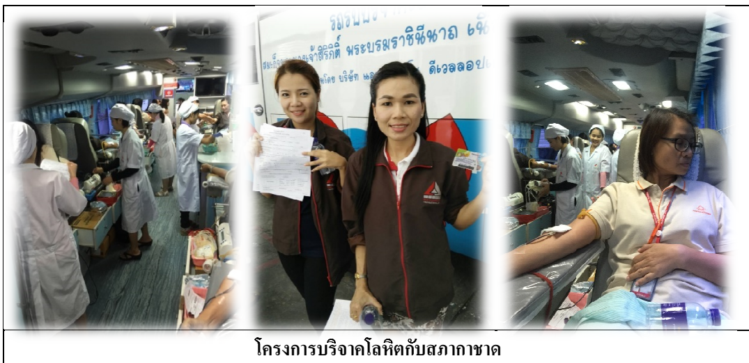
โครงการบริจาคโลหิตกับสภาอากาศ